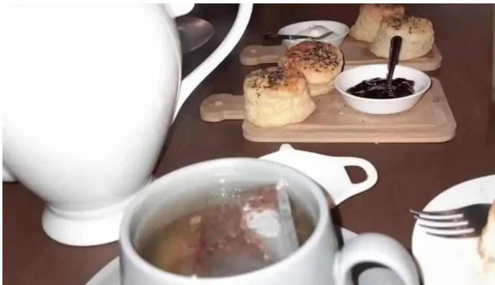
Mercado gastronomico melo mas recientes