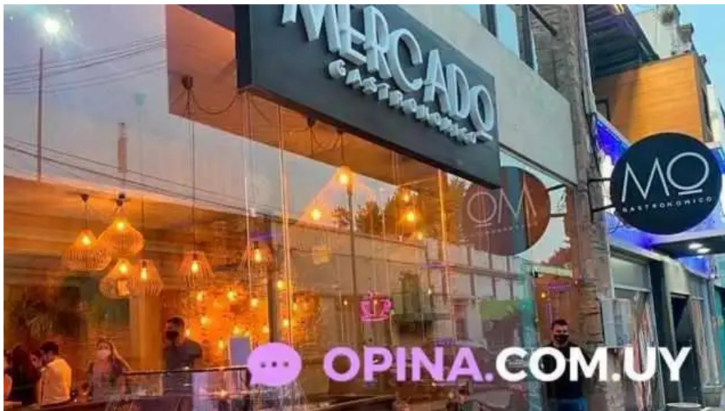
Mercado gastronomico melo melo