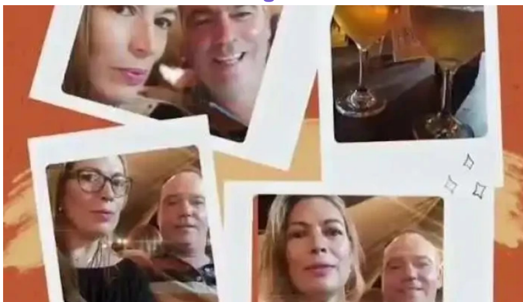
Mercado gastronomico melo videos