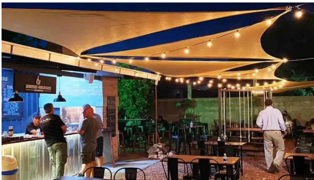
Mercado gastronomico melo ambiente