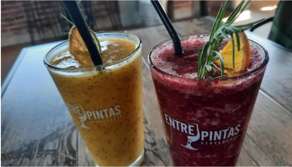
Mercado del prado jugo