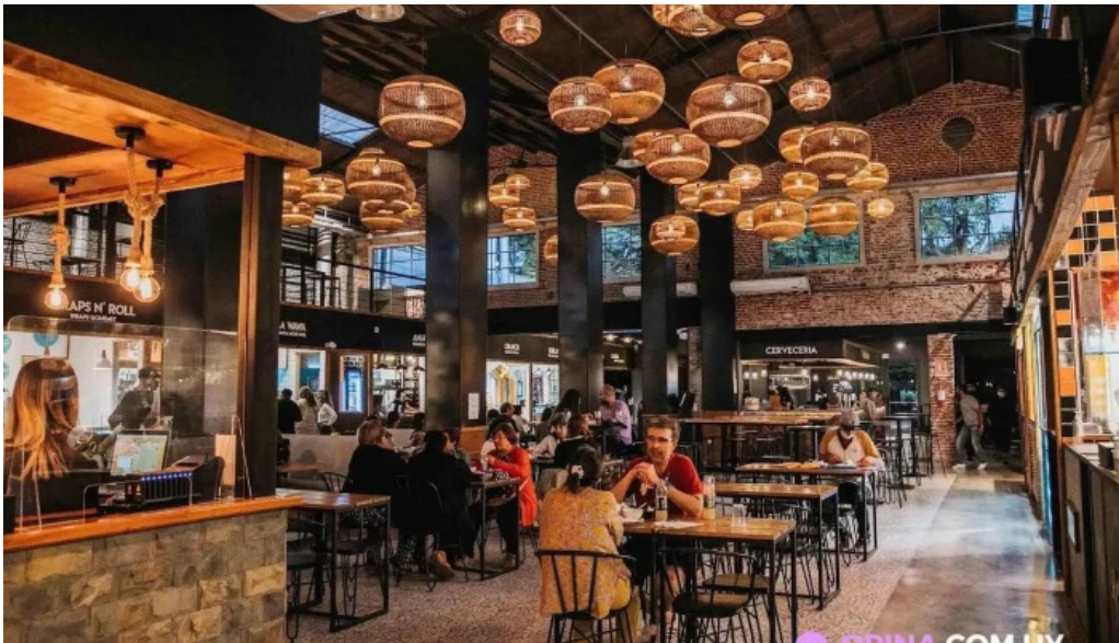
Mercado del prado montevideo