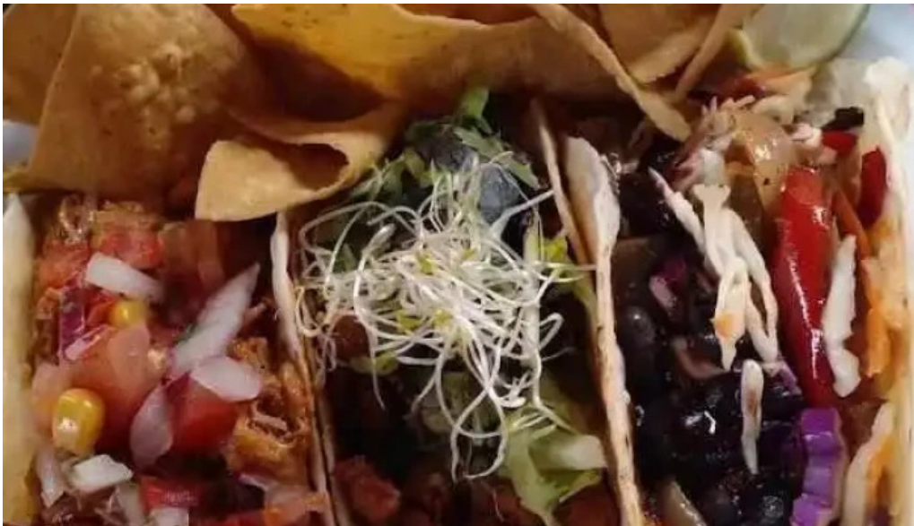
Mercado del prado mas recientes