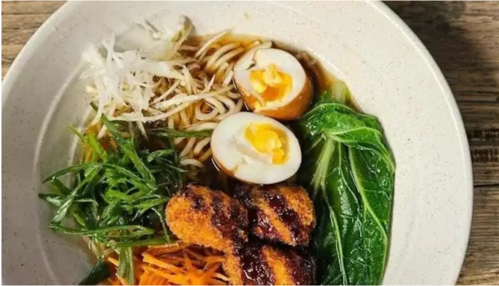
Mercado del prado ramen