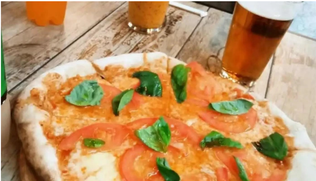
Mercado del prado pizza