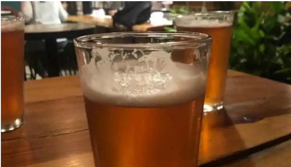
Mercado del prado cerveza