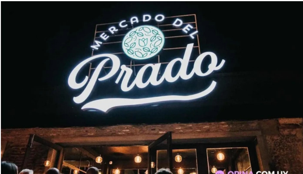
Mercado del prado del propietario