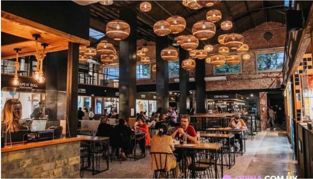
Mercado del prado todas