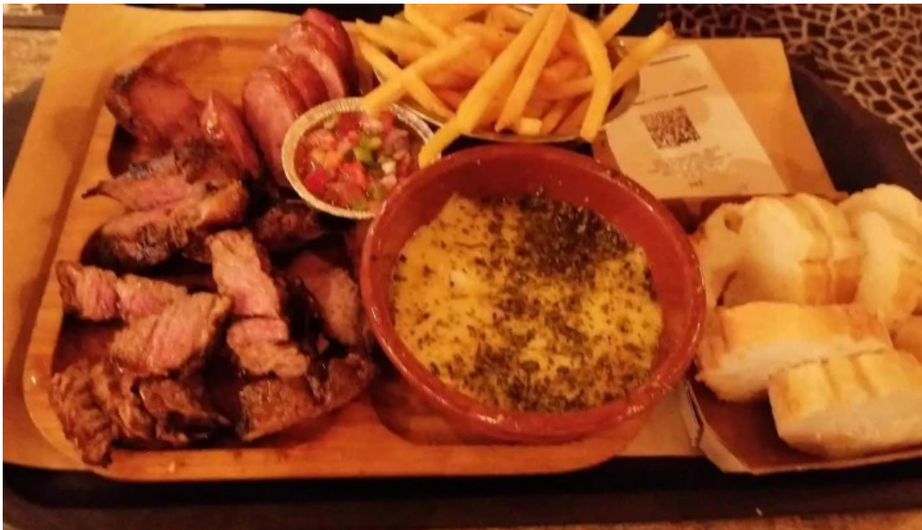
Mercado del prado picada