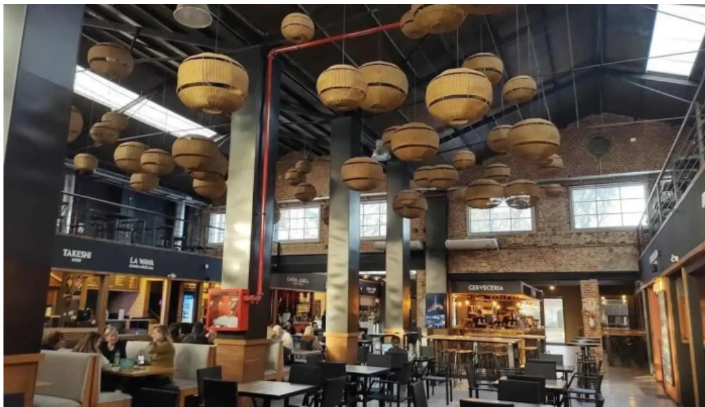
Mercado del prado ambiente