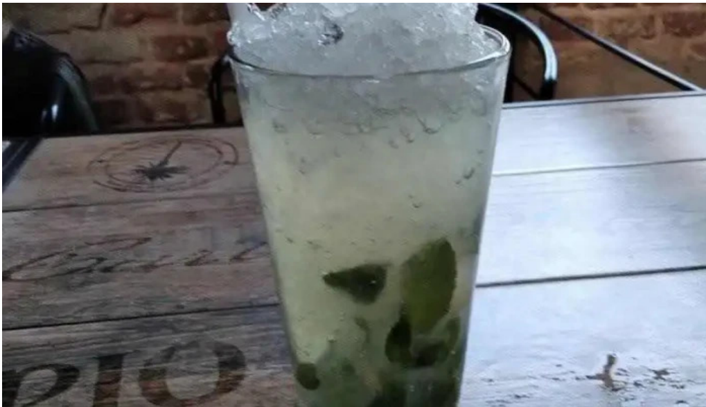
Mercado del prado mojito