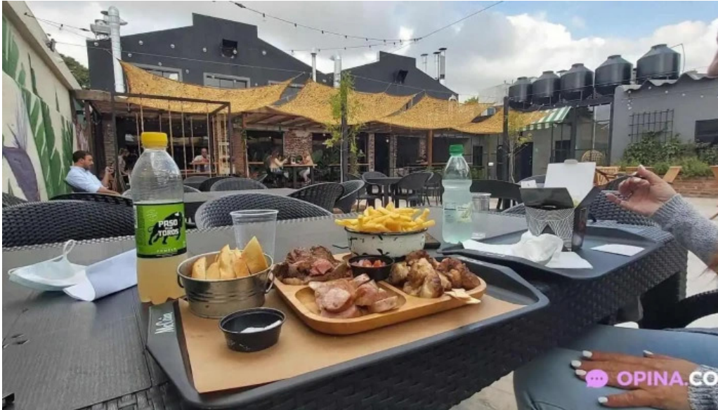
Mercado del prado comida y bebida