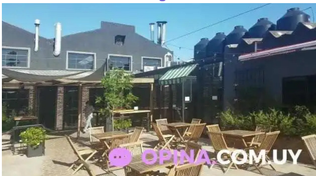
Mercado del prado videos