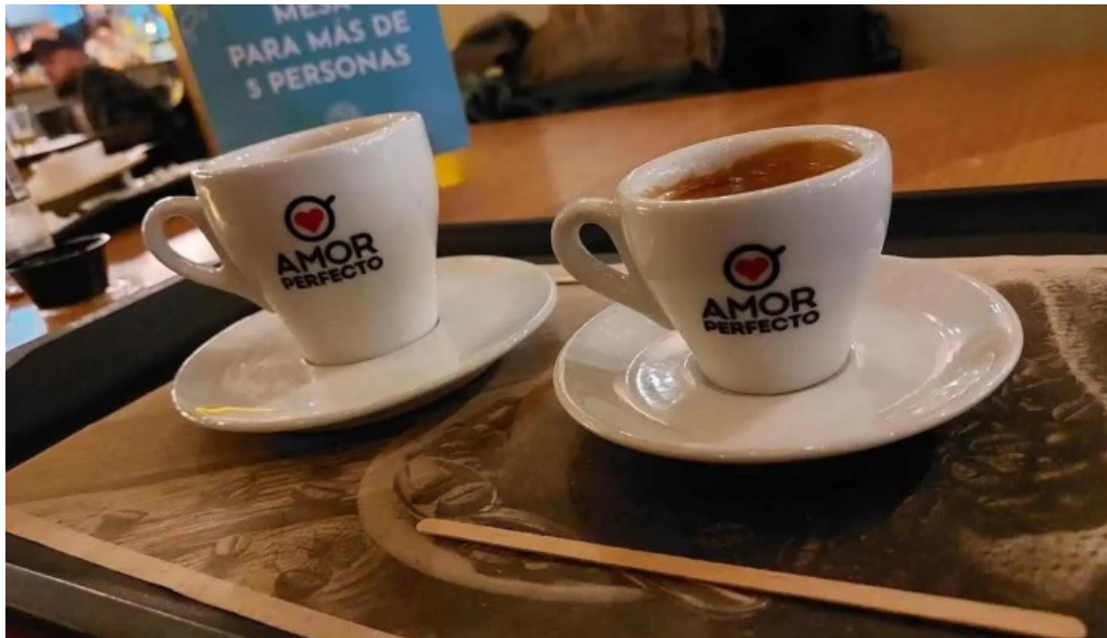
Mercado del prado capuchino