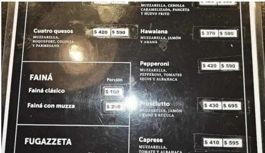
Mercado del prado menu