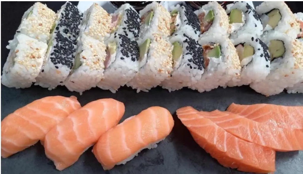
Mercado del prado sushi