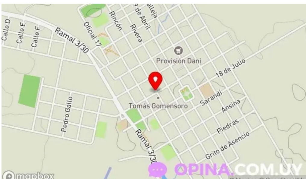
Veterinaria bortagaray mapa