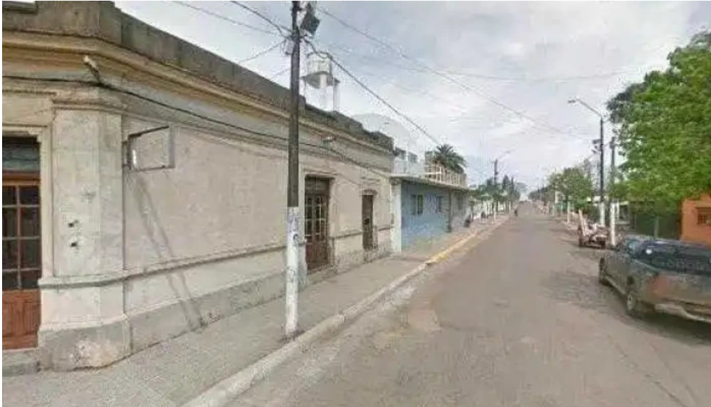
Veterinaria bortagaray instagram