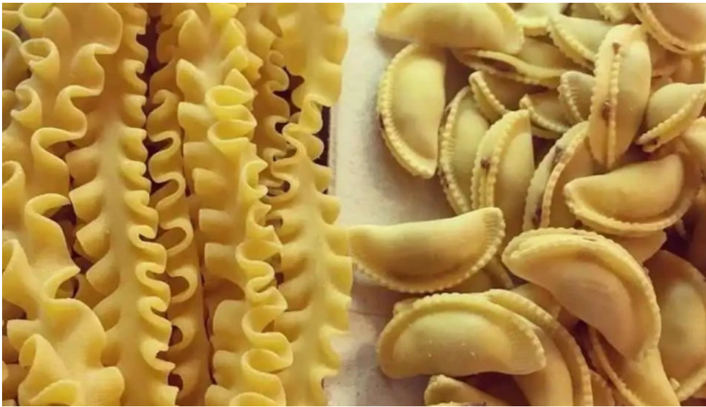
La raviolera comida y bebida