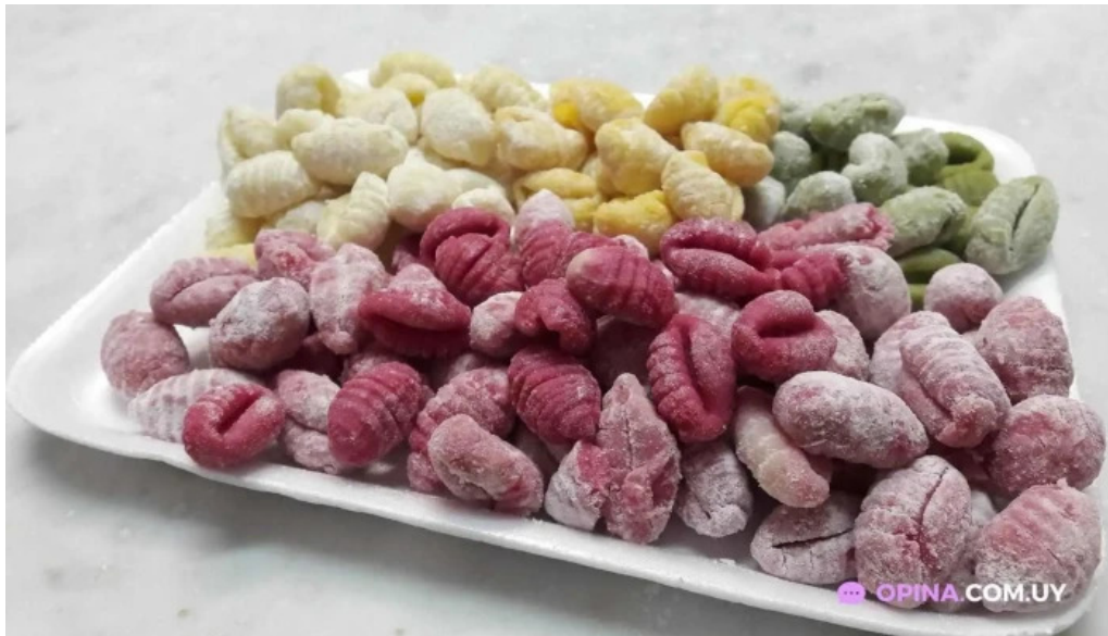
La raviolera noqui