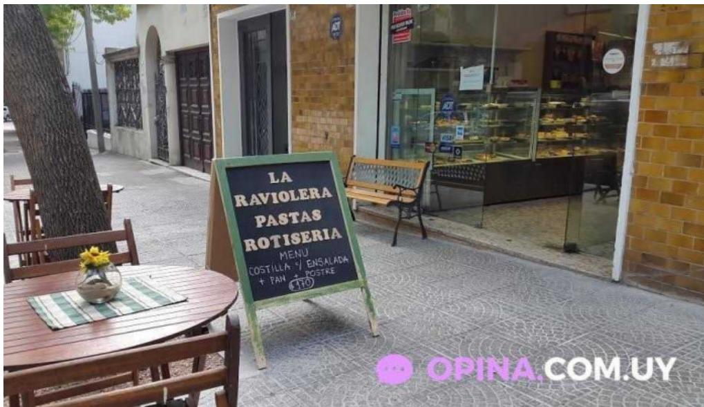
La raviolera montevideo