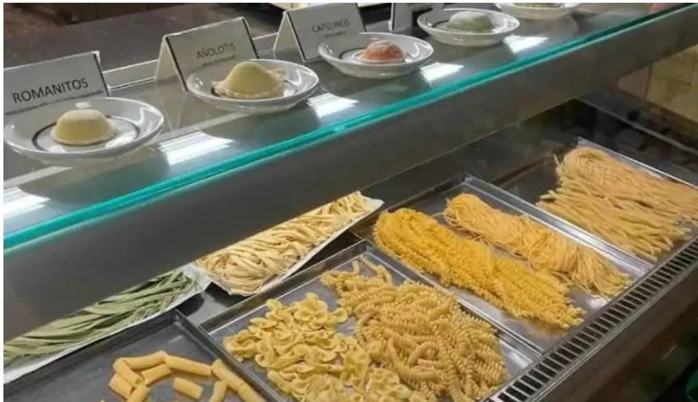
La raviolera ambiente