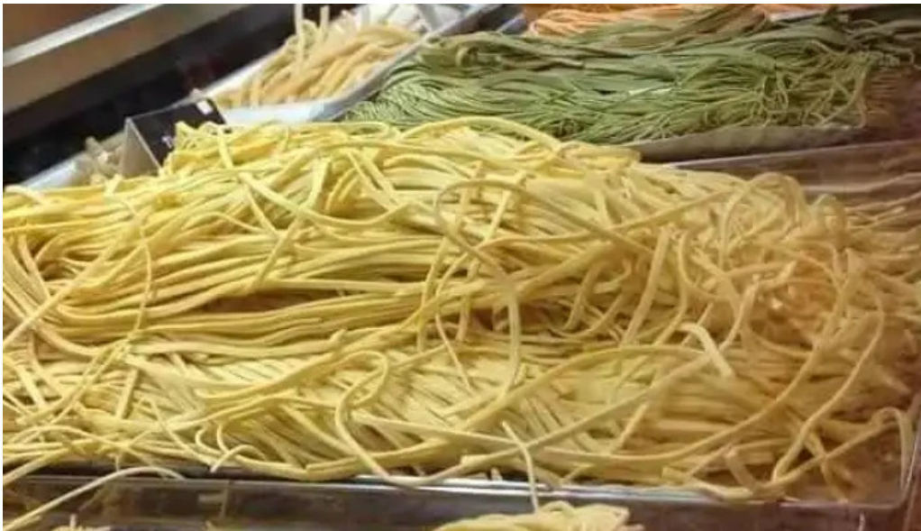
La raviolera comida reconfortante