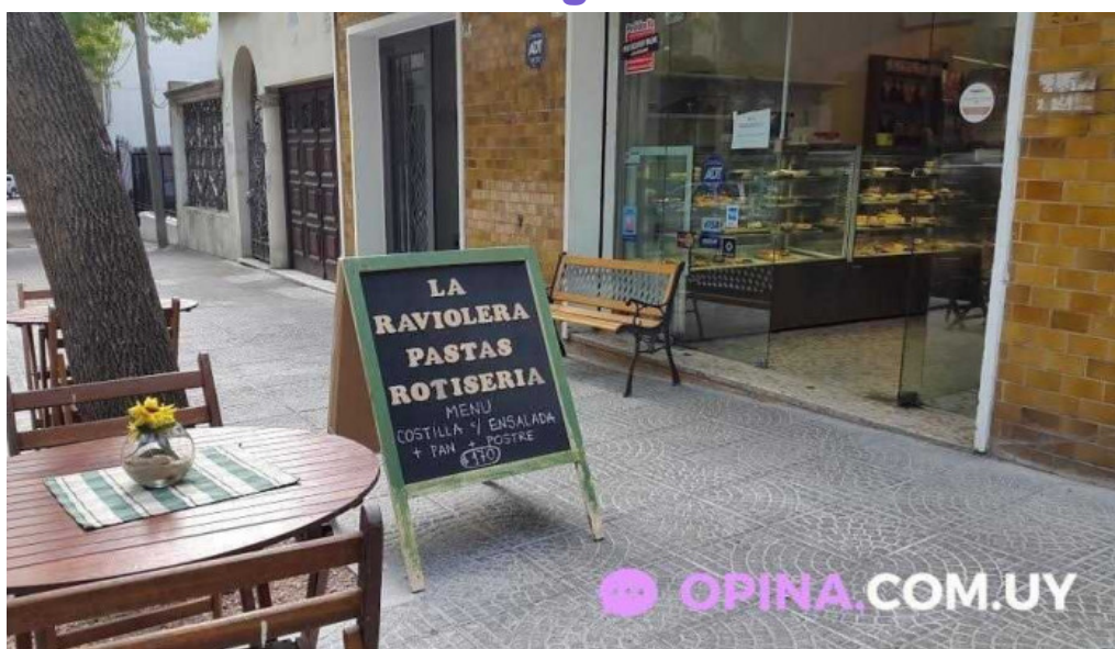
La raviolera todas