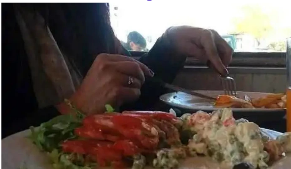
Fabrica de pastas los paraisos todas