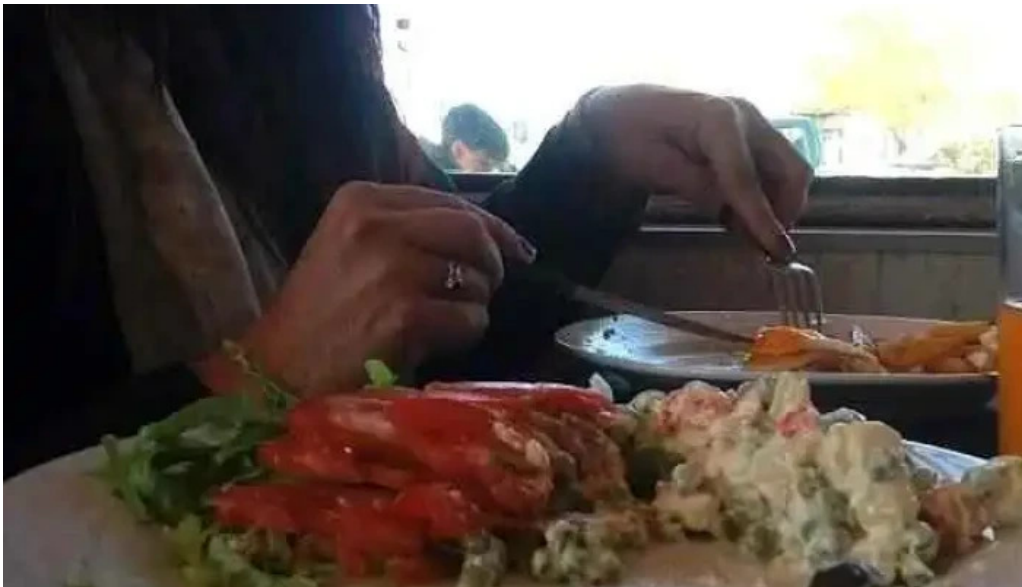
Fabrica de pastas los paraisos montevideo