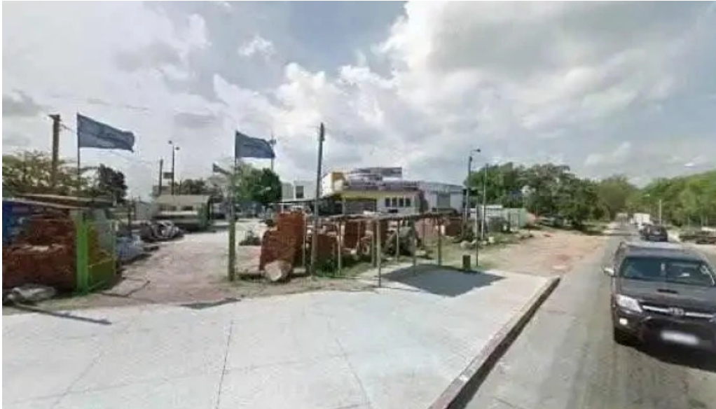
Fabrica de pastas los paraisos street view y 360