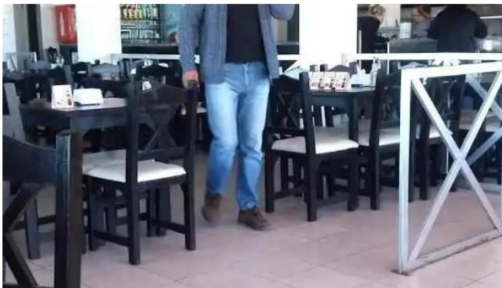
Fabrica de pastas los paraisos ambiente