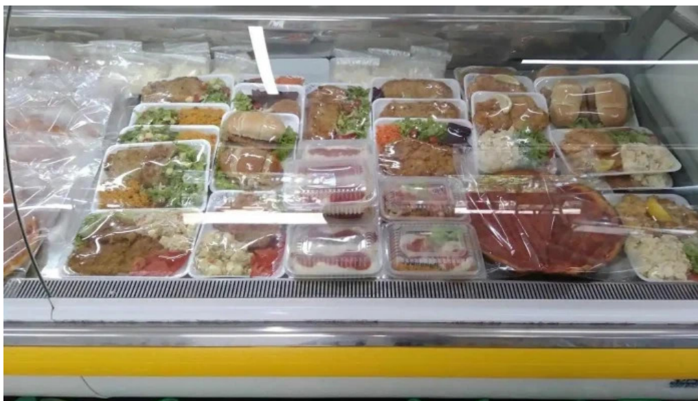
Fabrica de pastas plaza ambiente