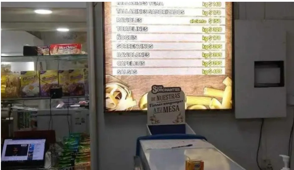
Fabrica de pastas plaza menu