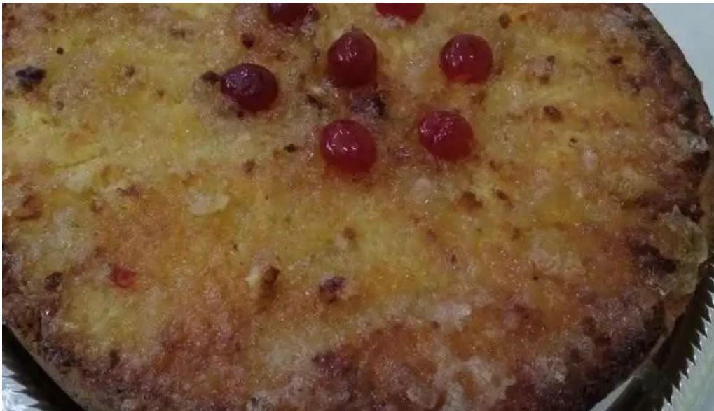
Fabrica de pastas plaza comida y bebida