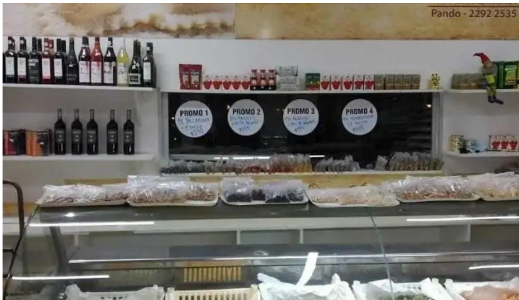
Fabrica de pastas plaza comida reconfortante