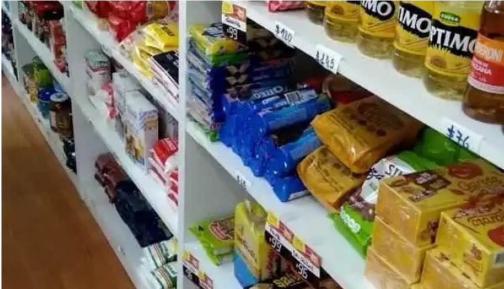
Fabrica de pastas plaza videos