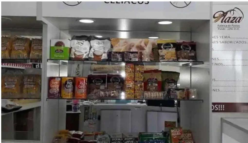
Fabrica de pastas plaza del propietario