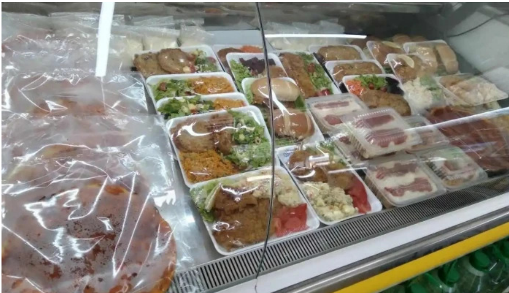
Fabrica de pastas plaza todas