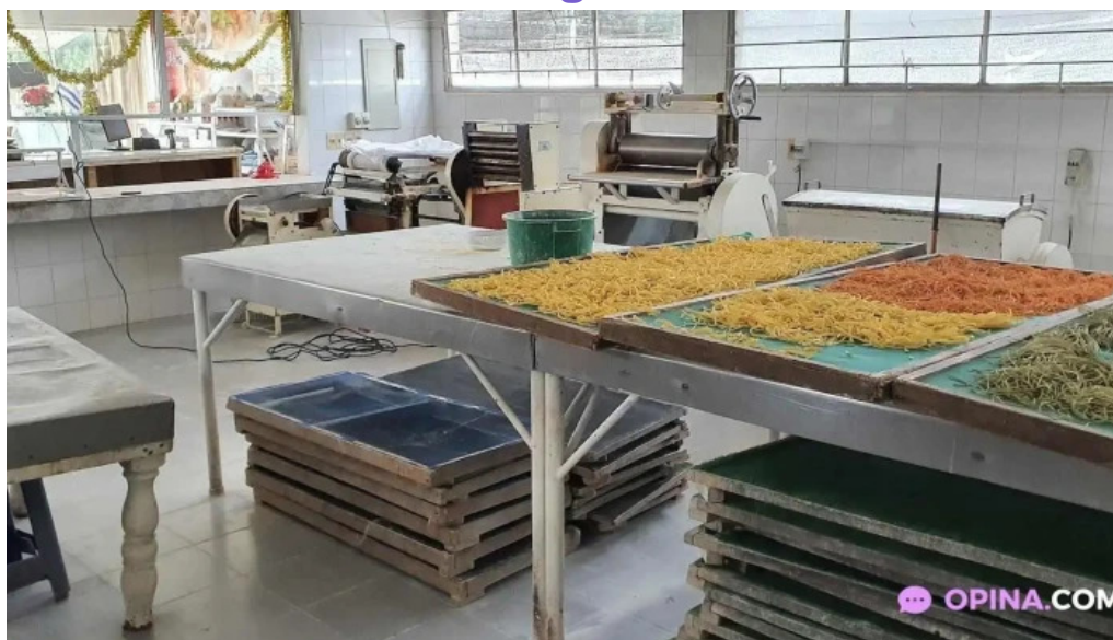
Fabrica de pastas la pasta todas