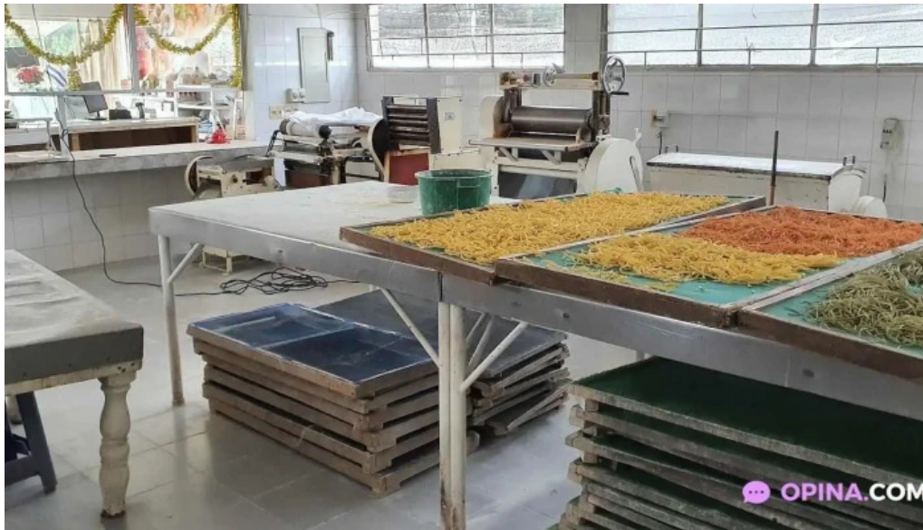
Fabrica de pastas la pasta ambiente