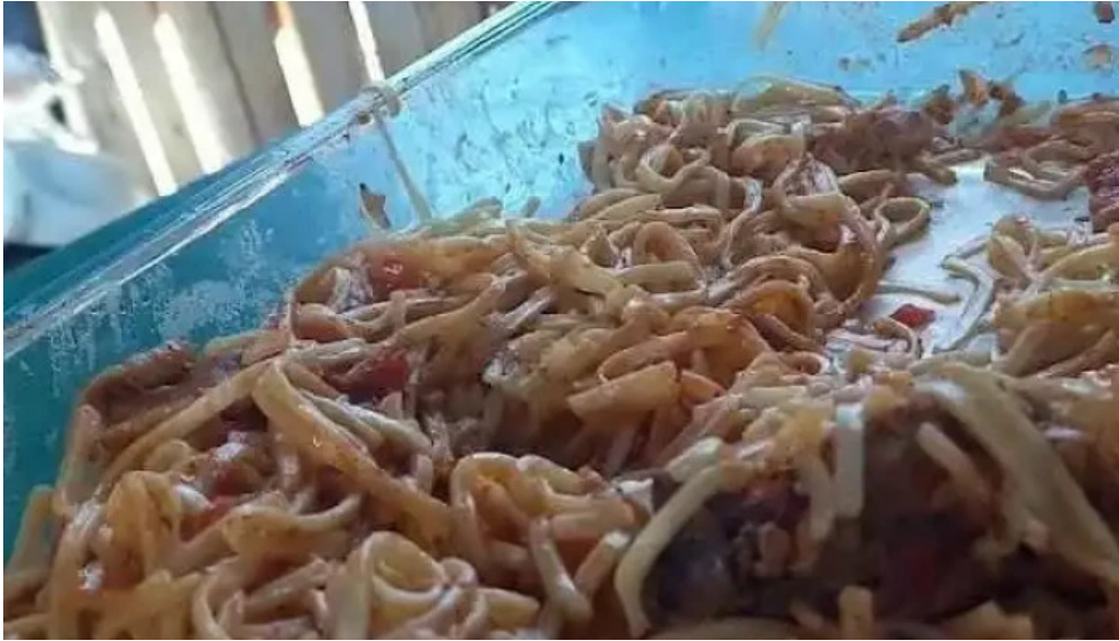
Fabrica de pastas la pasta comida reconfortante