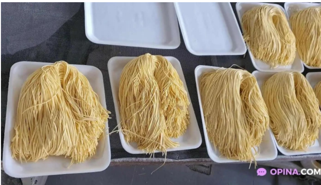
Fabrica de pastas la pasta comida y bebida