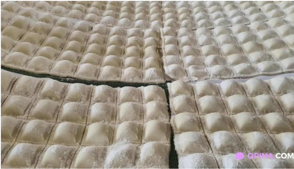
Fabrica de pastas la pasta del propietario