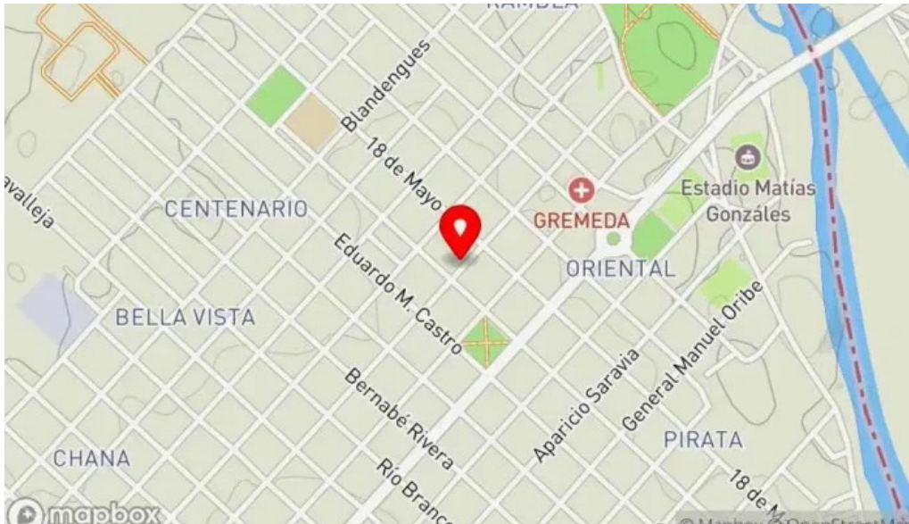
Fabrica de pastas la pasiva mapa