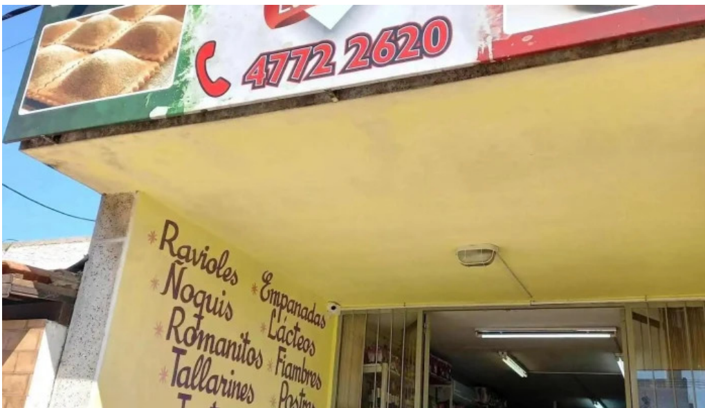
Fabrica de pastas la pasiva menu