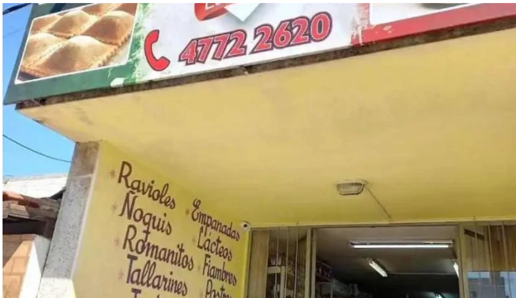
Fabrica de pastas la pasiva artigas