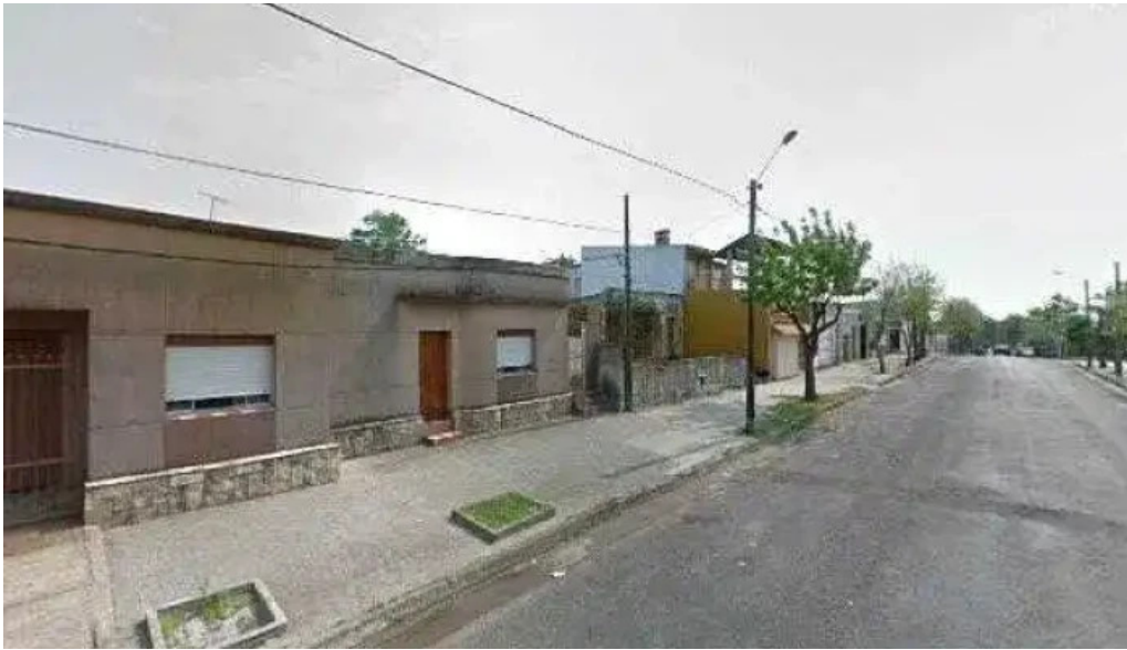
Fabrica de pastas la pasiva street view y 360