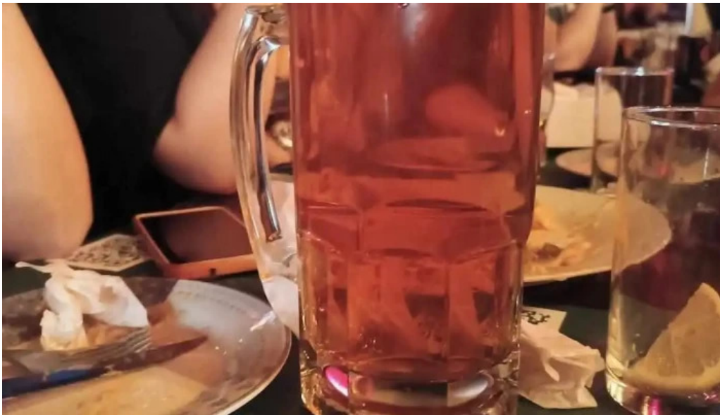
El viejo oeste cerveza