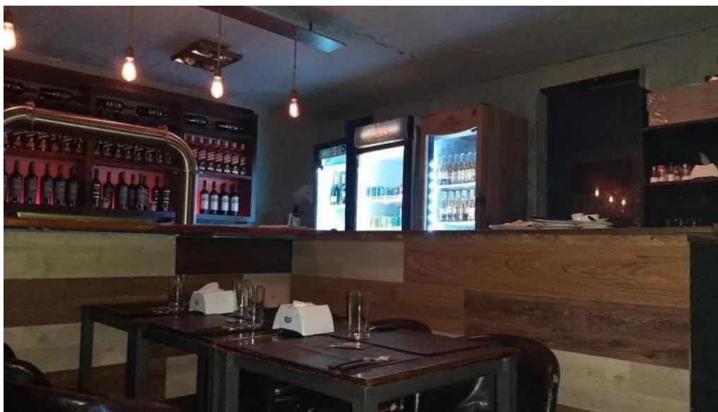
El viejo oeste ambiente