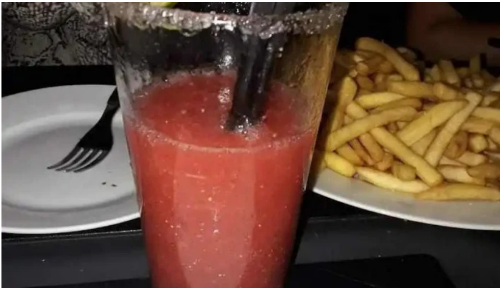
El viejo oeste jugo