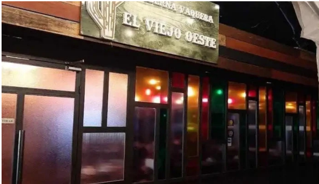
El viejo oeste montevideo