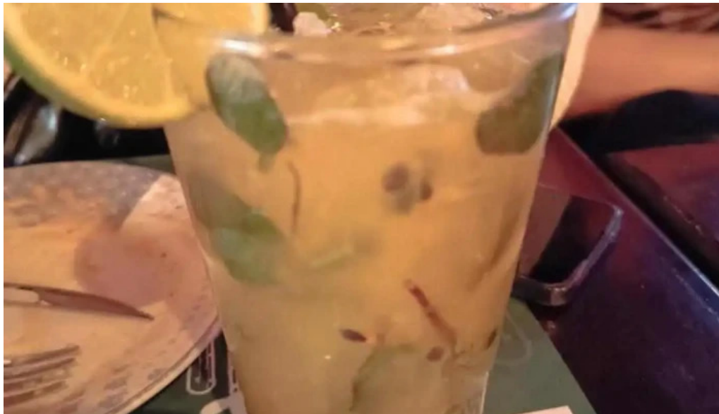
El viejo oeste mojito