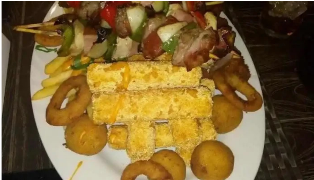
El viejo oeste picada