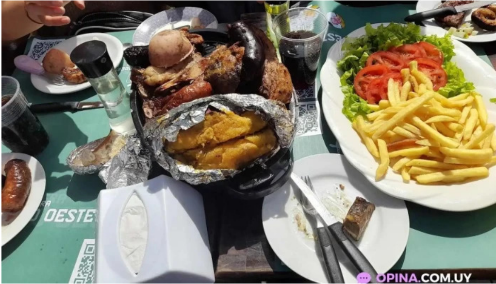
El viejo oeste comida y bebida