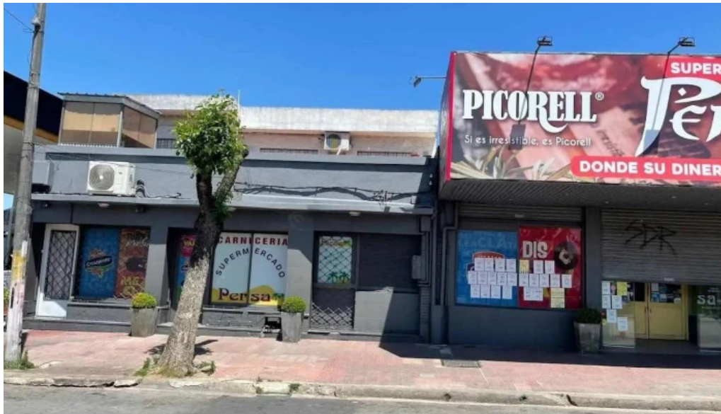
Supermercado el persa las piedras