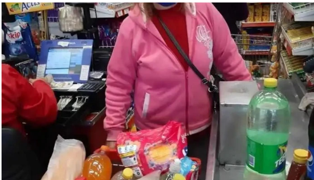
Supermercado el persa del propietario