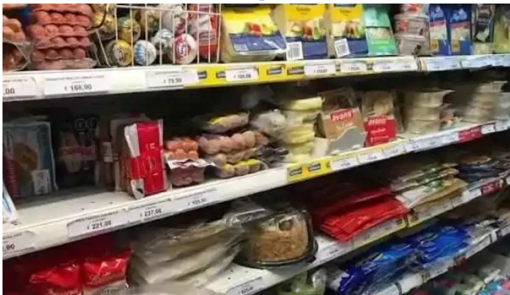
Supermercado el persa videos