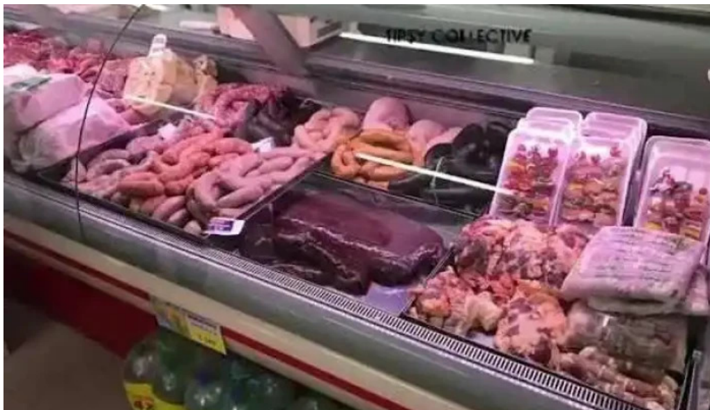
Supermercado el persa interior