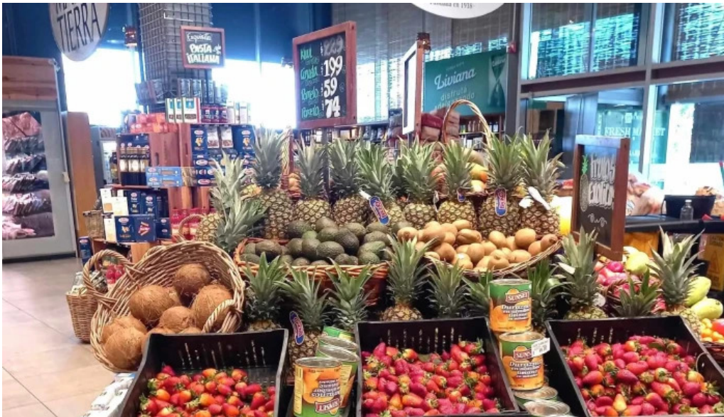
Disco fresh market comentario 8