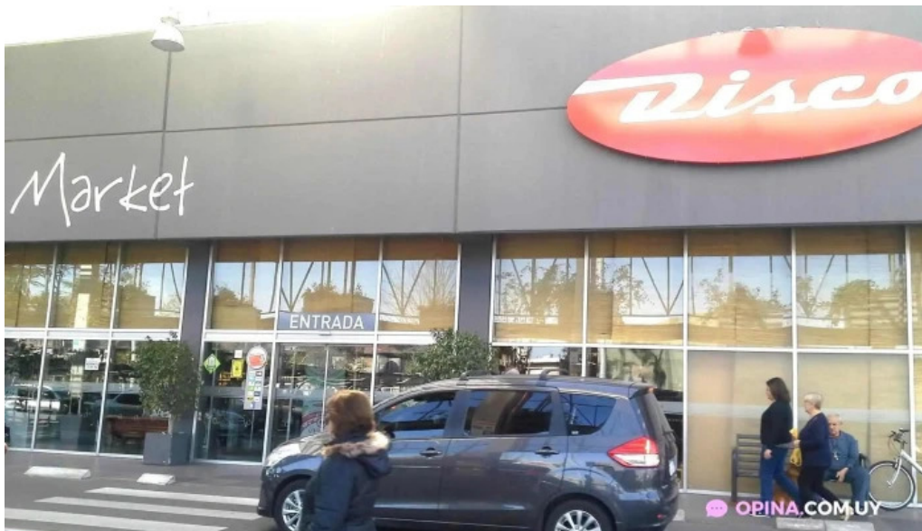
Disco fresh market estacionamiento