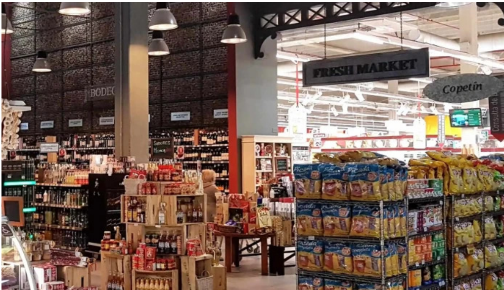
Disco fresh market comentario 4