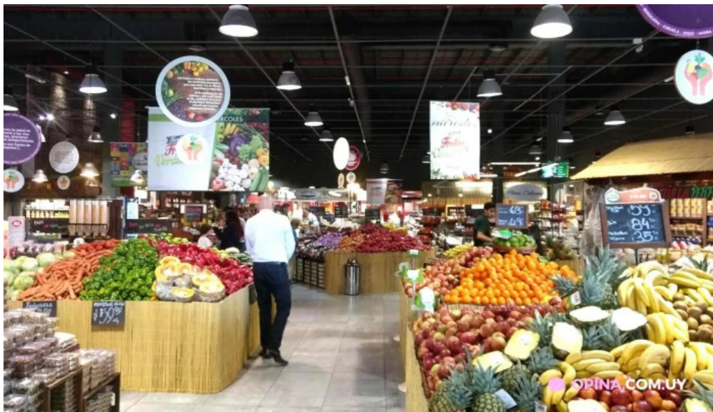
Disco fresh market interior