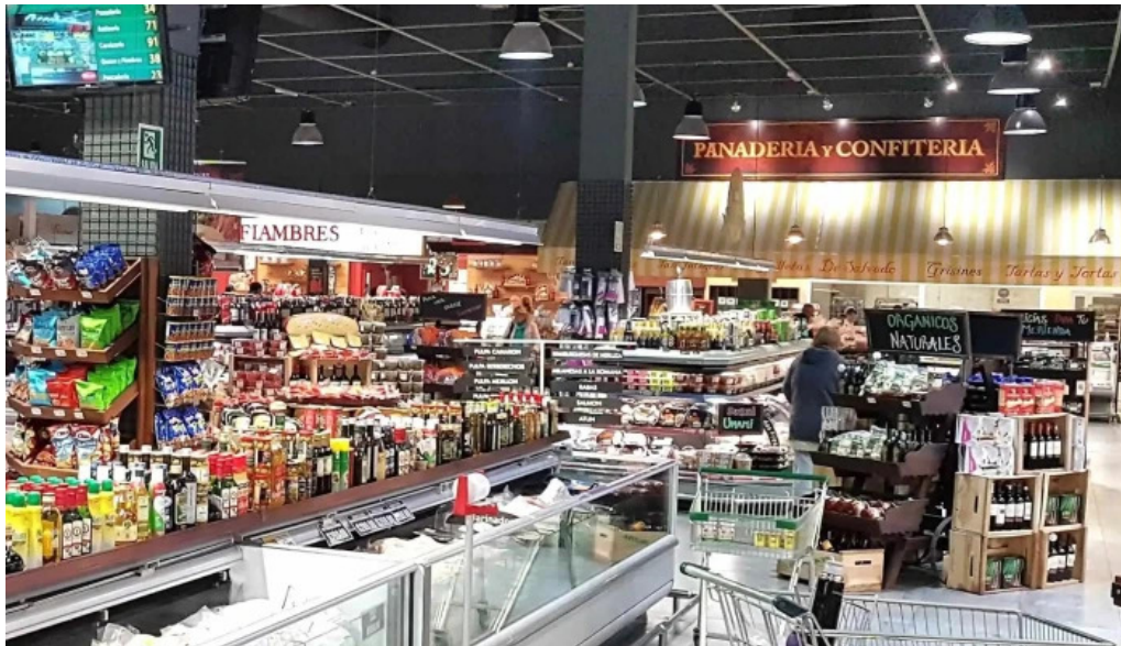
Disco fresh market comentario 2