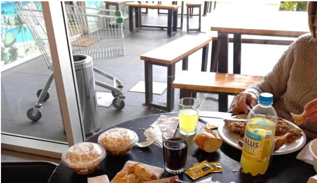
Disco fresh market comentario 7