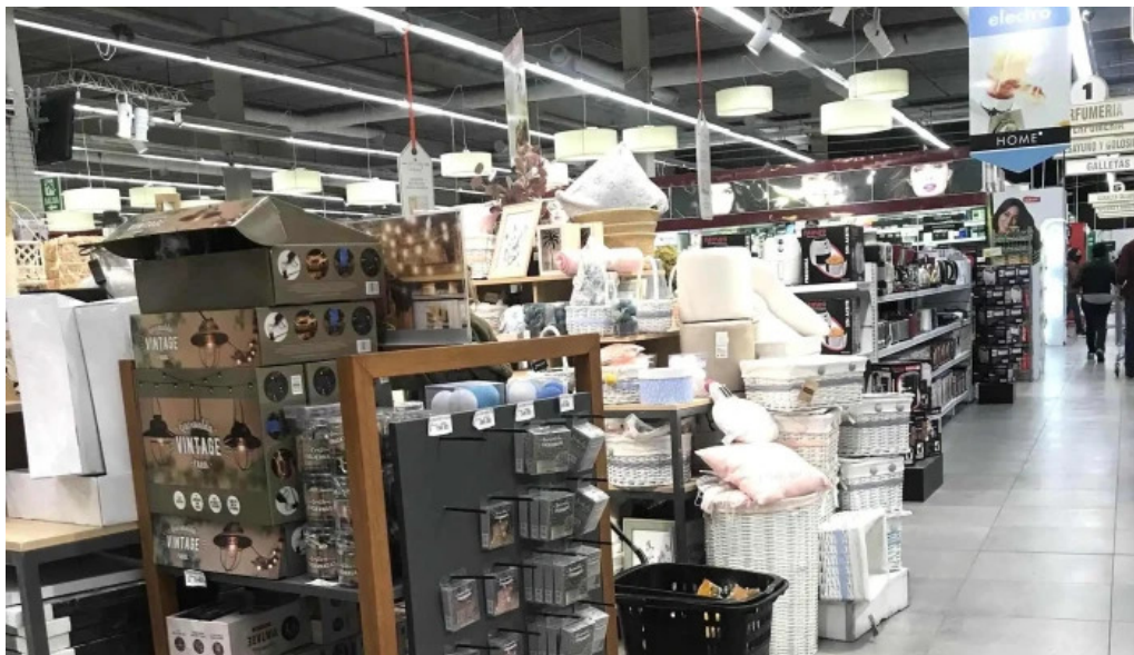
Disco fresh market comentario 9