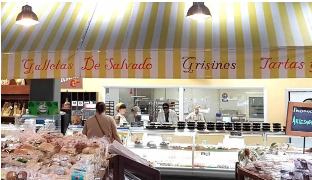
Disco fresh market comentario 3