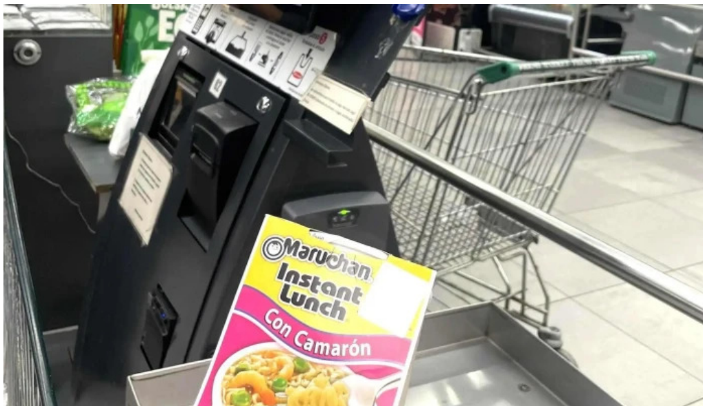
Disco fresh market comentario 1