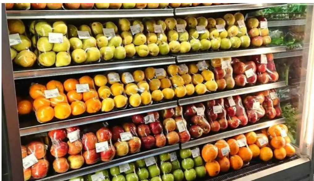
Disco fresh market alimento