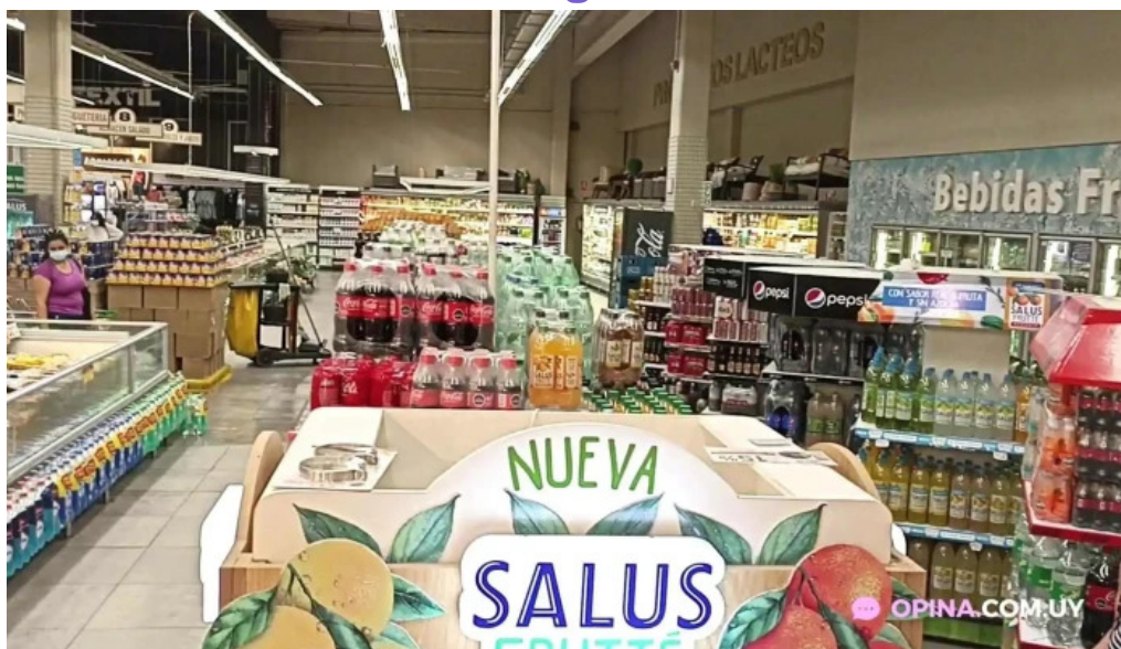
Disco fresh market videos