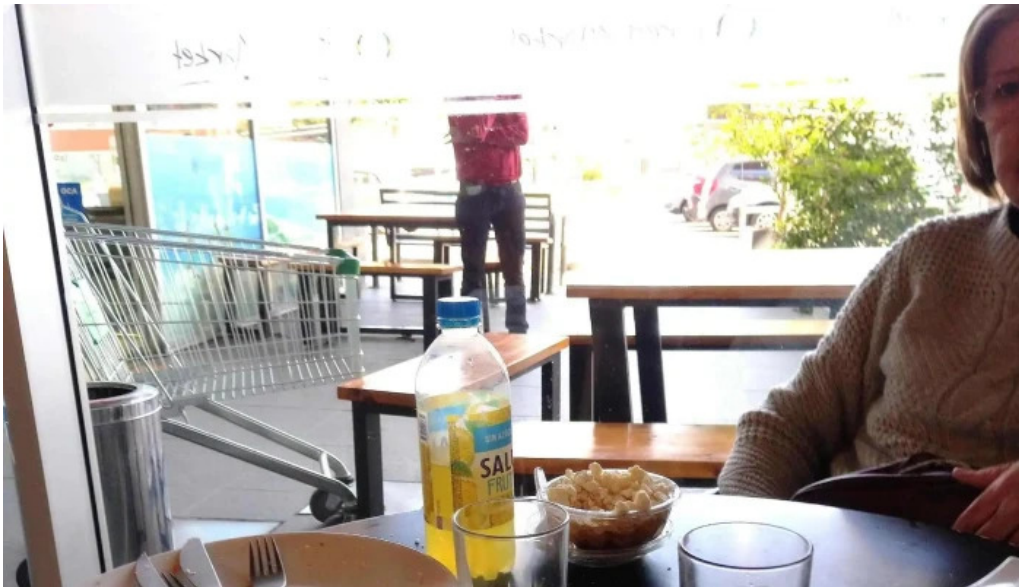
Disco fresh market comentario 6