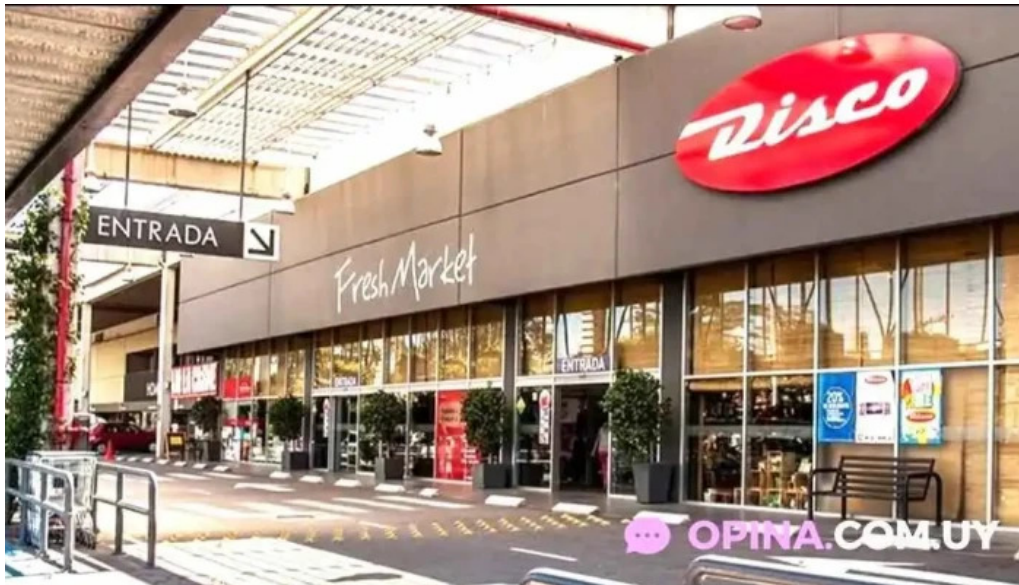
Disco fresh market todo