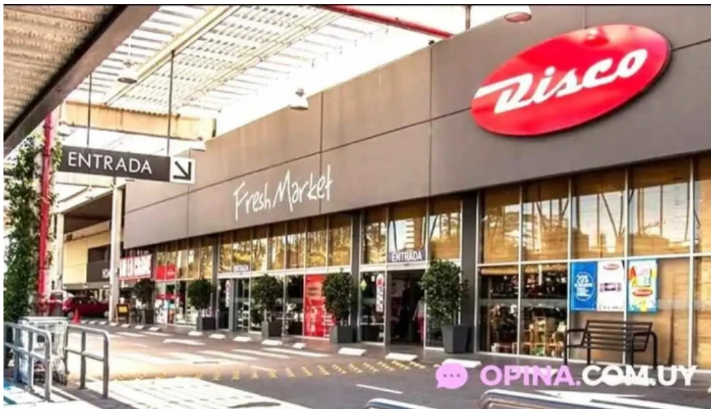
Disco fresh market montevideo