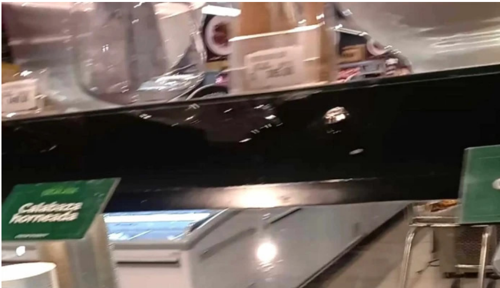
Disco fresh market comentario 5