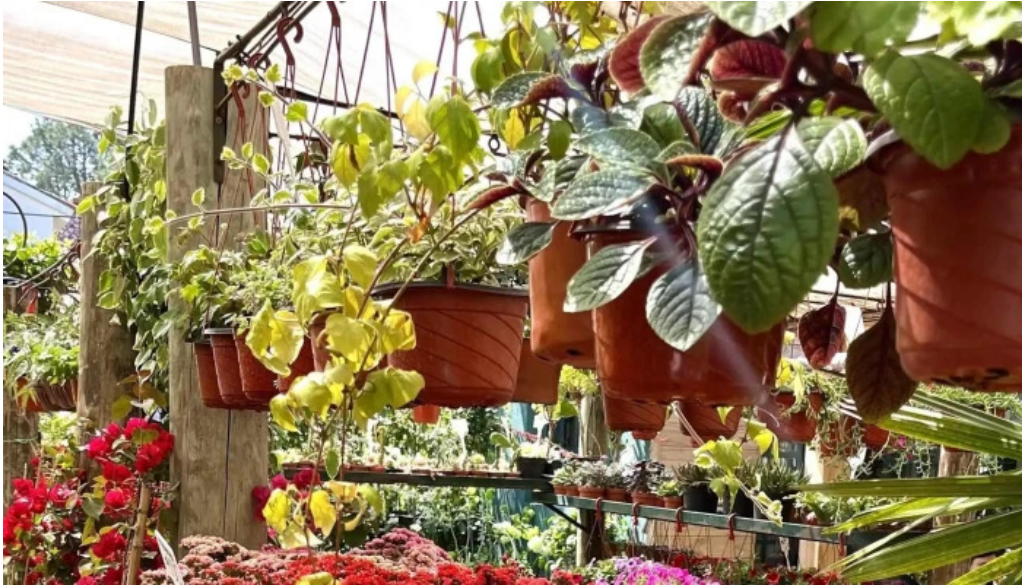
Lavender tea room comentario 3