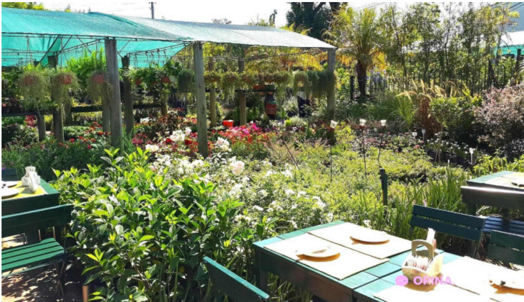
Lavender tea room montevideo