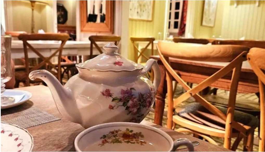
Lavender tea room comidas y bebidas