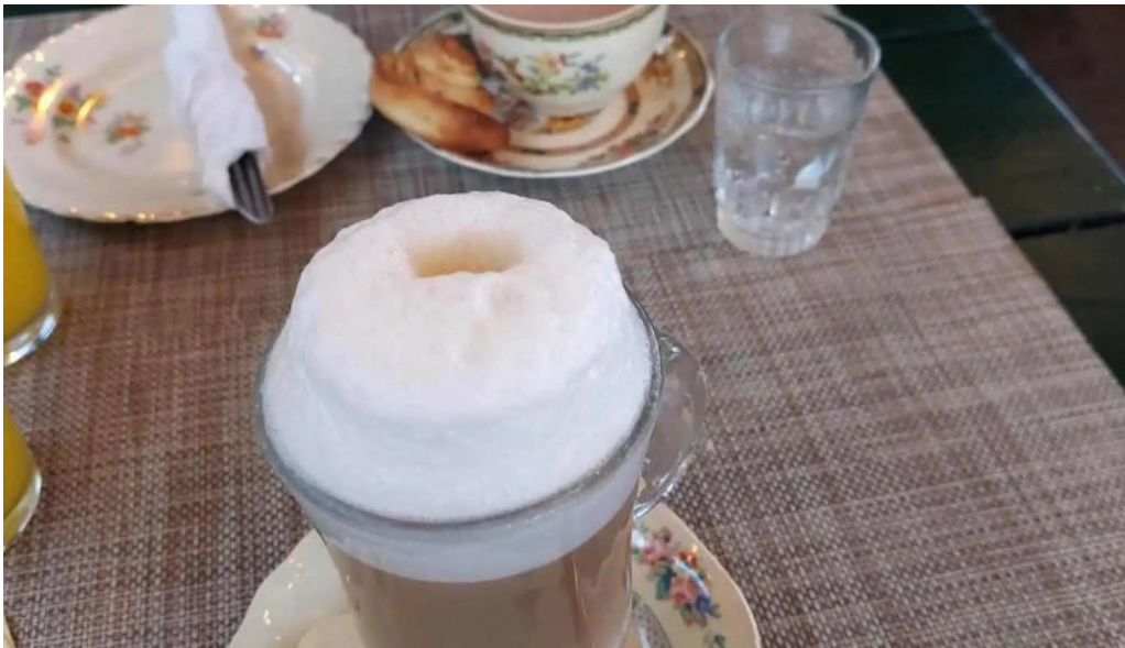
Lavender tea room capuchino