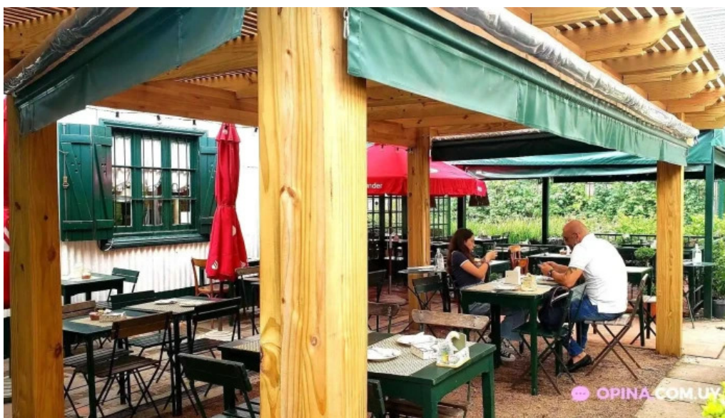
Lavender tea room ambiente