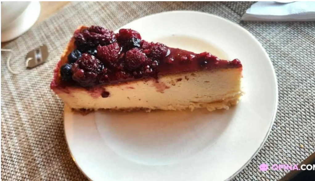
Lavender tea room pastel de queso