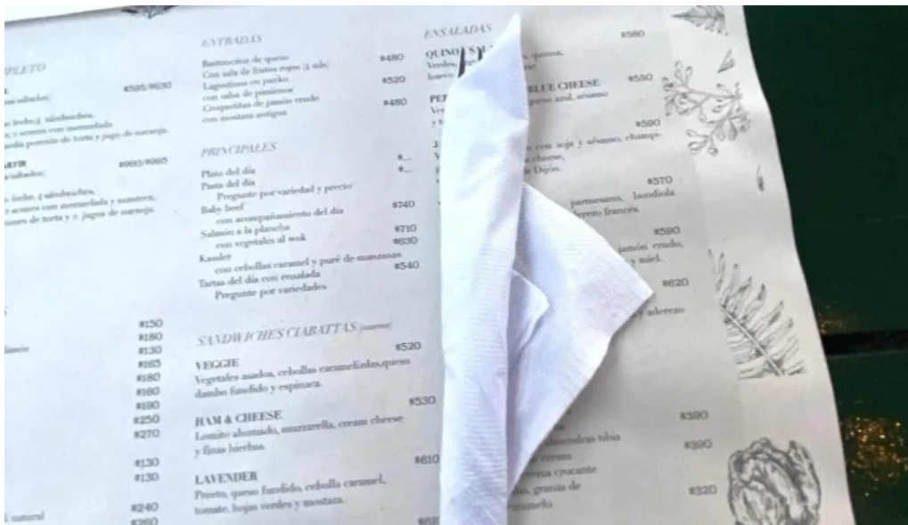
Lavender tea room menu