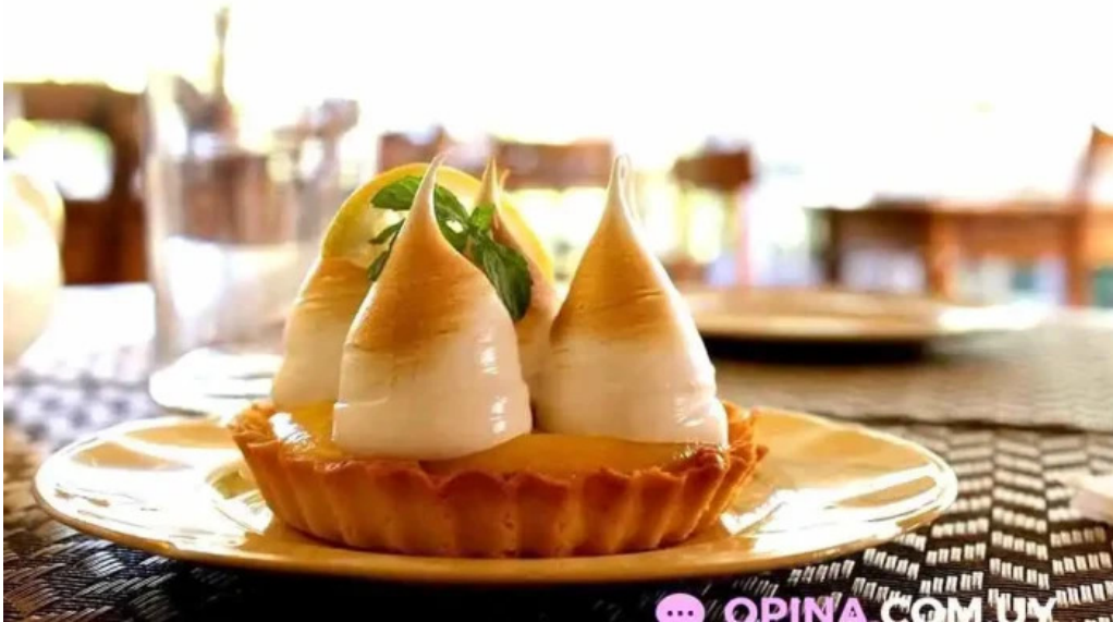
Lavender tea room tarta de limon con merengue