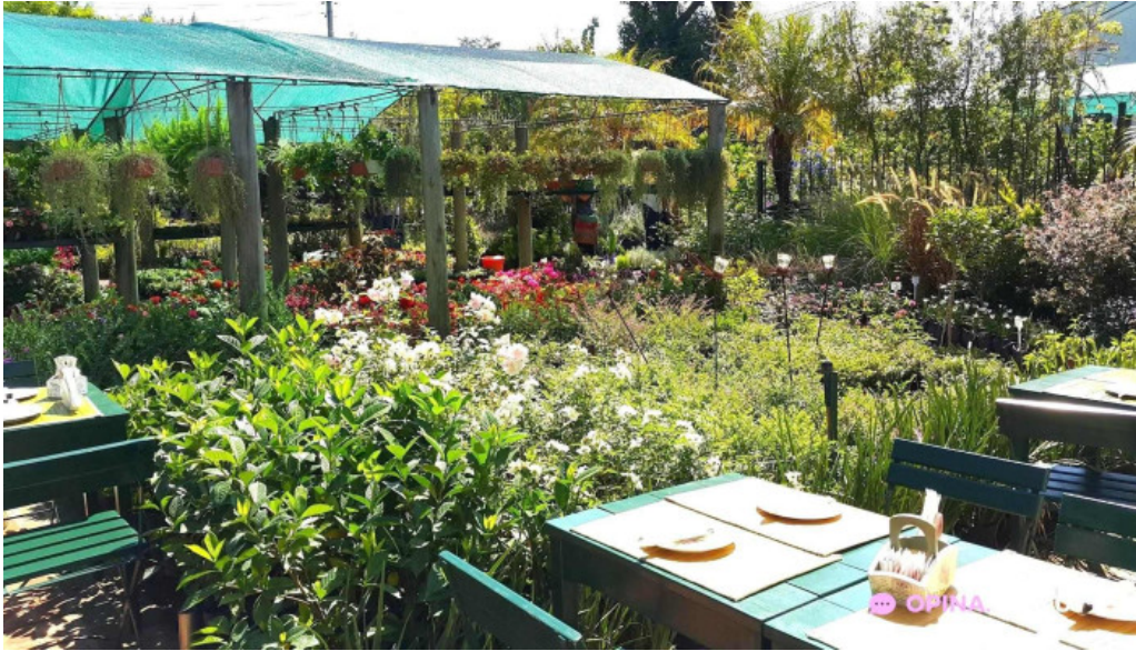
Lavender tea room todo