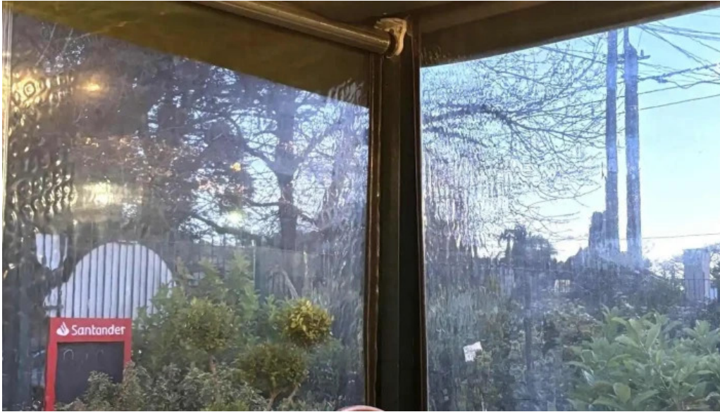
Lavender tea room recientes