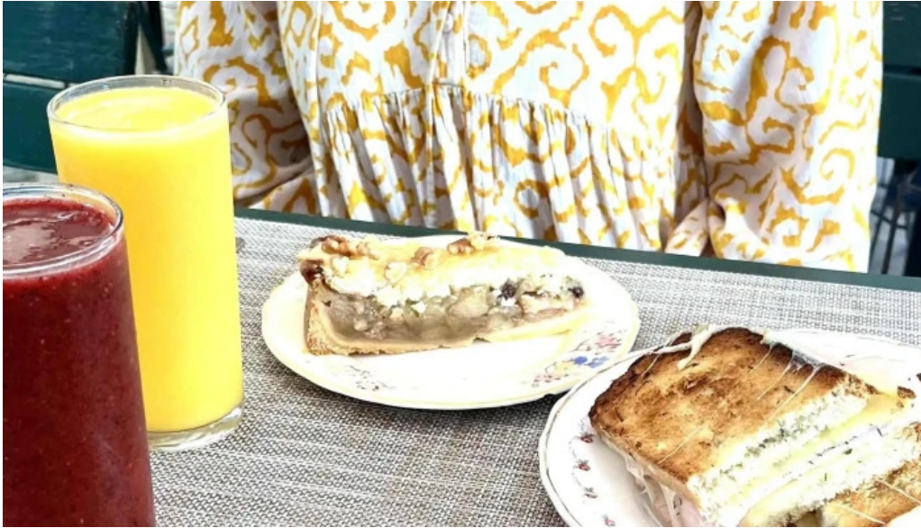
Lavender tea room comentario 1