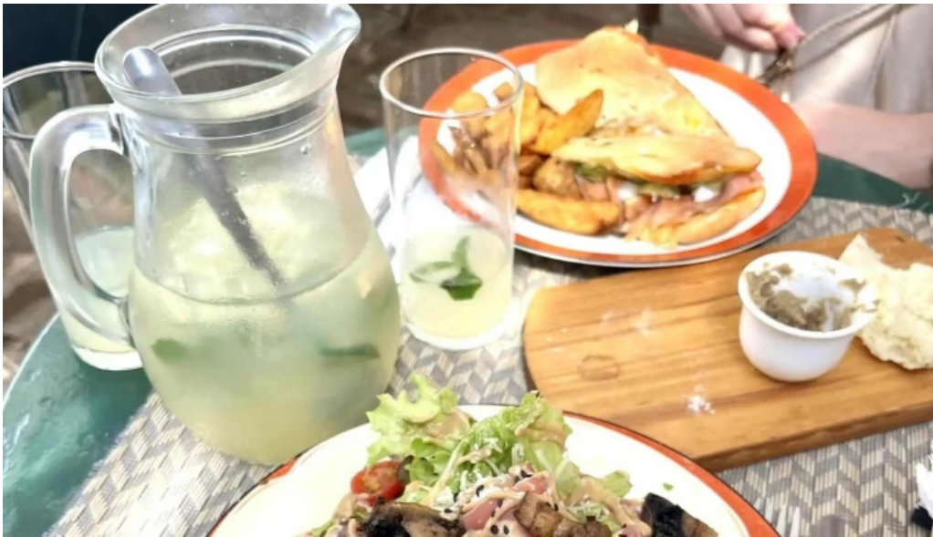
Lavender tea room comentario 2