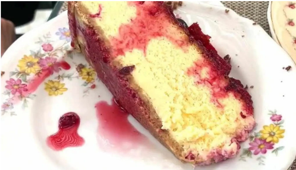
Lavender tea room videos