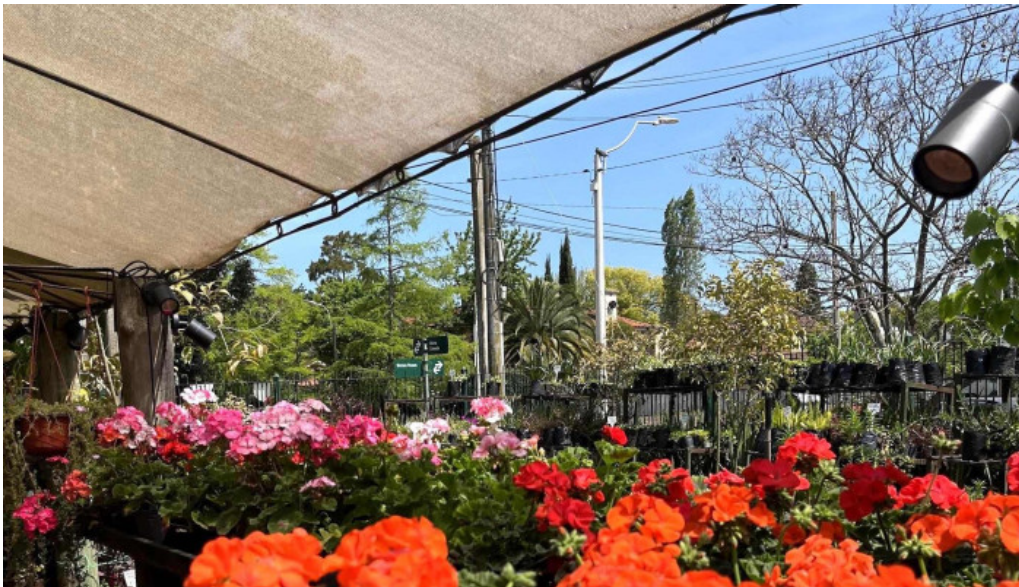
Lavender tea room comentario 4