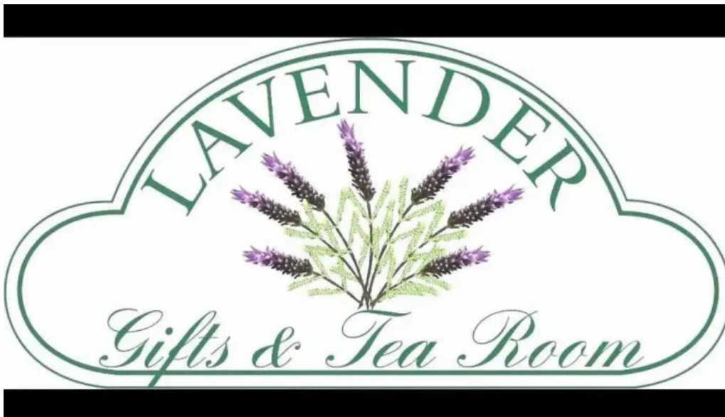
Lavender tea room del propietario