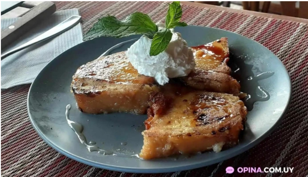
Volver comida y bebida