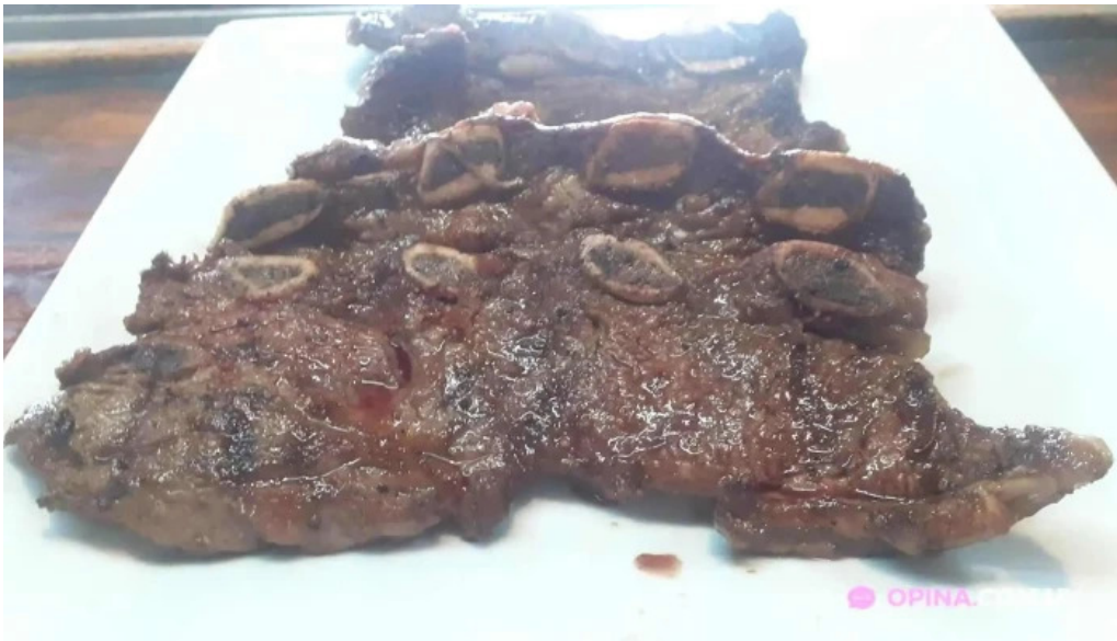
Volver del propietario