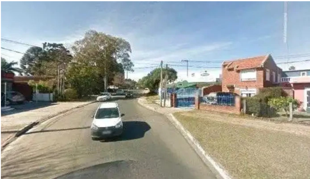
Volver street view y 360