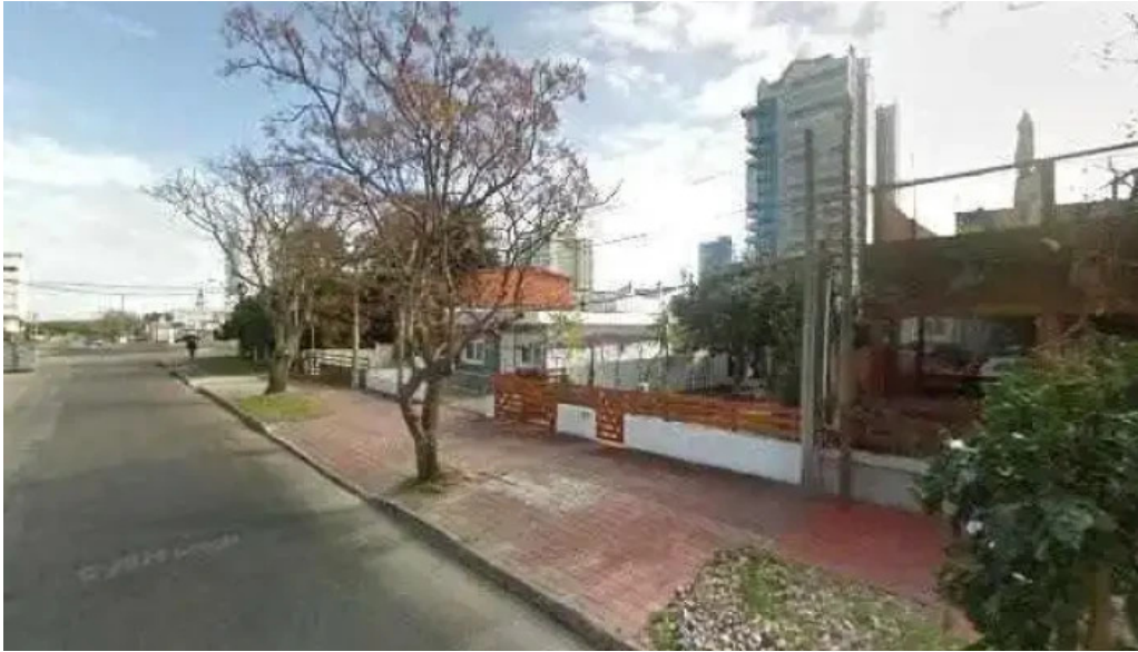
Visceral cocina street view y 360