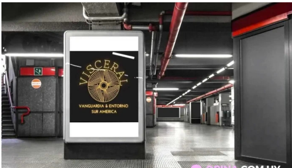
Visceral cocina del propietario