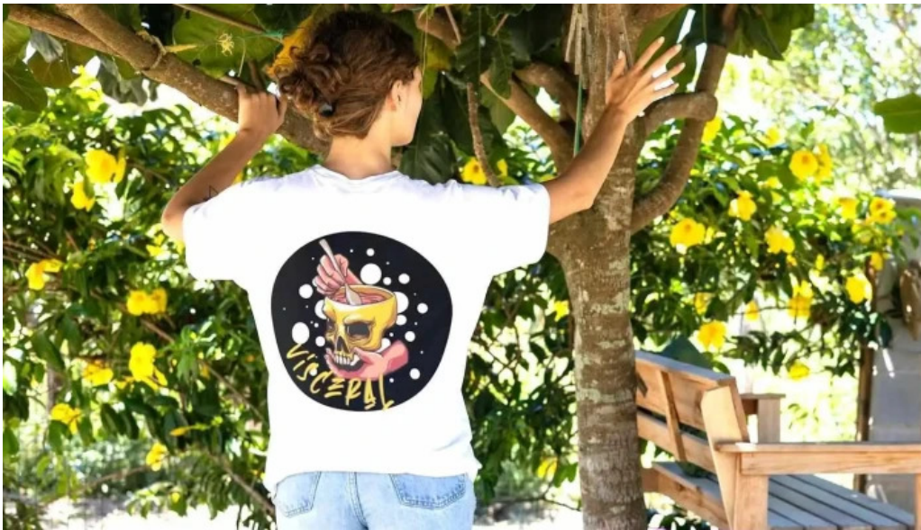
Visceral cocina punta del esteo