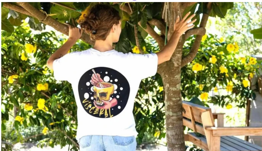
Visceral cocina todas