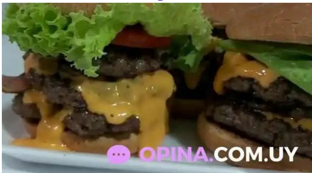
Vieja chola pizzeria videos