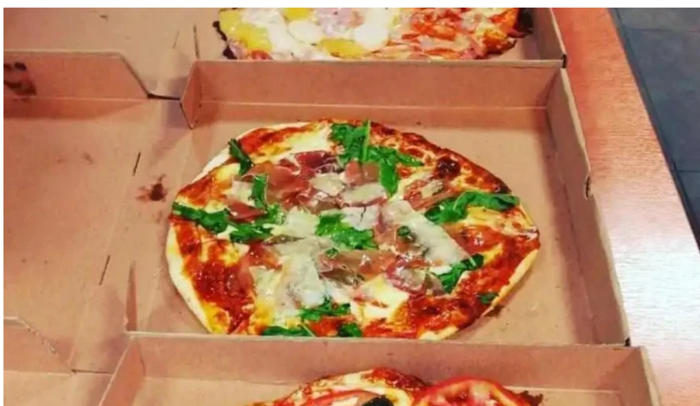
Vieja chola pizzeria comida y bebida