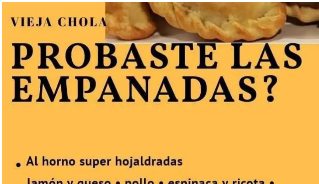
Vieja chola pizzeria menu