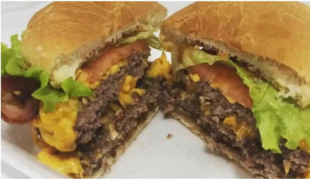
Vieja chola pizzeria todas