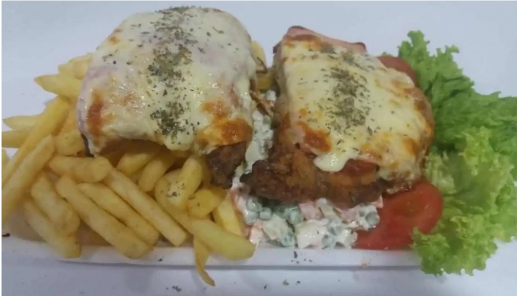
Vieja chola pizzeria papas fritas