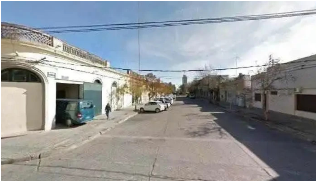
Vidal street view y 360