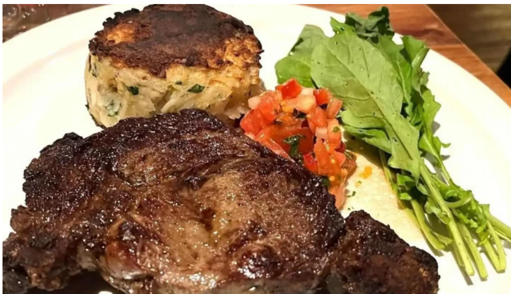
Vidal comida y bebida