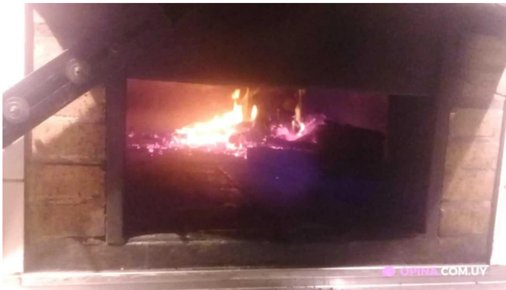
Vidal del propietario