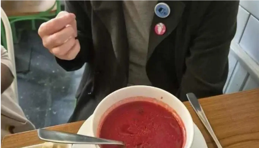
Vicenta mas recientes