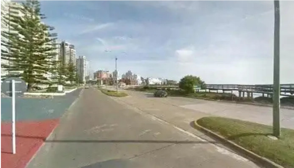
Vb parrilla bistro street view y 360