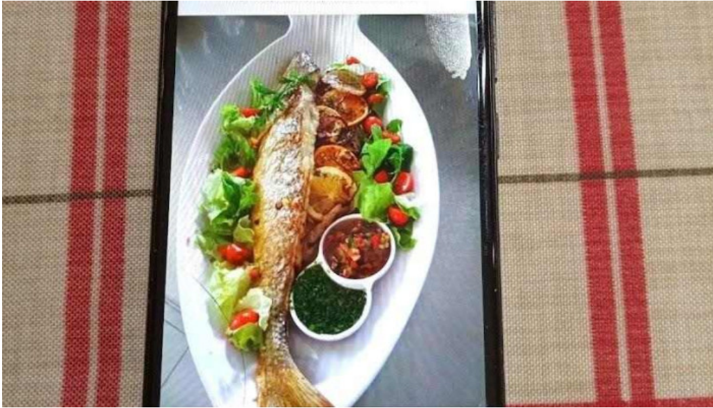
Vb parrilla bistro del propietario