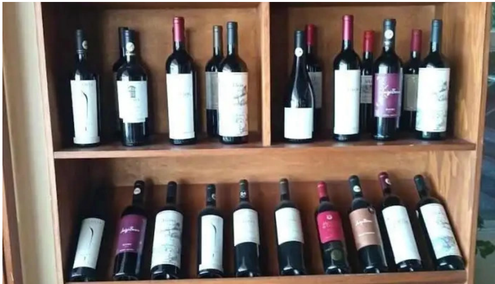
Vb parrilla bistro ambiente