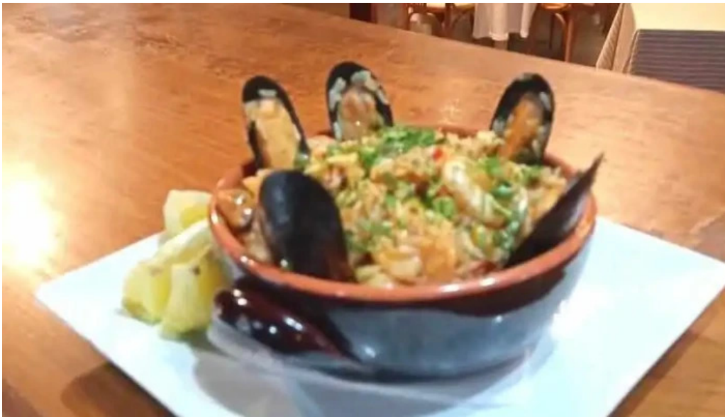
Vb parrilla bistro comida y bebida