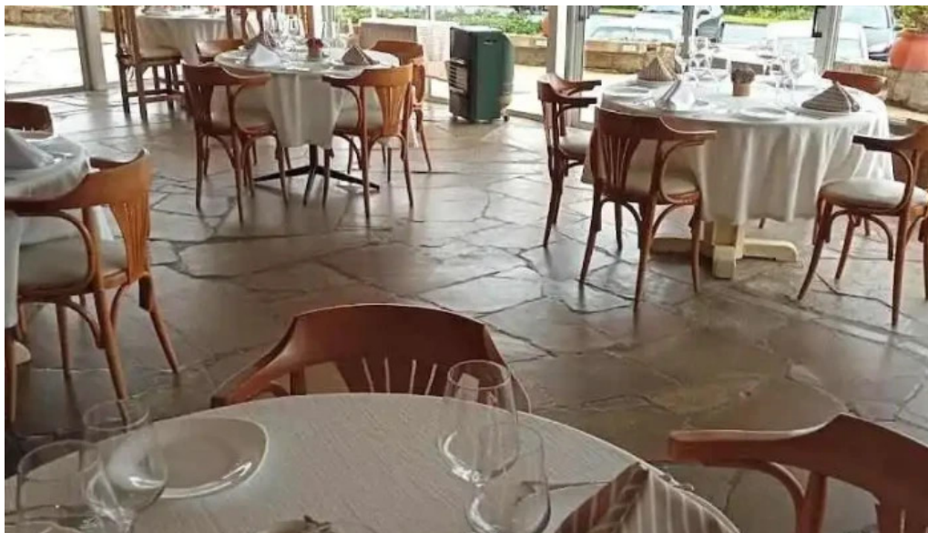
V b parrilla bistro punta del este