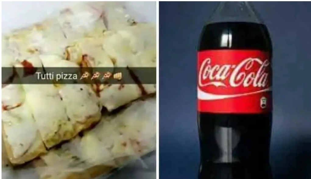
Tutti pizza comida y bebida