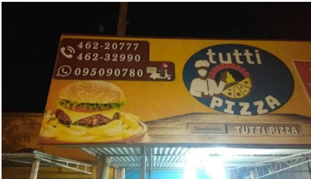
Tutti pizza todas