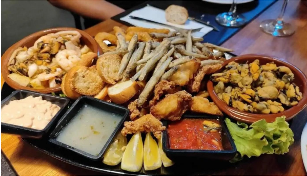
Tres36 comida y bebida