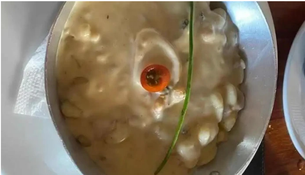
Tres36 mas recientes