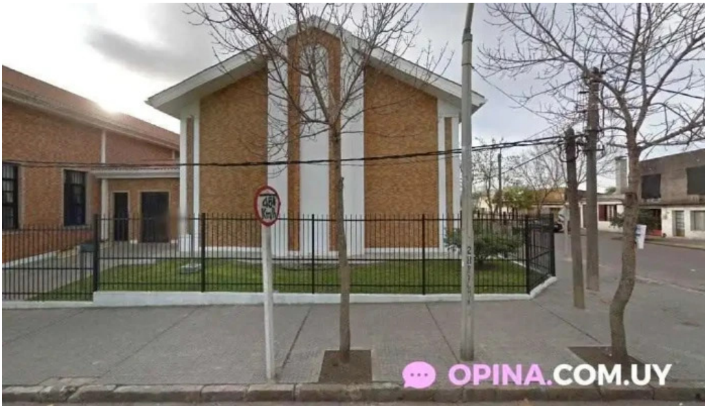
Parada spikerman treinta y tres