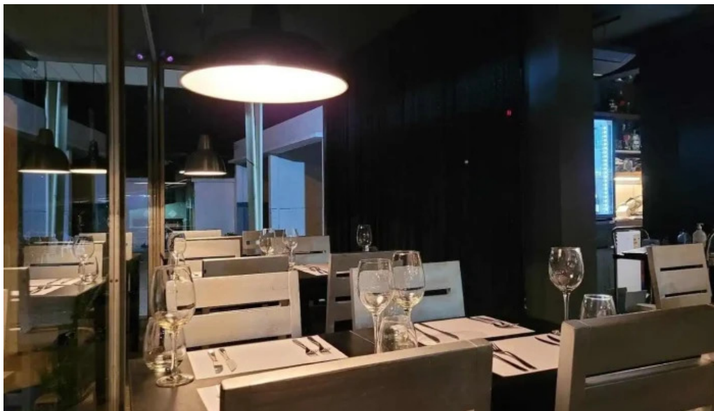
The end ambiente