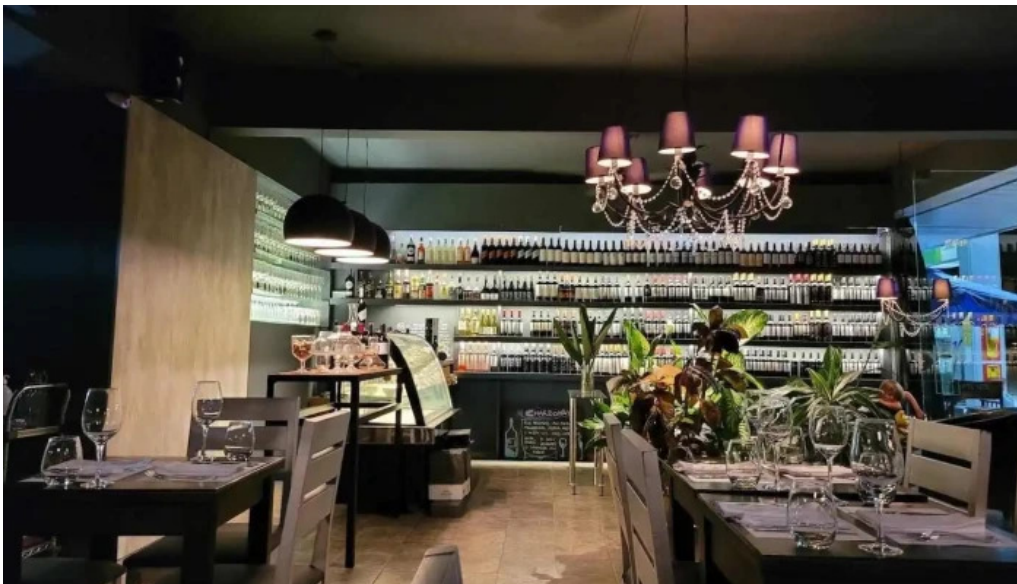
The end todas