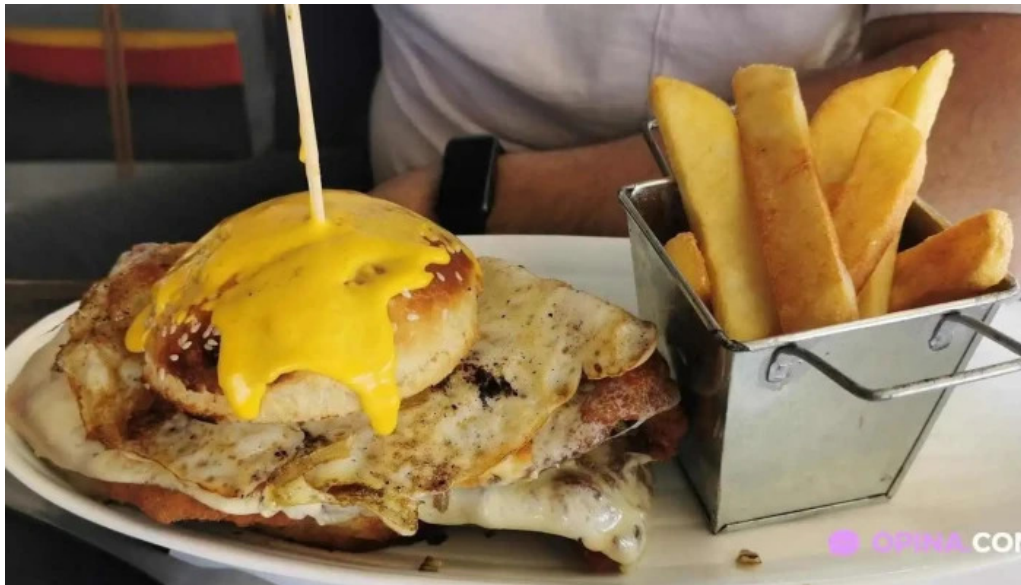
The end comida y bebida