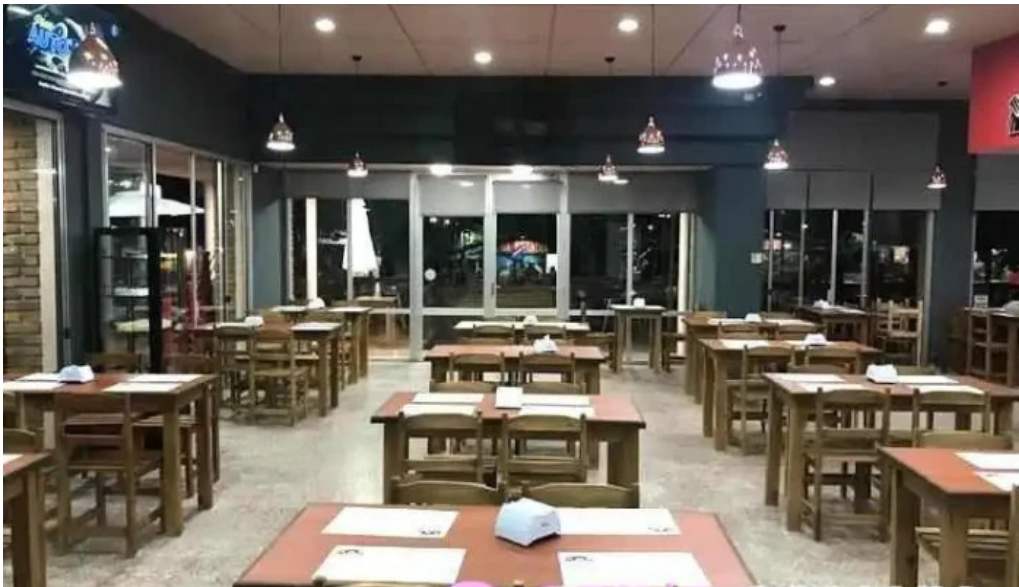
Restaurant this time ambiente