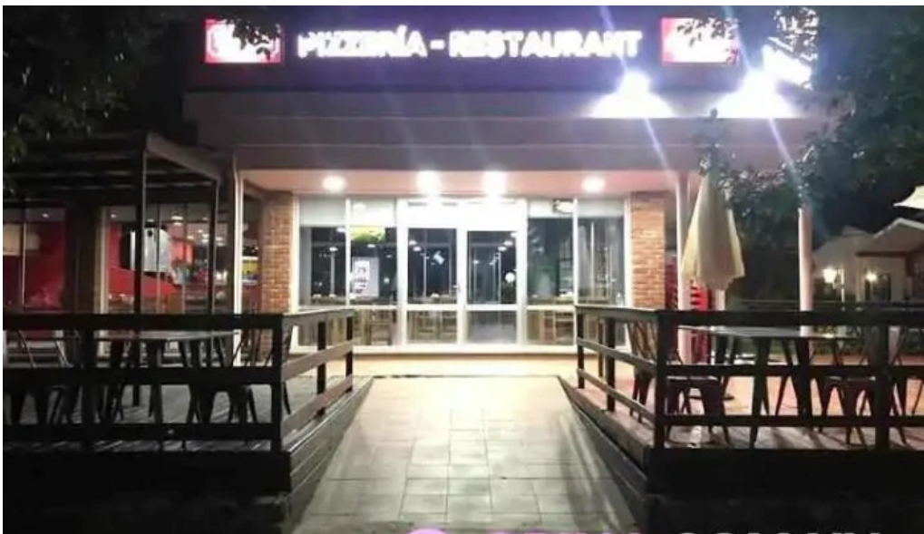
Restaurant this time termas del dayman