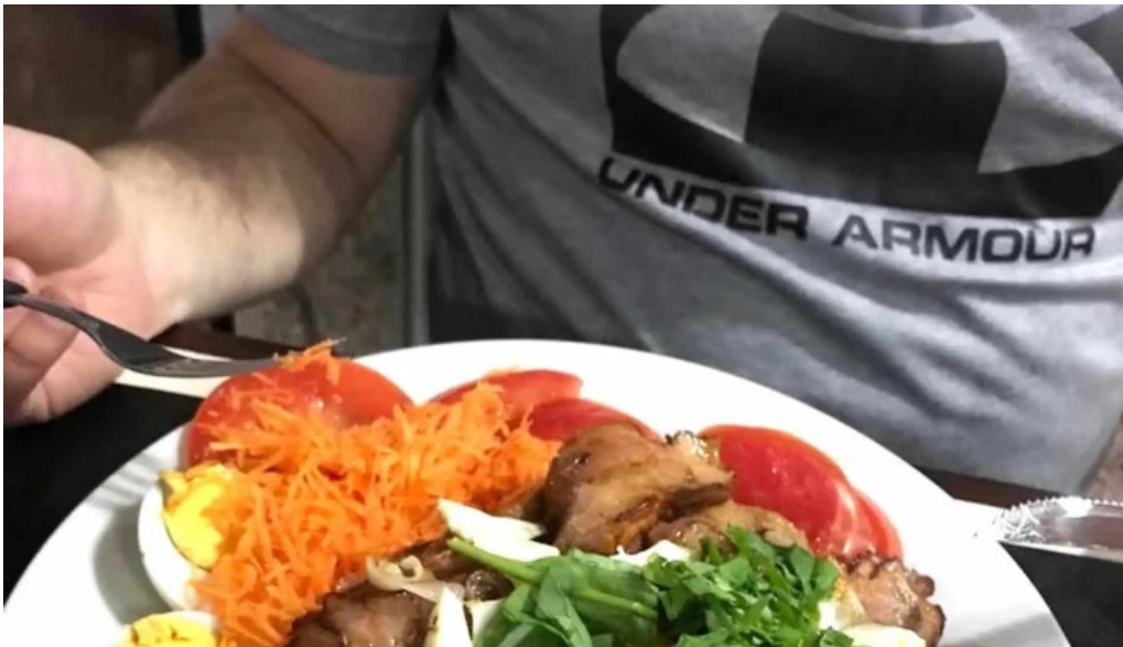
Restaurant this time comentario 3