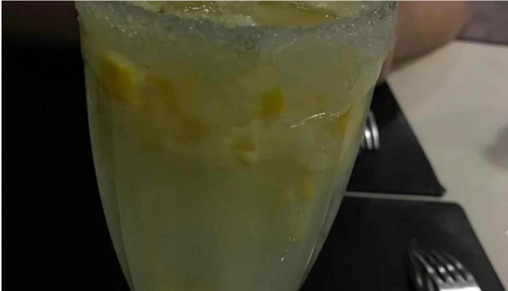
Restaurant this time comentario 1