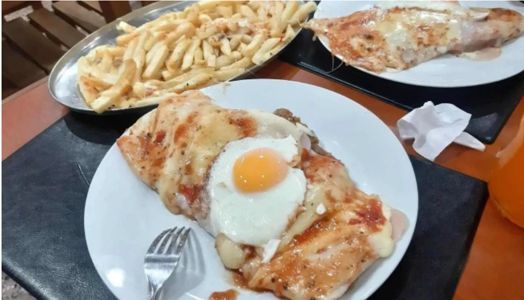
Restaurant this time milanesa