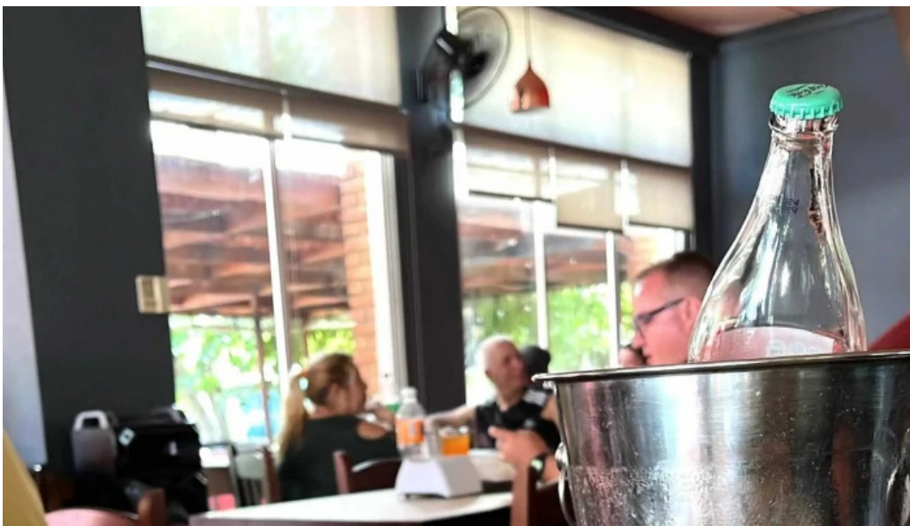
Restaurant this time comentario 6