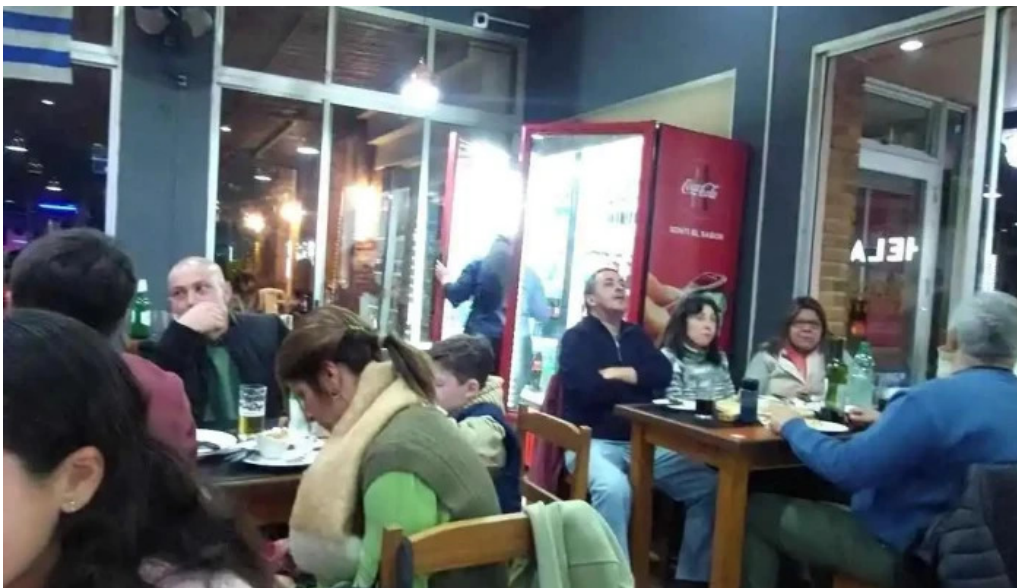
Restaurant this time videos