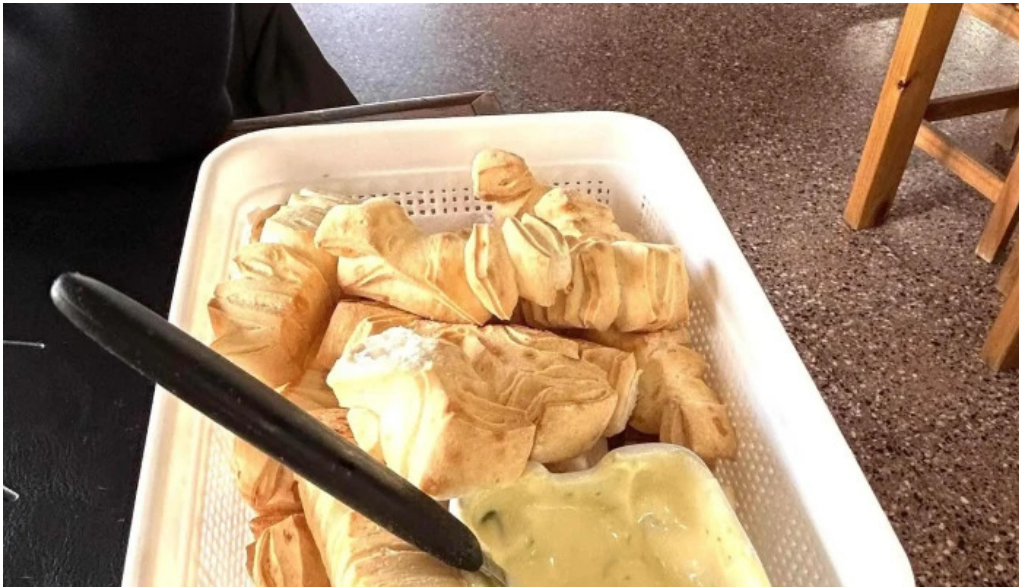
Restaurant this time comentario 7