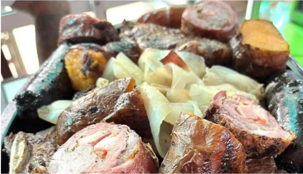
Restaurant this time comentario 5