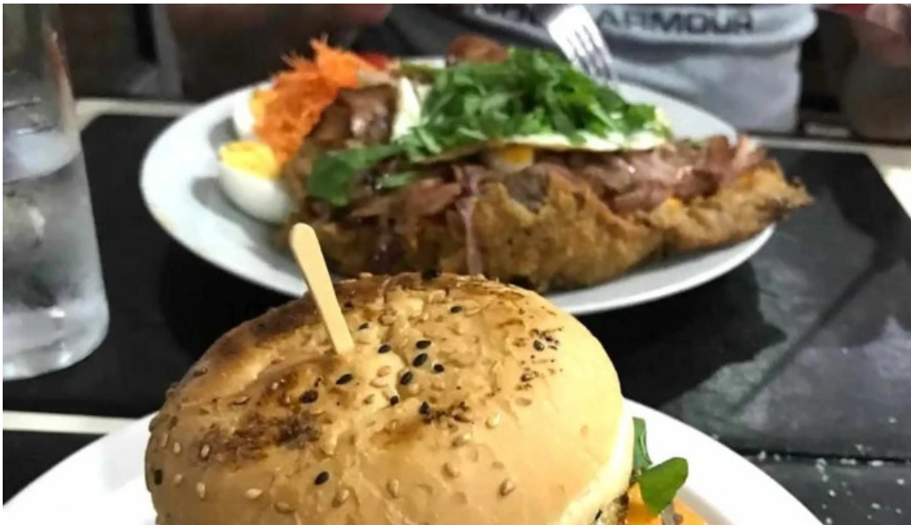
Restaurant this time comentario 4