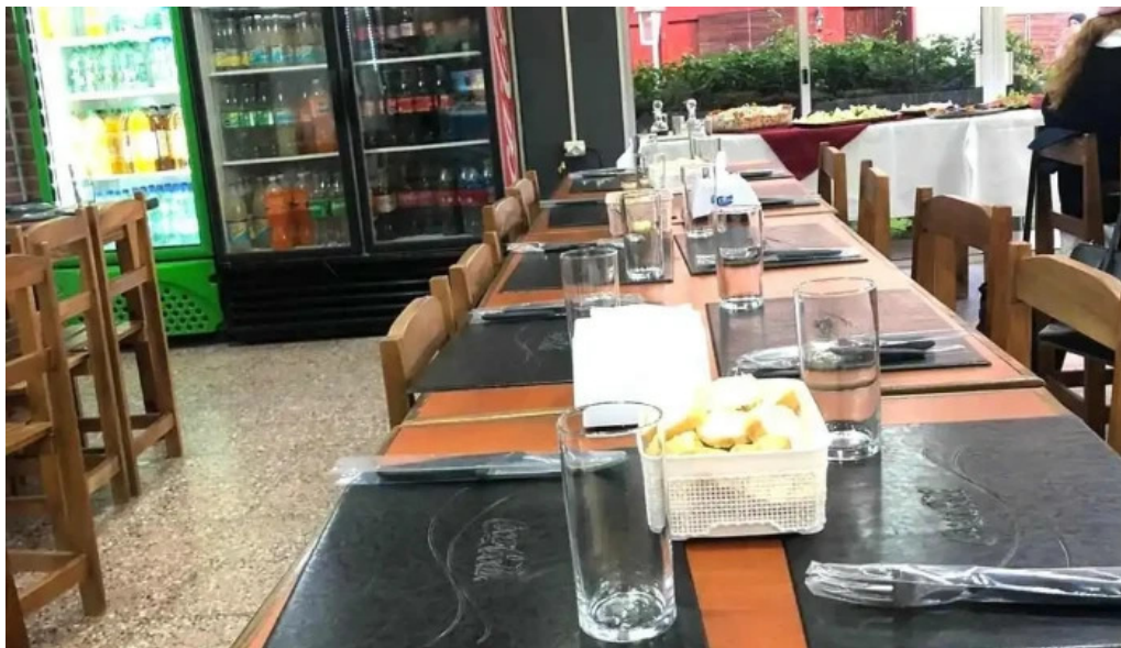
Restaurant this time del propietario