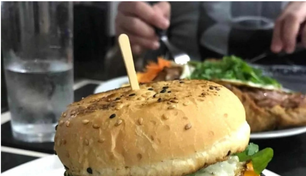
Restaurant this time comentario 2