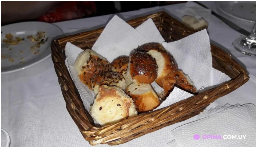
Taller gastronomico luis zunino comida y bebida