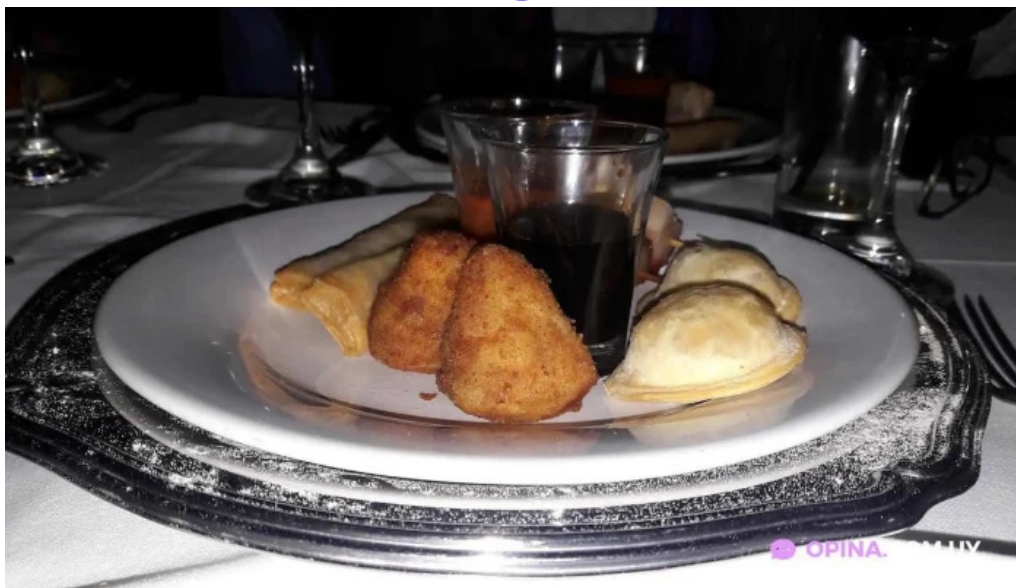
Taller gastronomico luis zunino todas