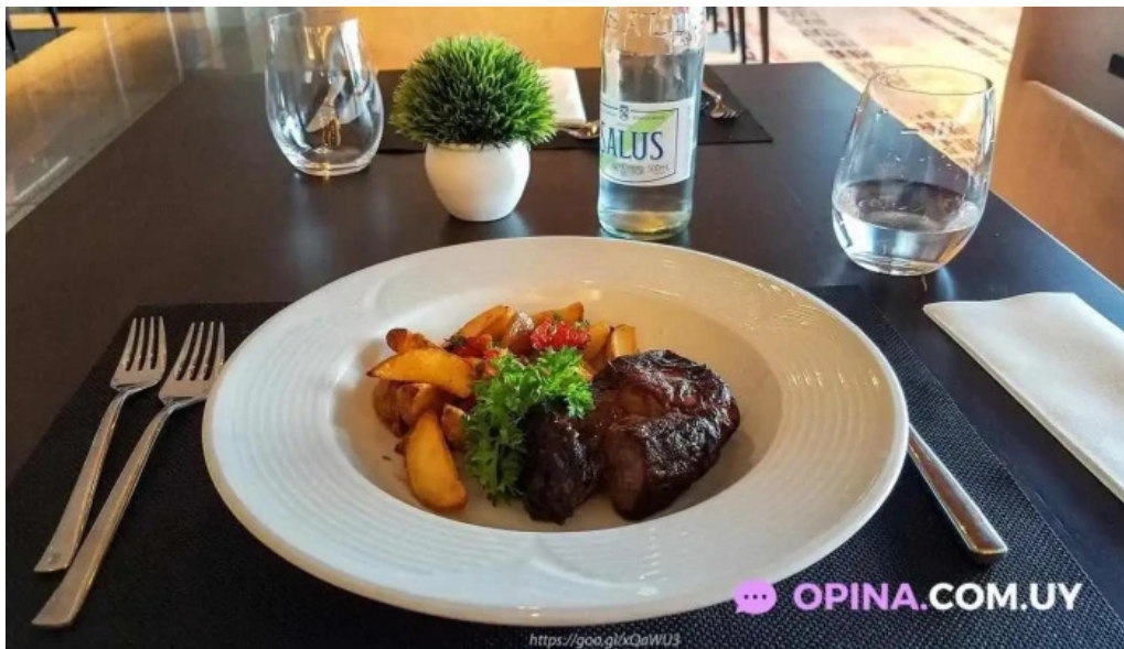
Sudestada restaurant comida y bebida