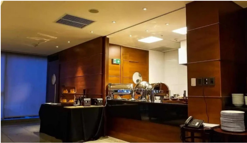
Sudestada restaurant montevideo