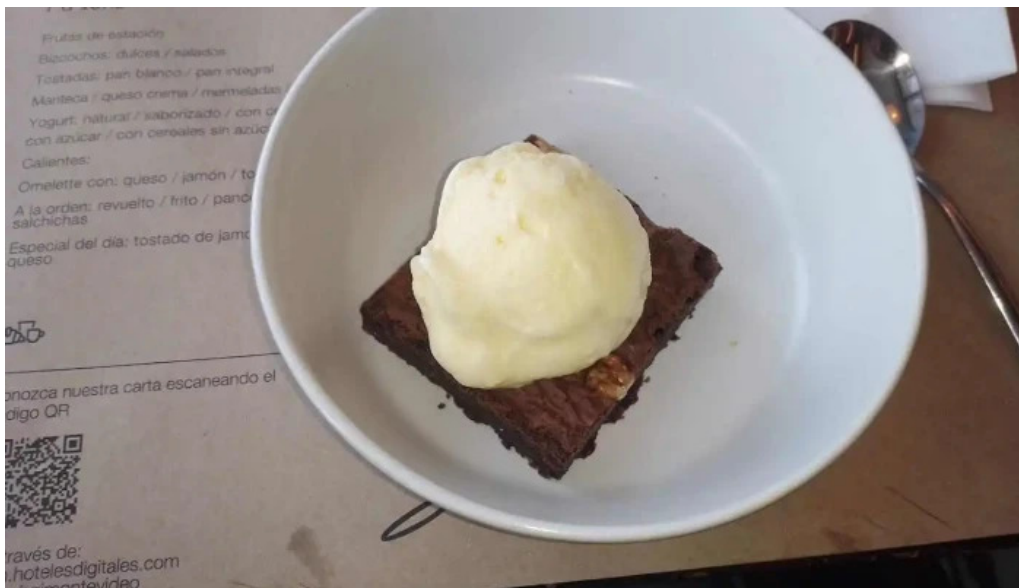
Sudestada restaurant menu