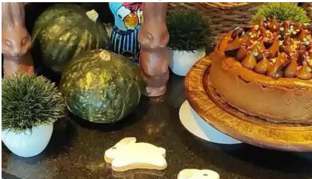
Sudestada restaurant videos