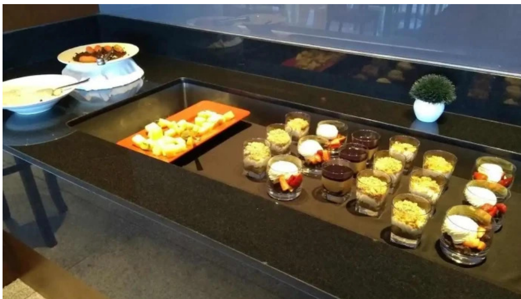
Sudestada restaurant ambiente