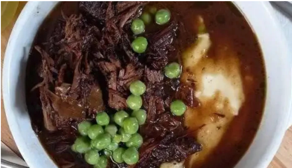
Sucre sale bistro mvd estofado