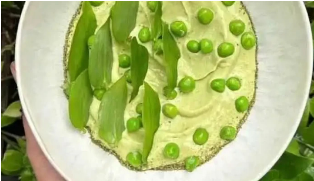
Sucre sale bistro mvd del propietario