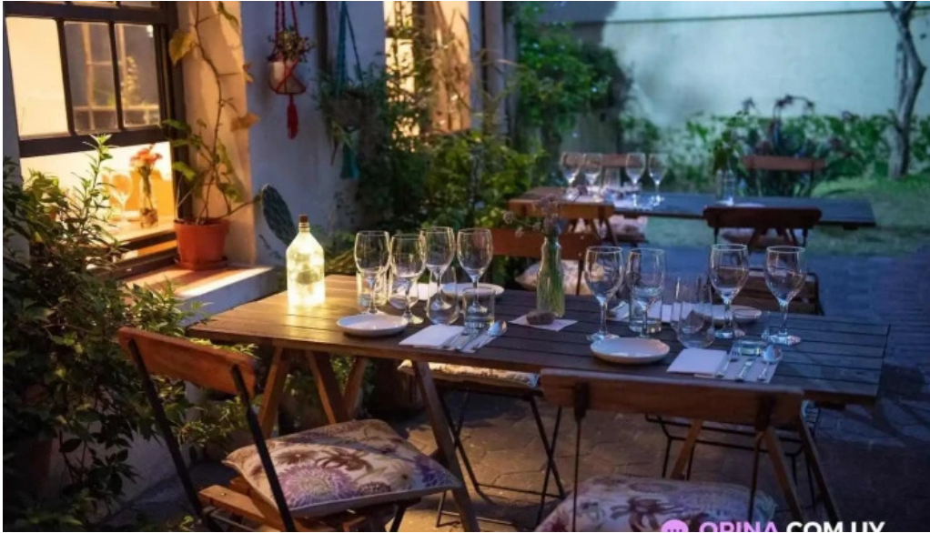
Sucre sale bistro mvd todas