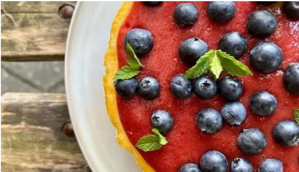
Sucre sale bistro mvd tarta