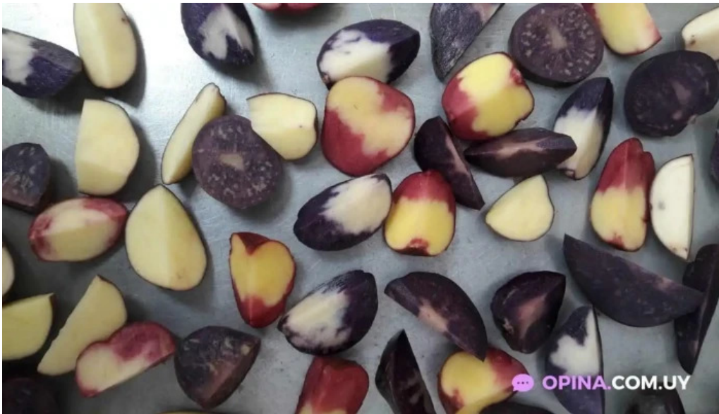
Sucre sale bistro mvd comida y bebida