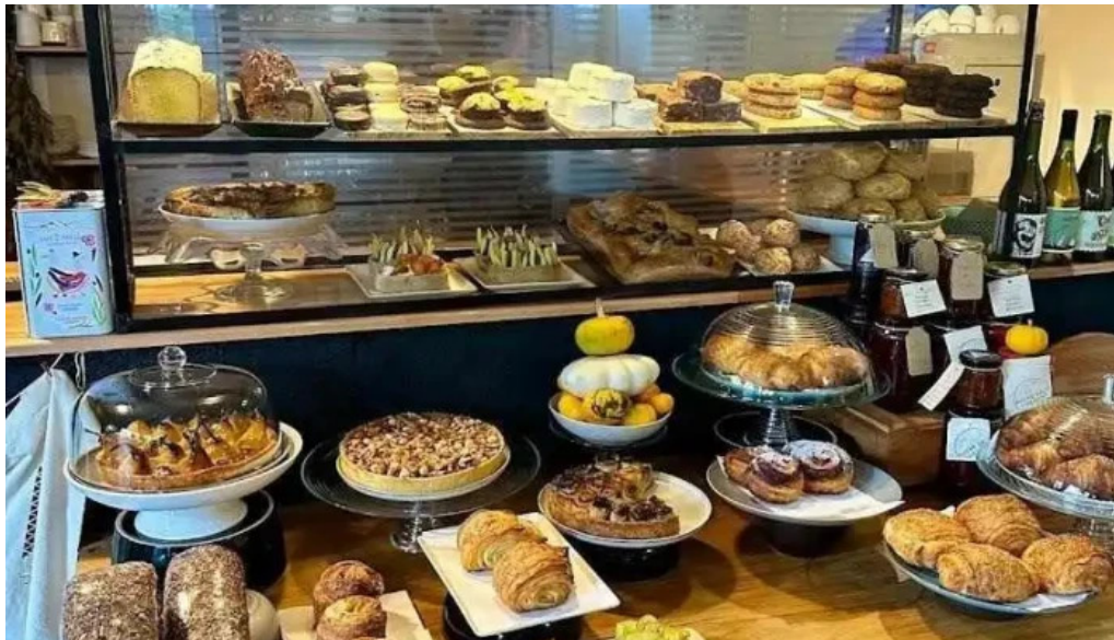
Sucre sale bistro mvd ambiente