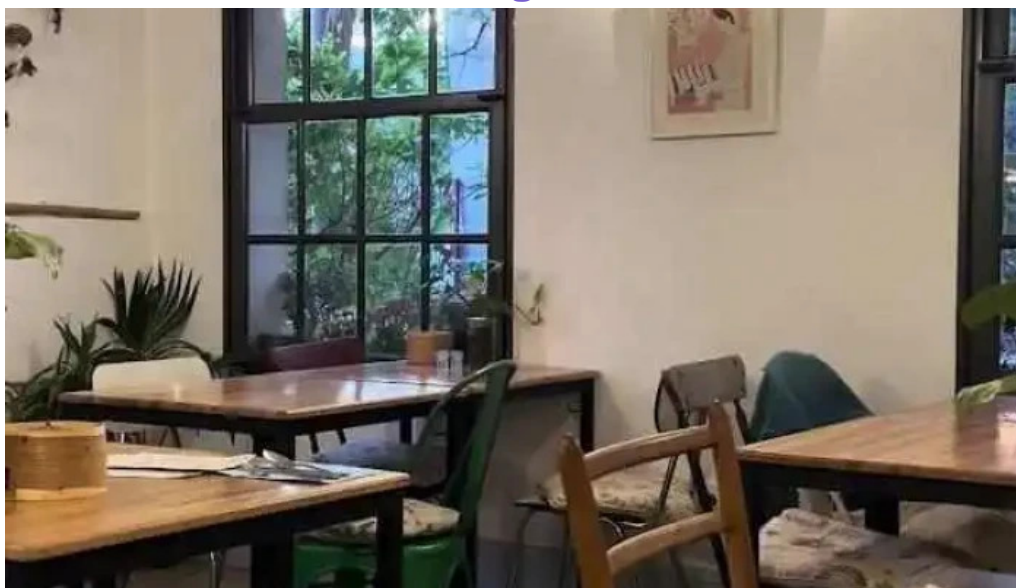
Sucre sale bistro mvd videos