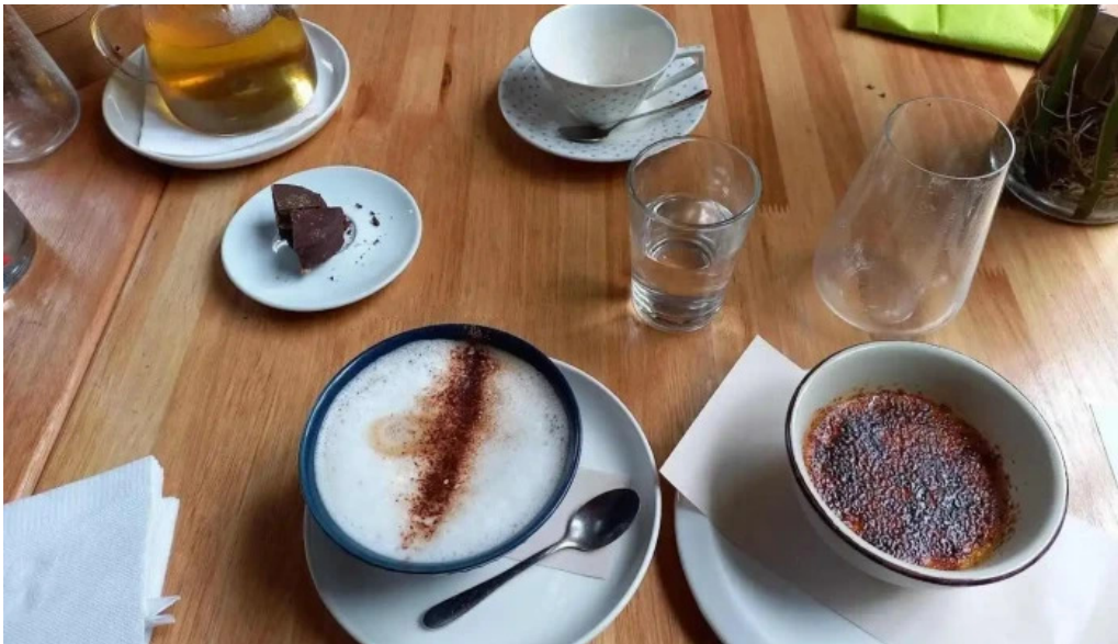
Sucre sale bistro mvd capuchino