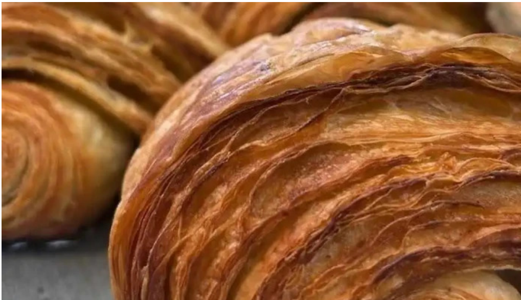
Sucre sale bistro mvd croissant