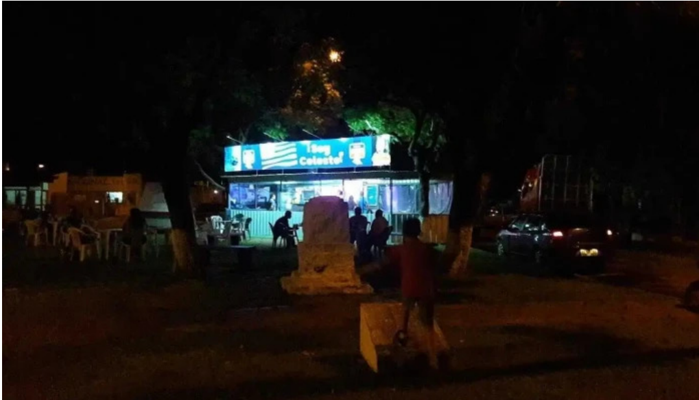
Soy celeste todas