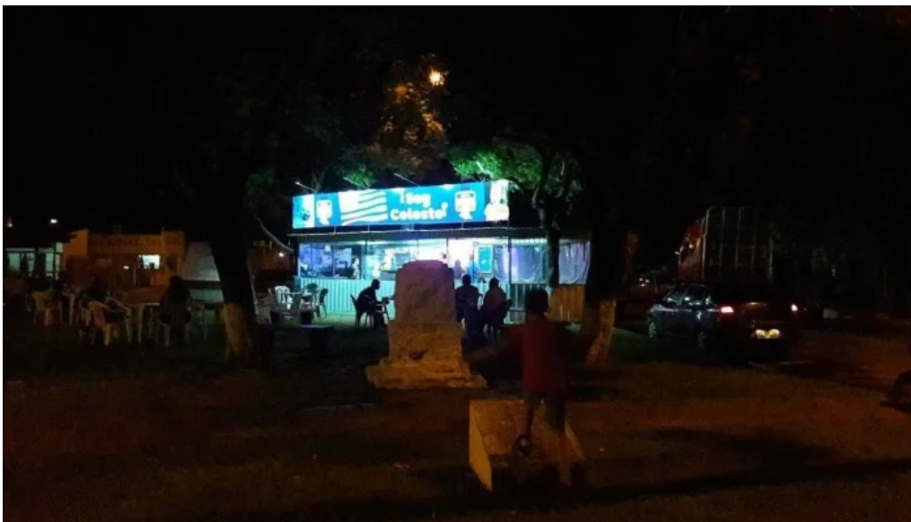
Soy celeste paysandu