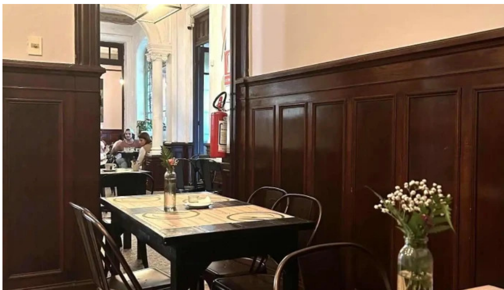
Savia cafe y cultura ambiente