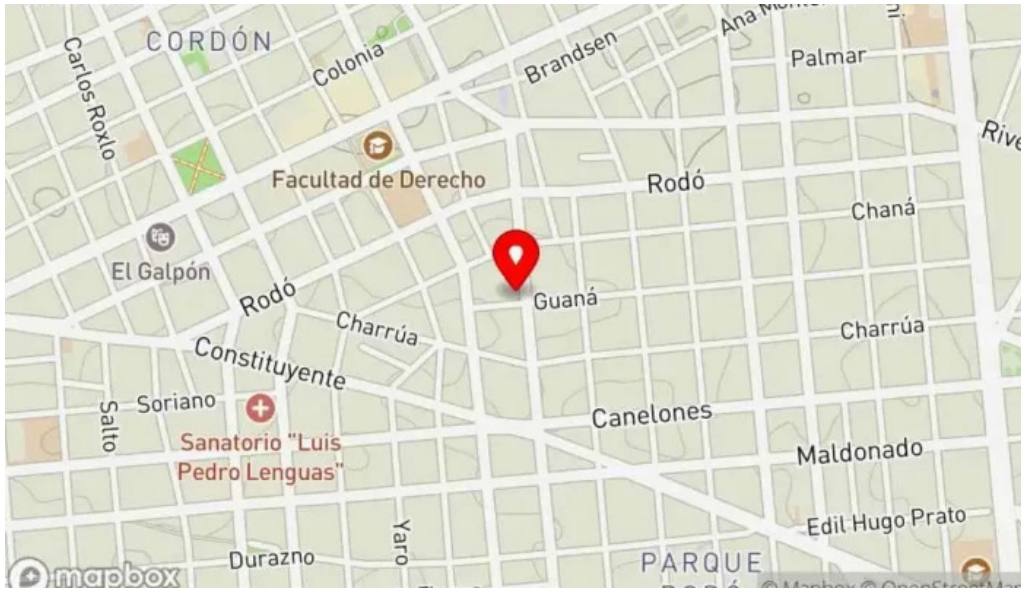
Savia cafe y cultura mapa