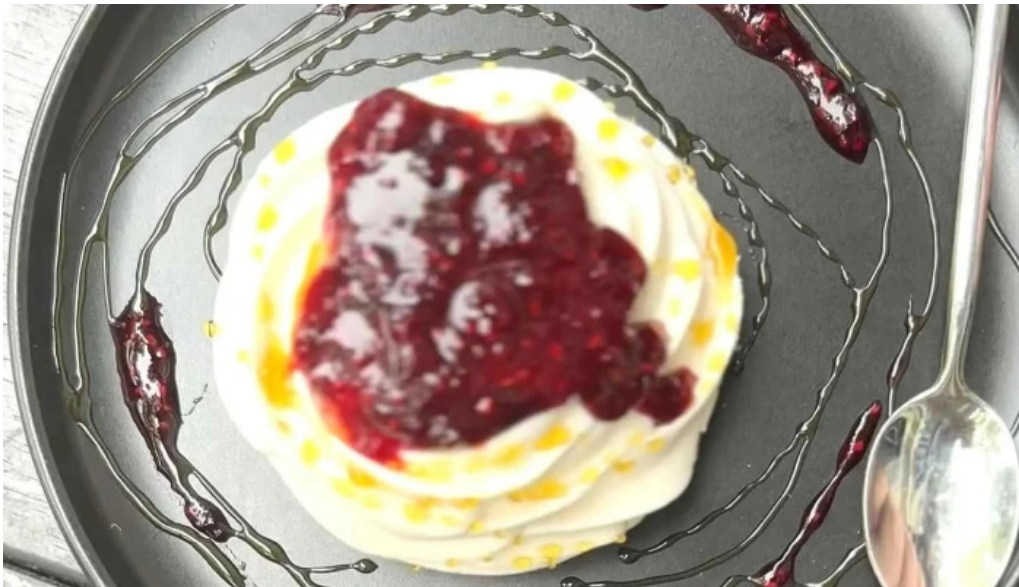
Savia cafe y cultura comentario 6