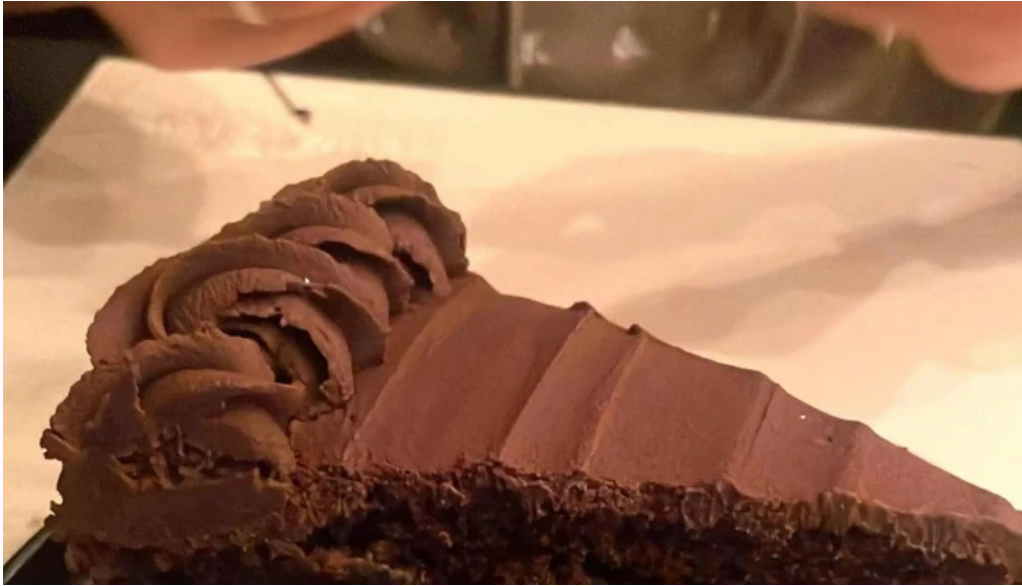
Savia cafe y cultura comentario 2