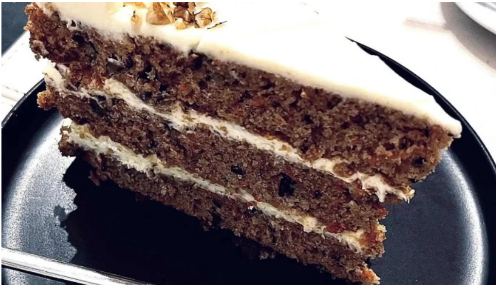
Savia cafe y cultura recientes