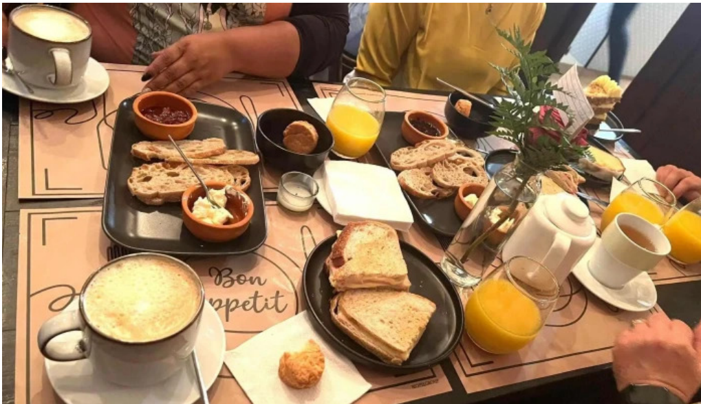
Savia cafe y cultura comidas y bebidas