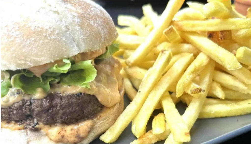
Savia cafe y cultura comentario 4