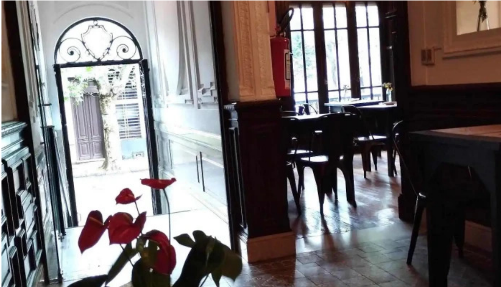
Savia cafe y cultura del propietario