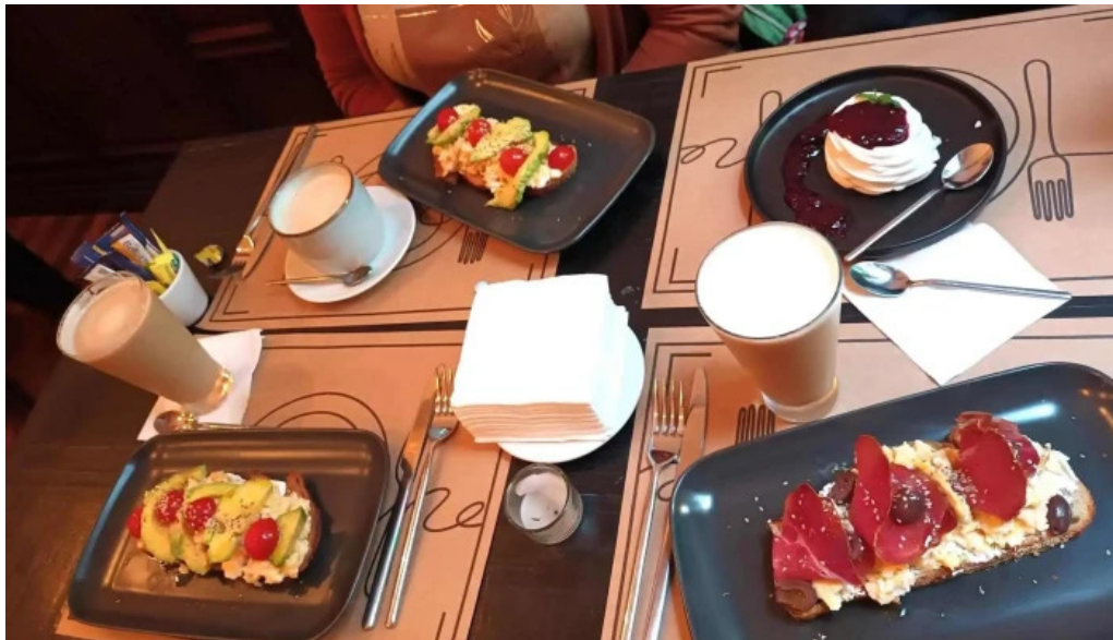
Savia cafe y cultura jugo