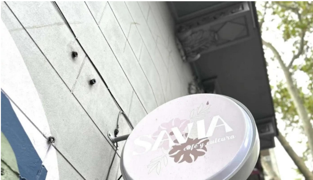
Savia cafe y cultura comentario 3