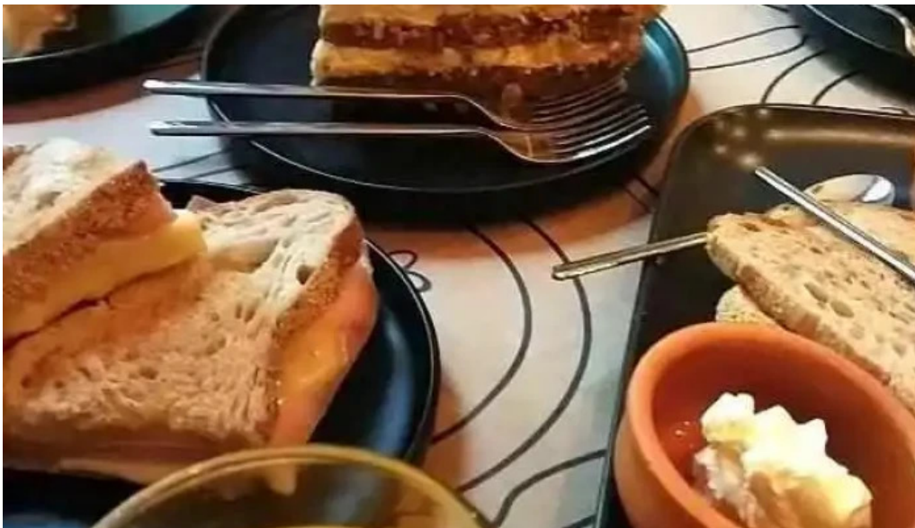
Savia cafe y cultura videos