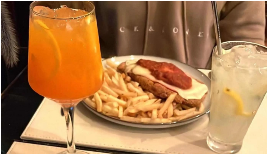
Savia cafe y cultura comentario 1