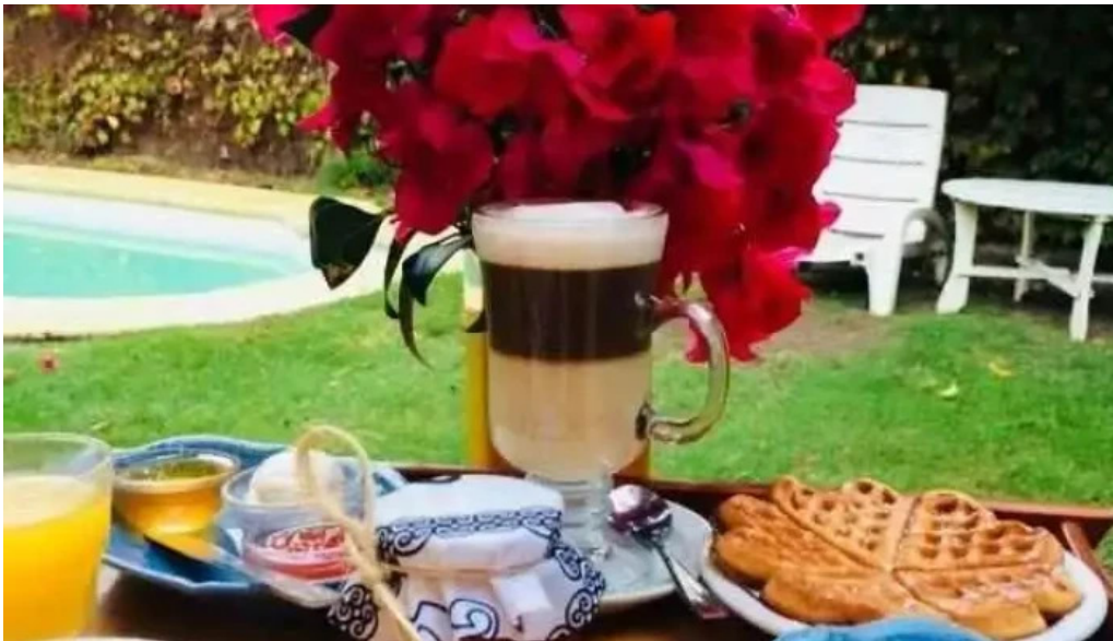
Santoral comida y bebida