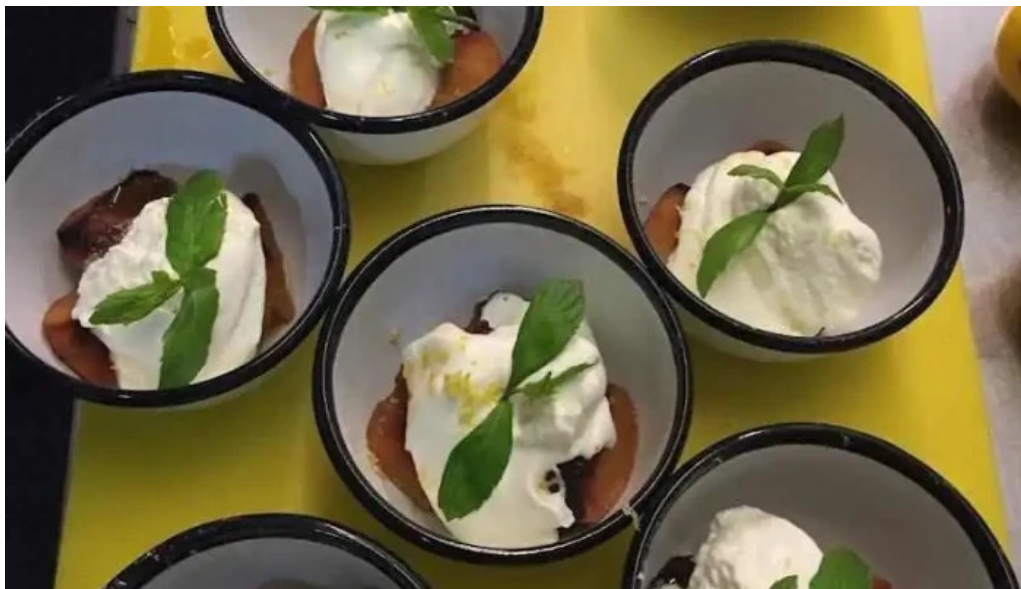
Santoral del propietario