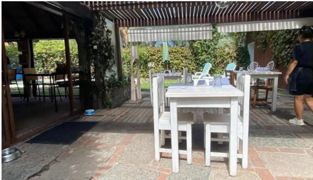
Santoral mas recientes