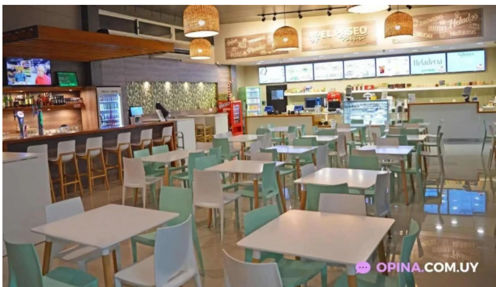
El paseo bistro restaurante todas