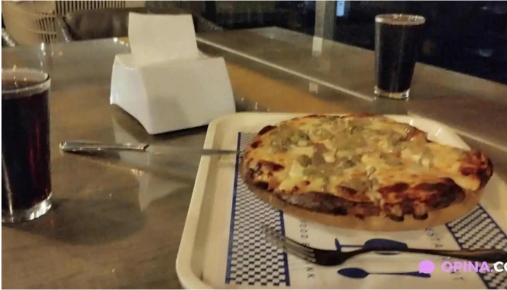
El paseo bistro restaurante mas recientes