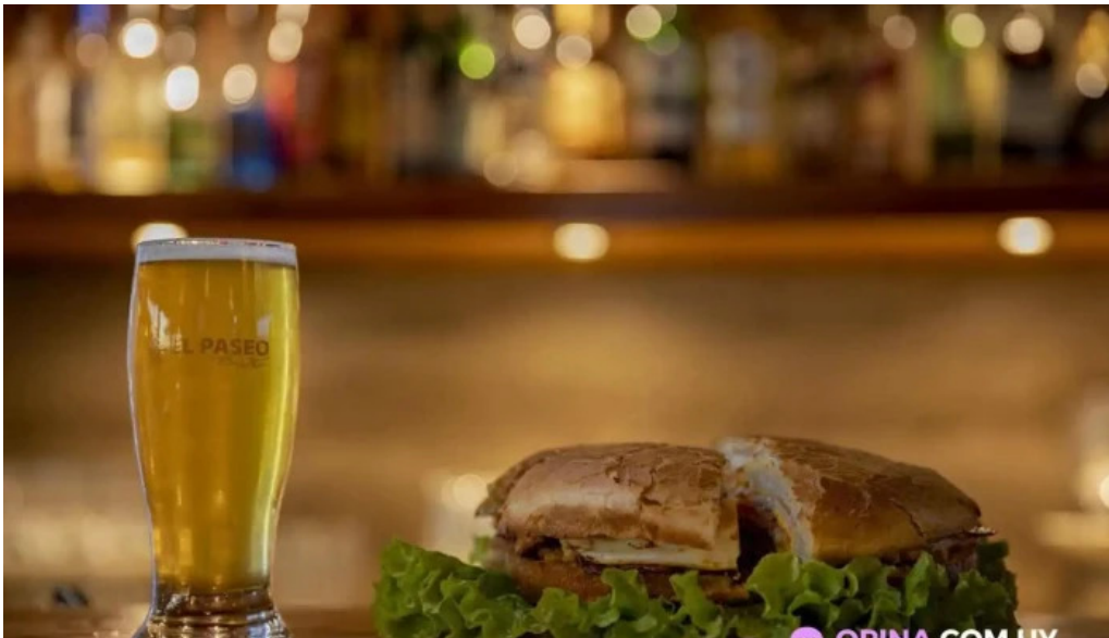
El paseo bistro restaurante comida y bebida