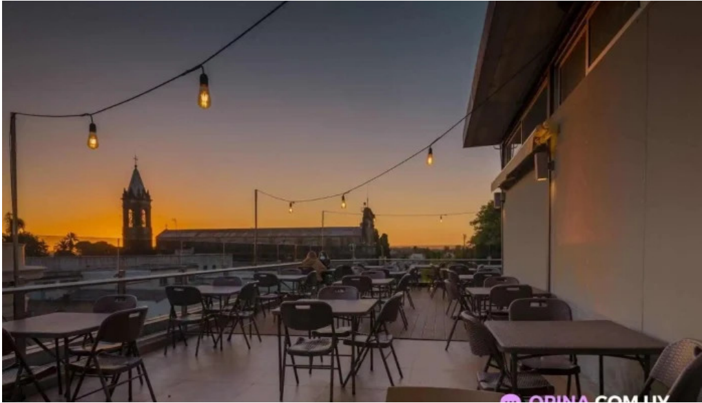
El paseo bistro restaurante del propietario