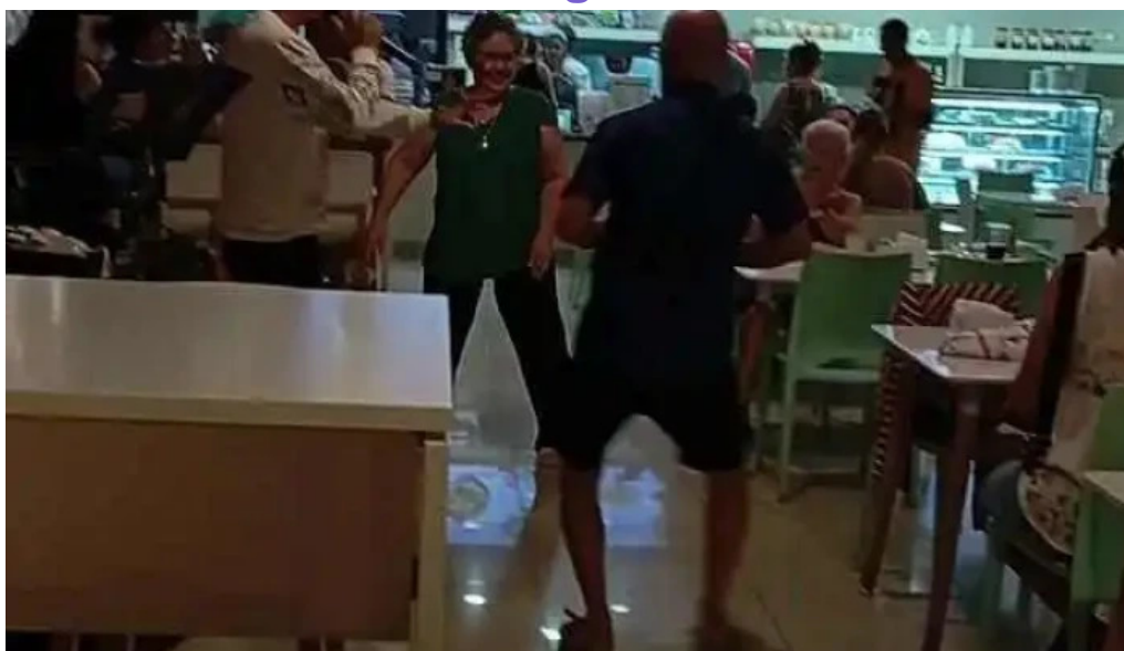
El paseo bistro restaurante videos