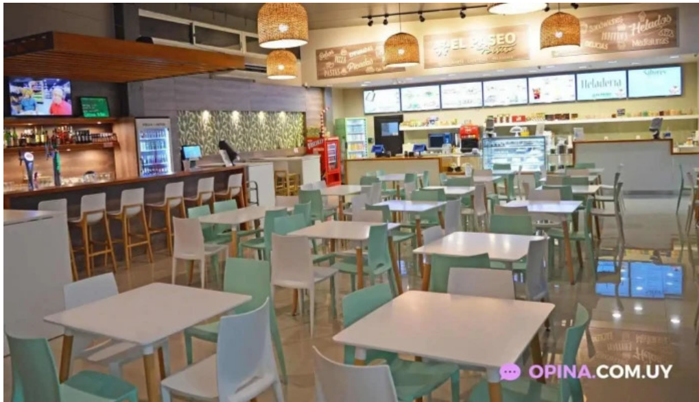
El paseo bistro restaurante santa lucia