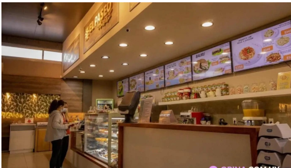
El paseo bistro restaurante ambiente