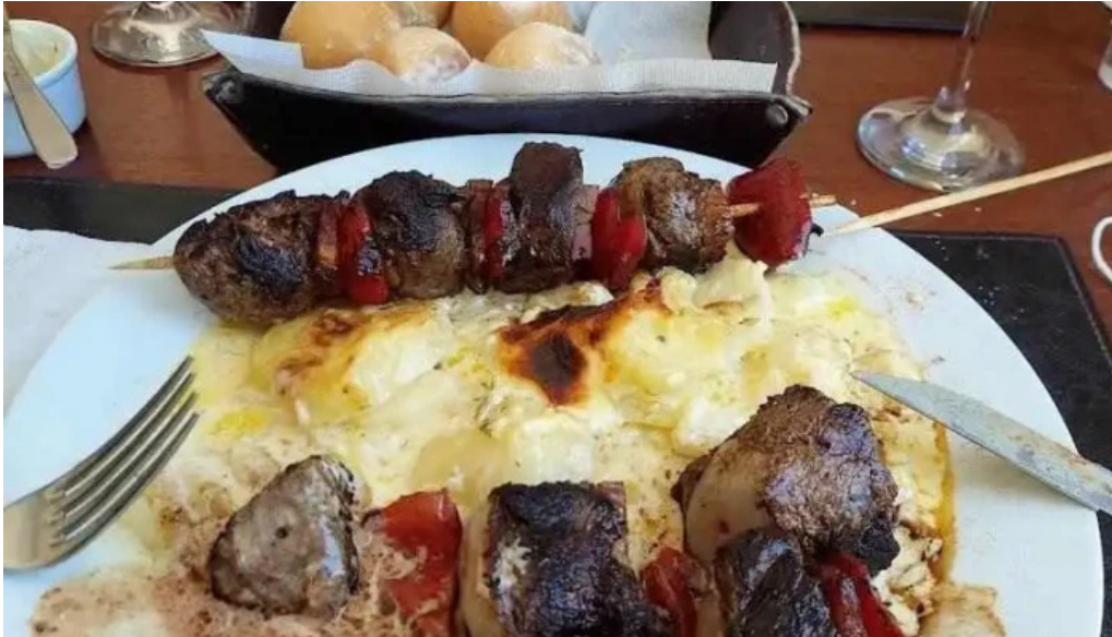
Salvaterra comida y bebida