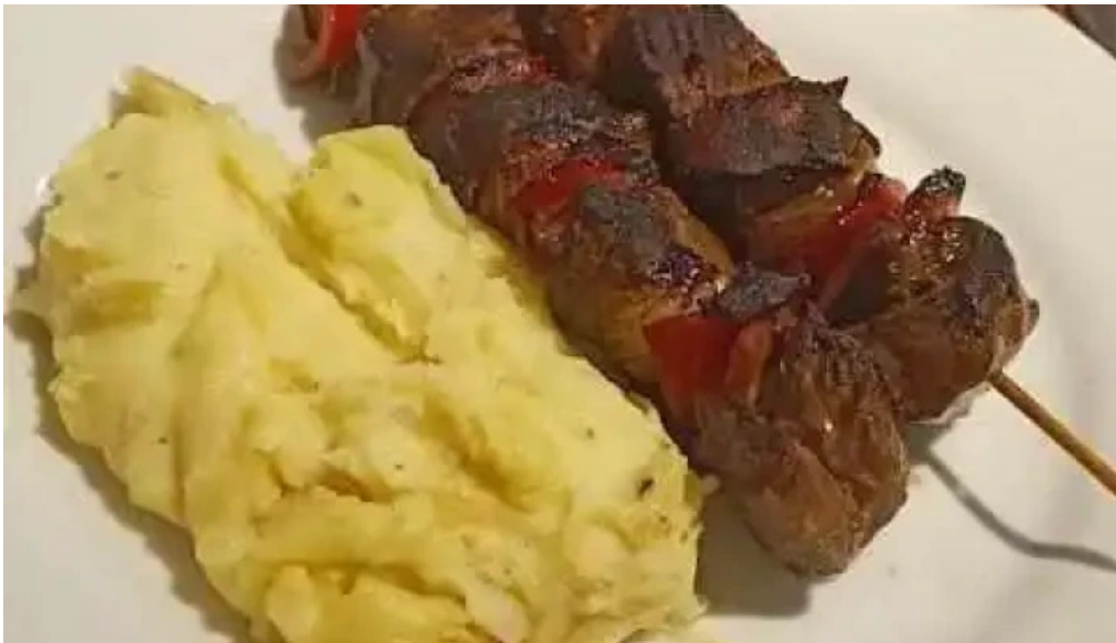
Salvatera mas recientes