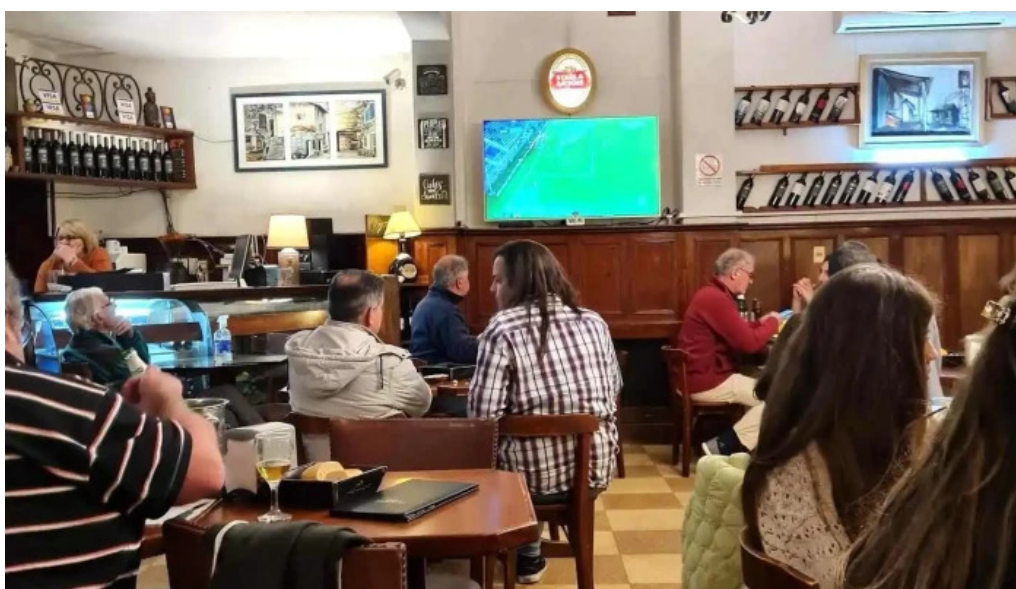
La trattoria ambiente