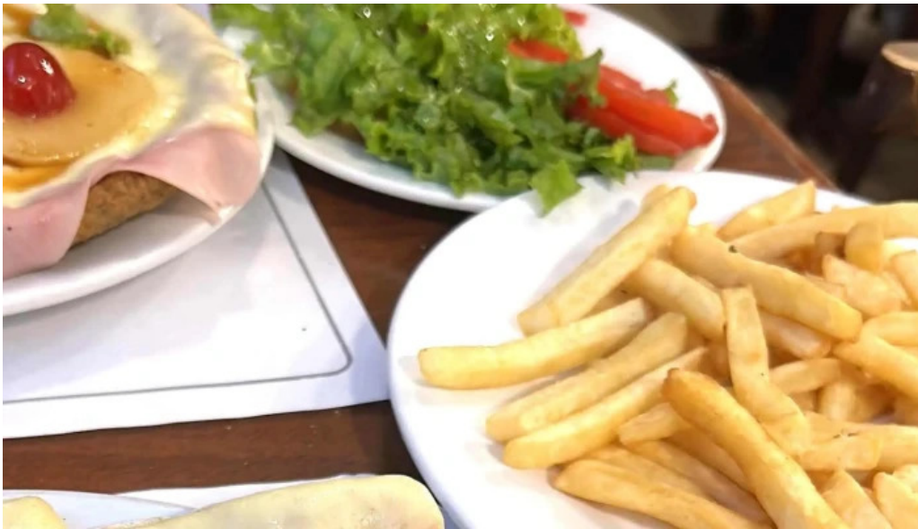
La trattoria comentario 1