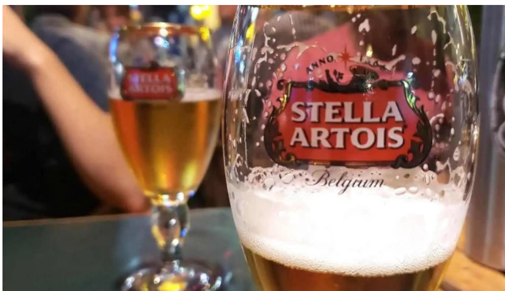
La trattoria cerveza