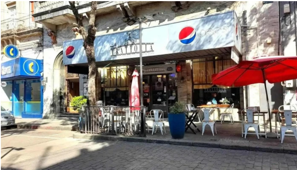
La trattoria salto