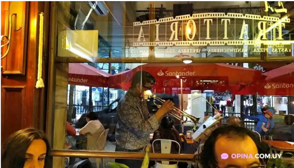
La trattoria videos