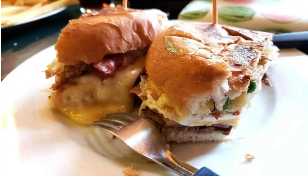
La trattoria sandwich de pollo