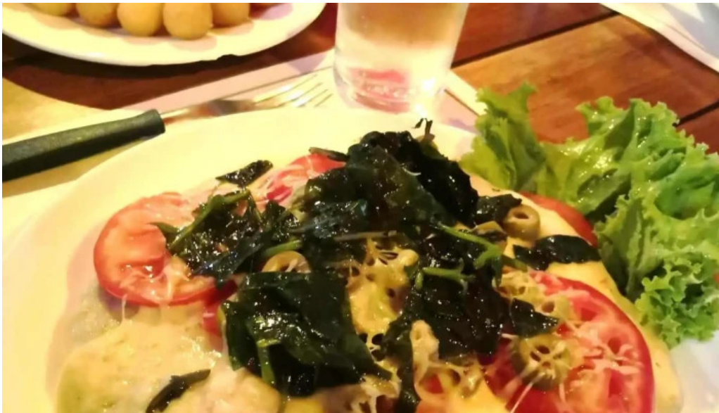
La trattoria milanese