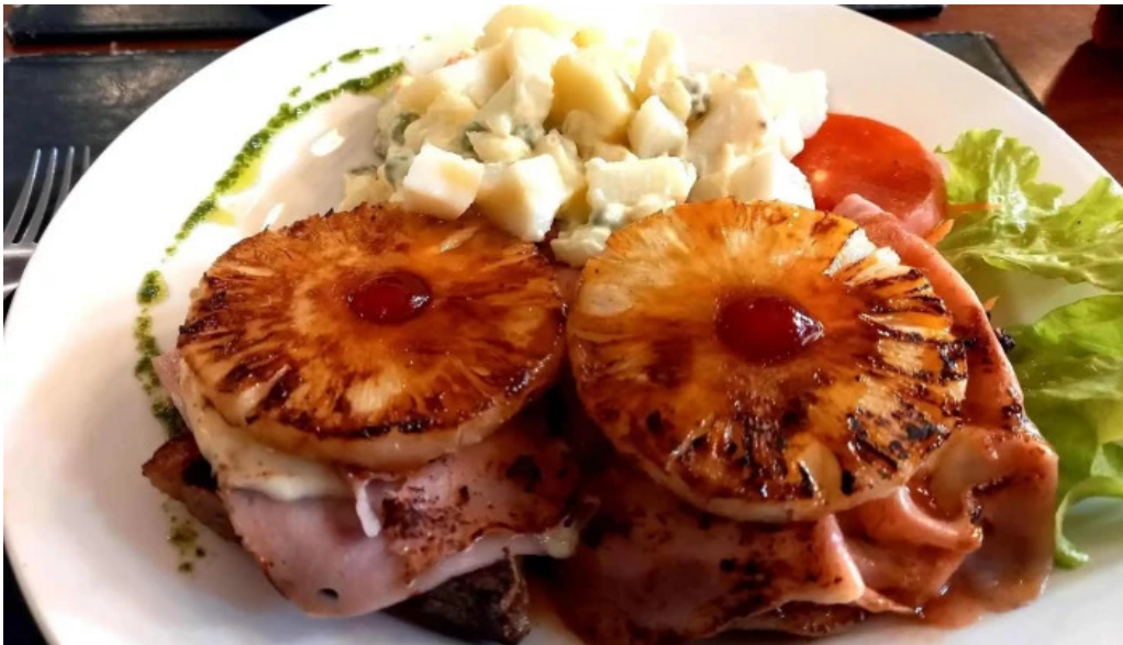
La trattoria pina