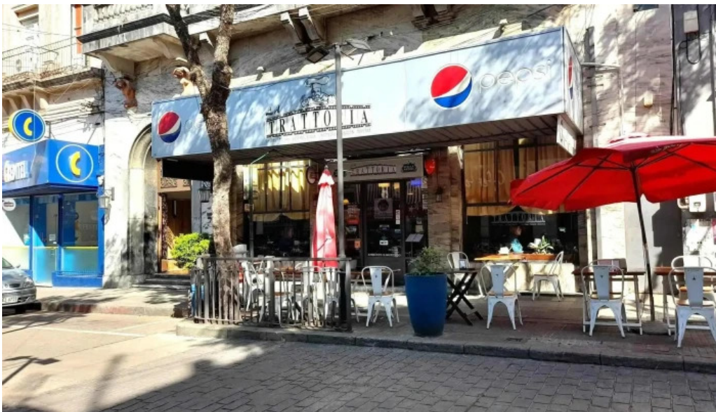
La trattoria todo