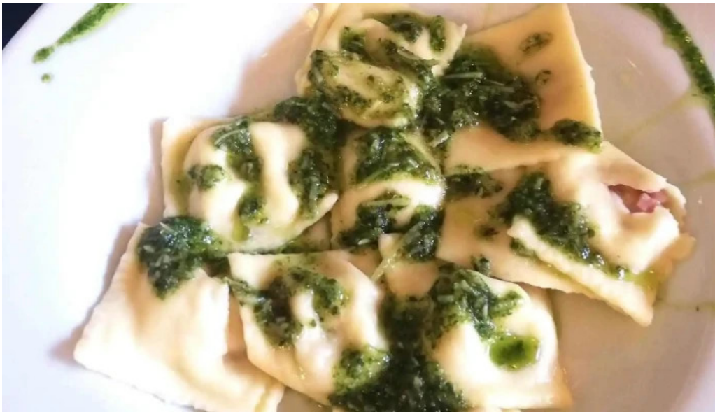
La trattoria ravioli