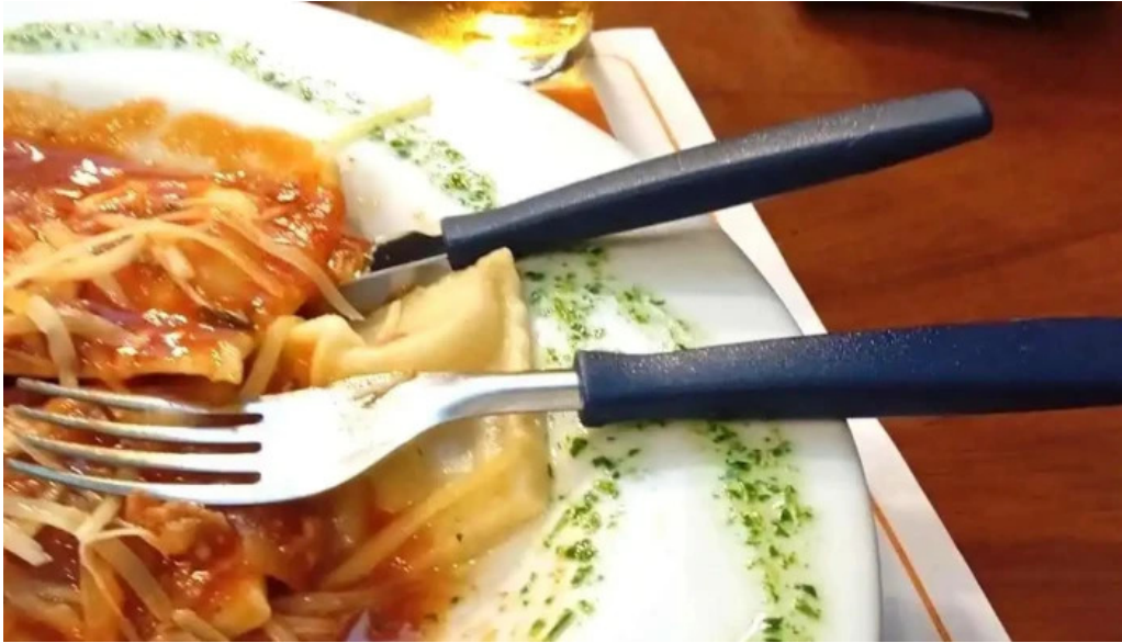
La trattoria recientes