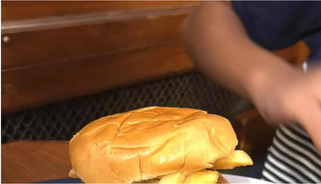
La trattoria comentario 2