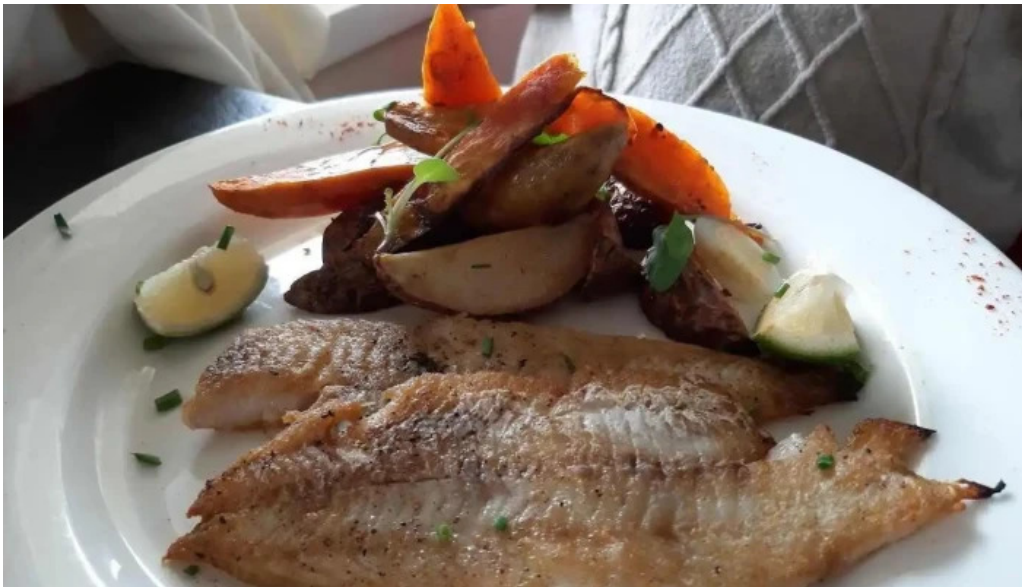
Salacia comida y bebida