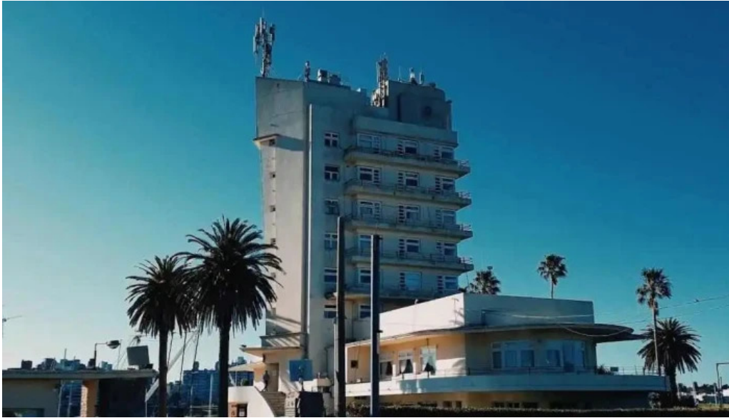
Salacia del propietario