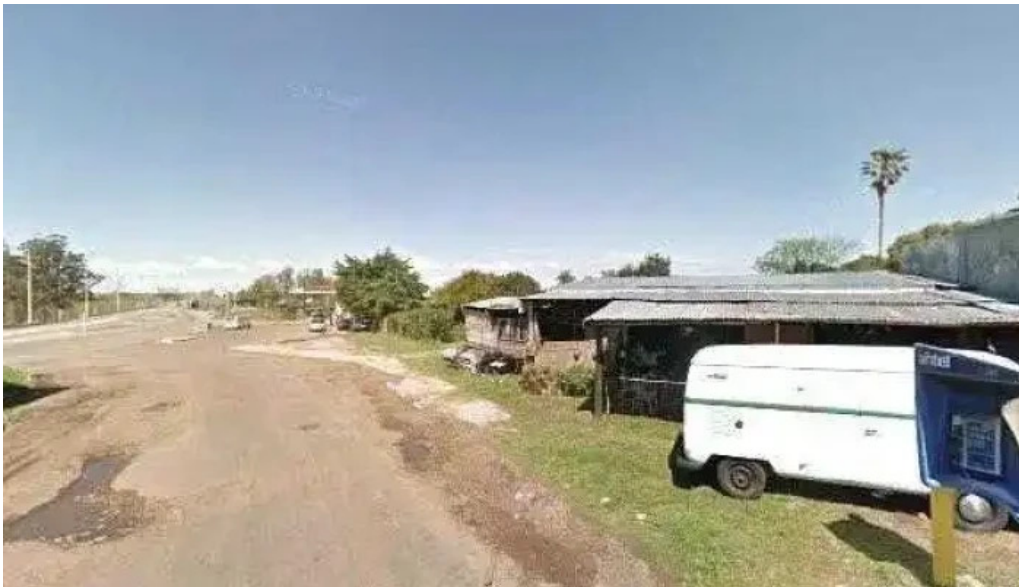
Sbor mi street view y 360