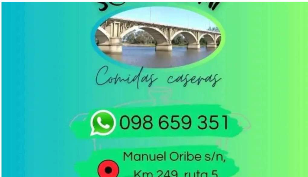
Sbor mi del propietario