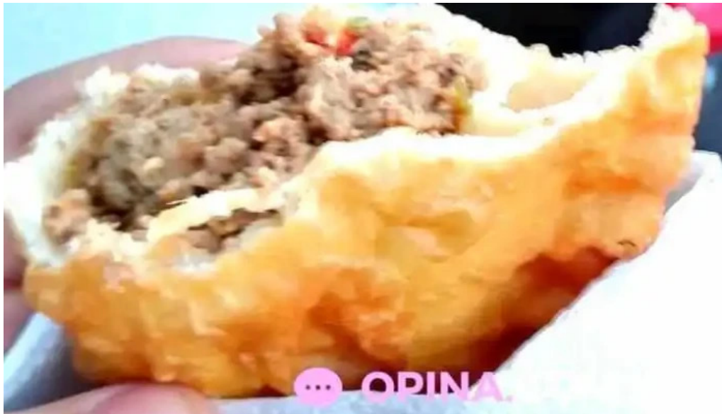
Sbor mi comidas y bebidas