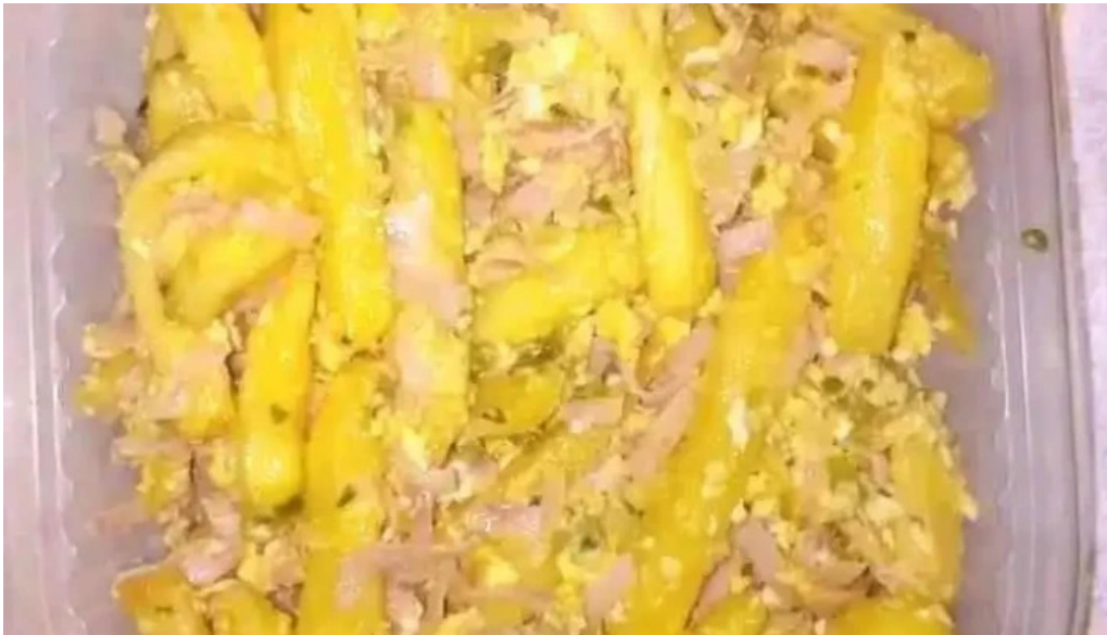
Sbor mi todo