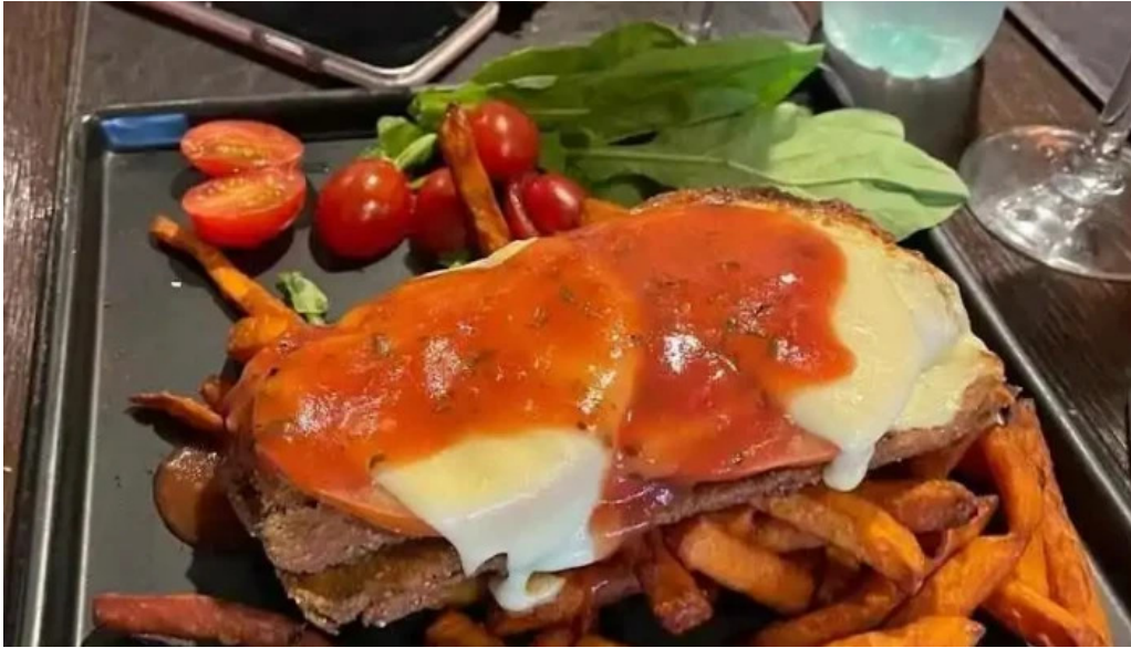
Rustica papas fritas