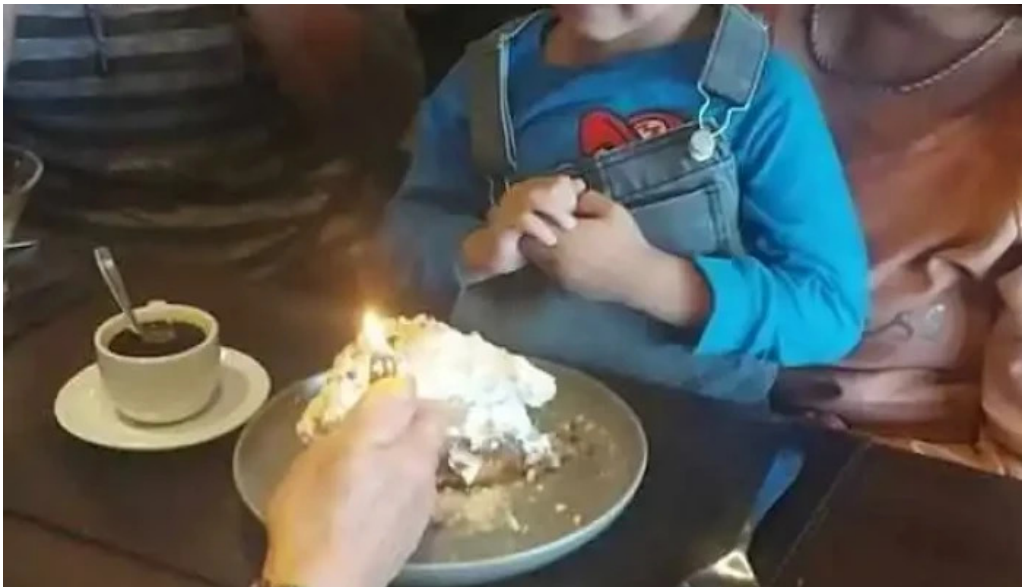
Rustica mas recientes