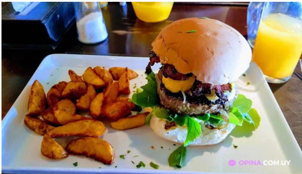
Rústica comida y bebida