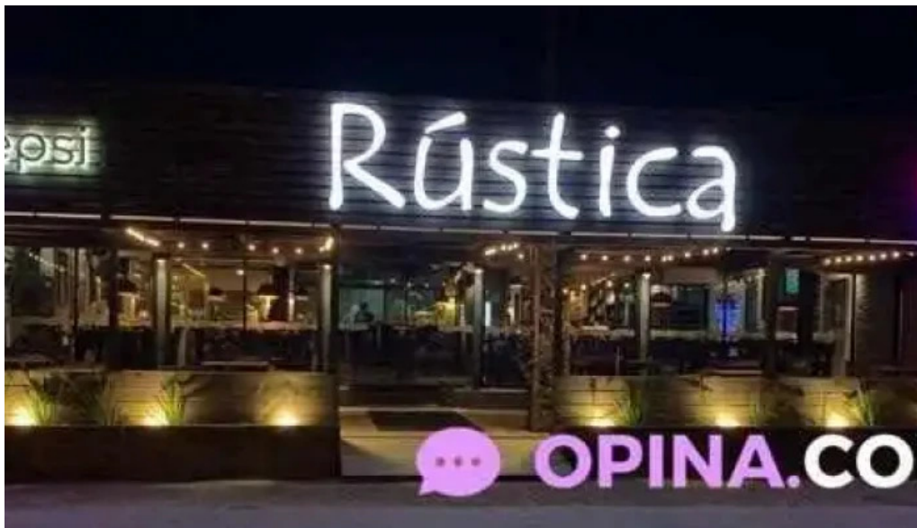
Rústica del propietario