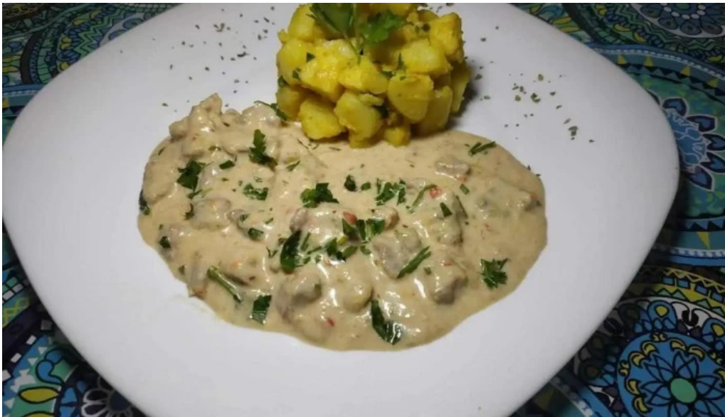
Rotiseria riquelme mas recientes