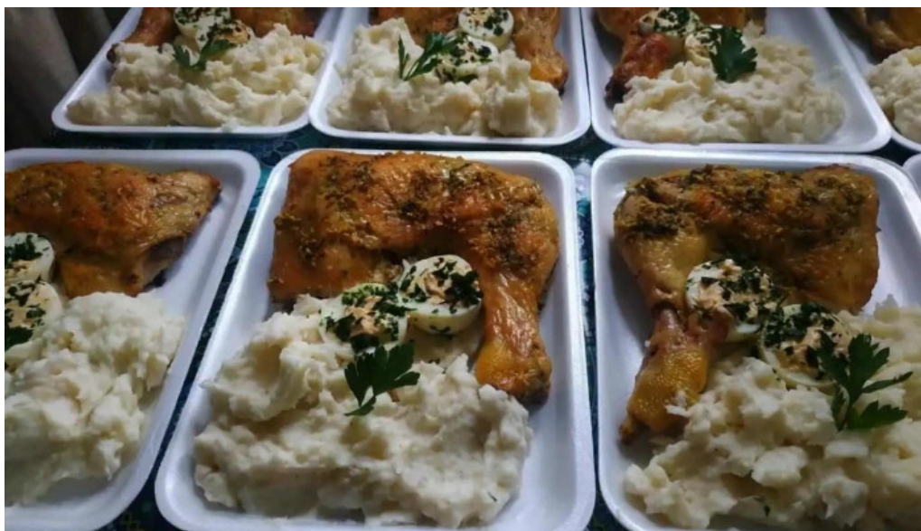
Rotiseria riquelme del propietario