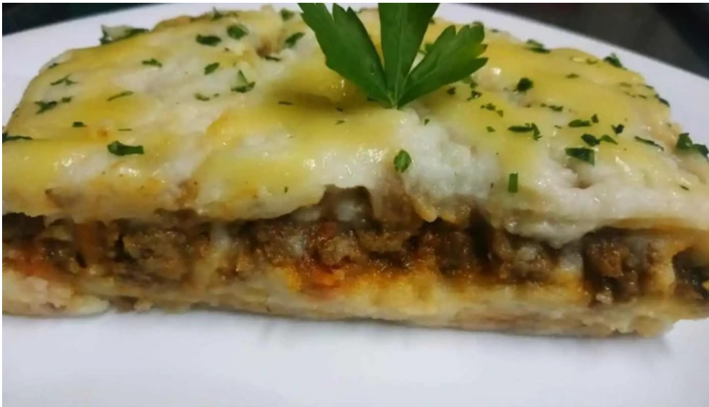
Rotiseria riquelme treinta y tres