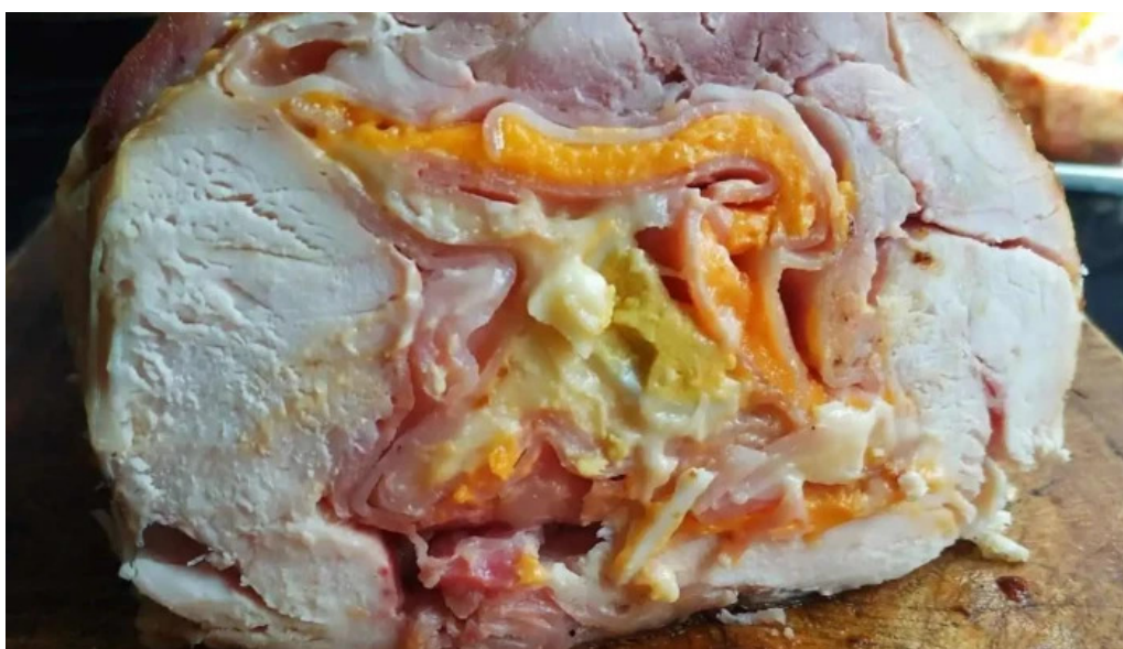
Rotiseria riquelme comida y bebida