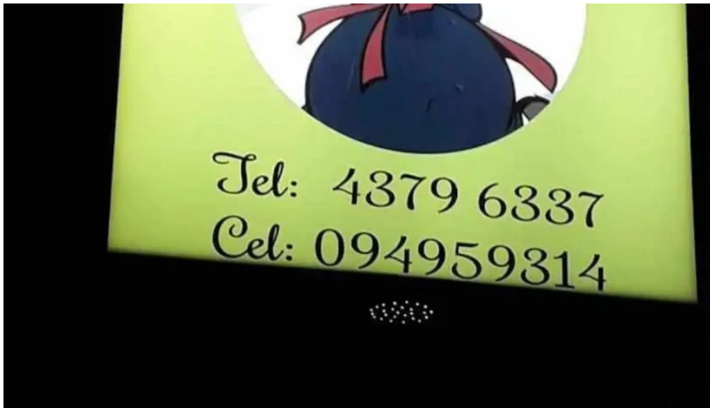
Rotiseria chari todas