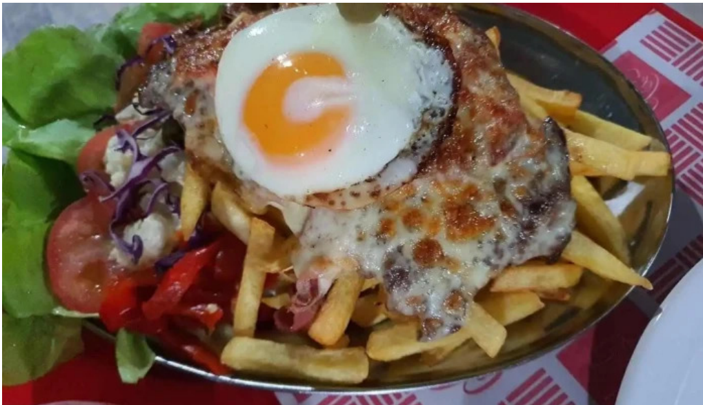
Casa vecchia comida y bebida