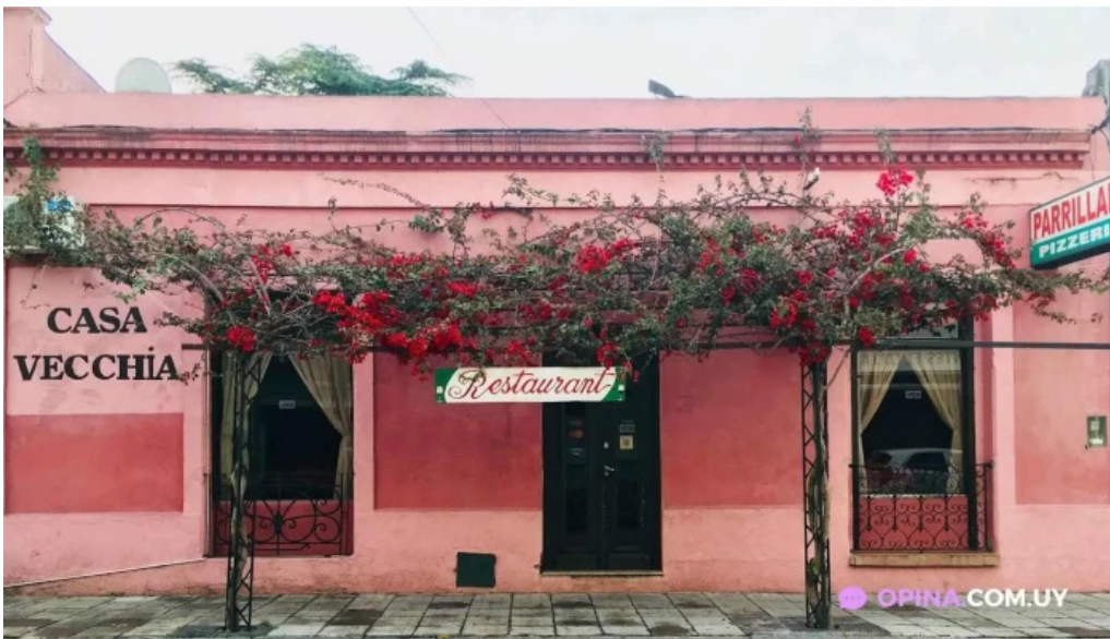
Casa vecchia rosario