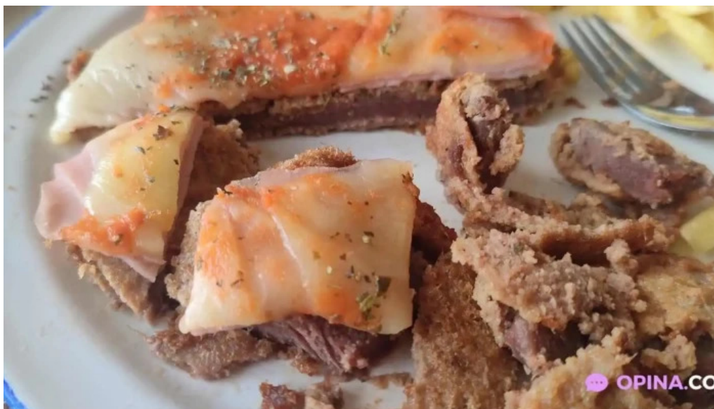
Parador rocha comida y bebida