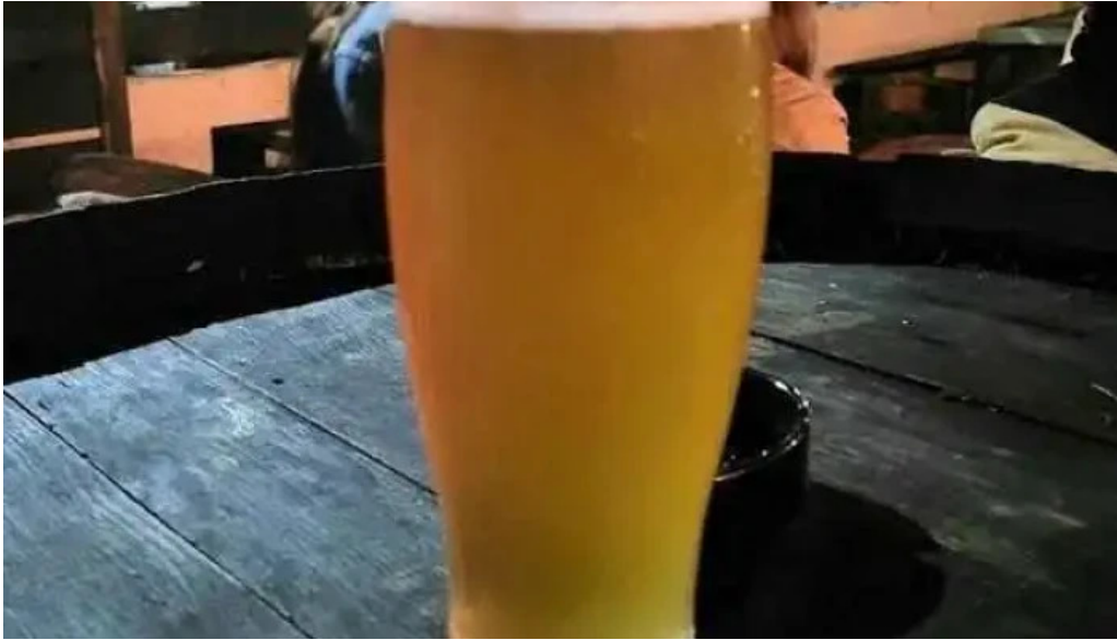
Novillos cerveza artesanal y gastronomía todas