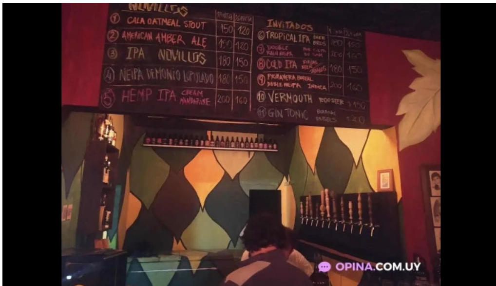
Novillos cerveza artesanal y gastronomía menu