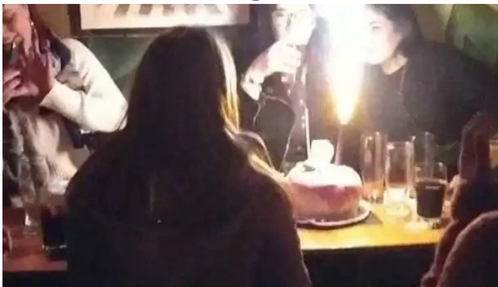
Novillos cerveza artesanal y gastronomía videos