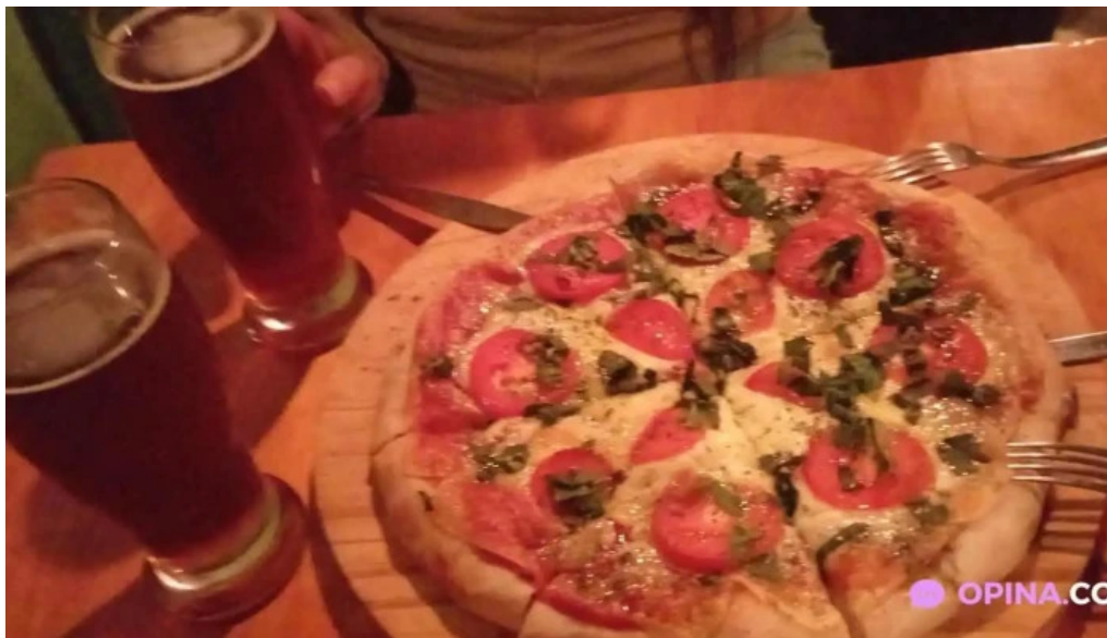
Novillos cerveza artesanal y gastronomía comida y bebida