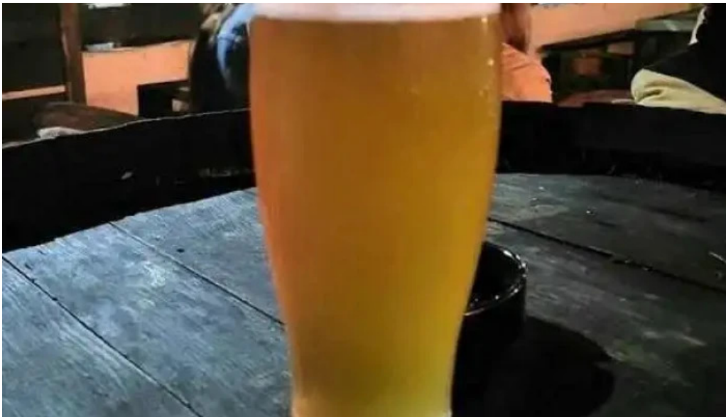
Novillos cerveza artesanal y gastronomía rocha