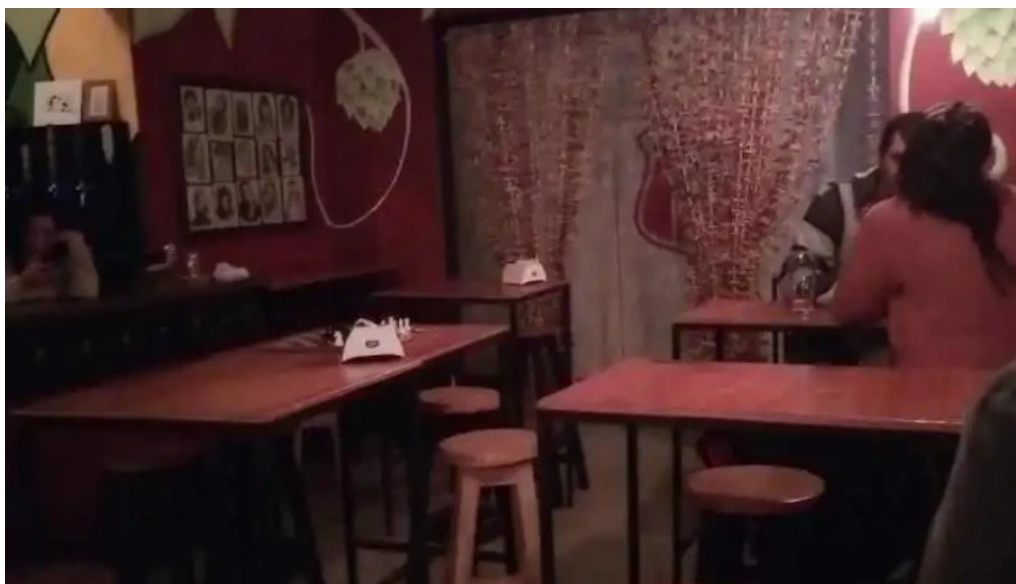
Novillos cerveza artesanal y gastronomía ambiente