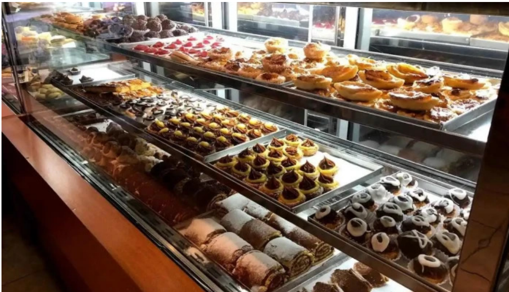
Confiteria city rivera