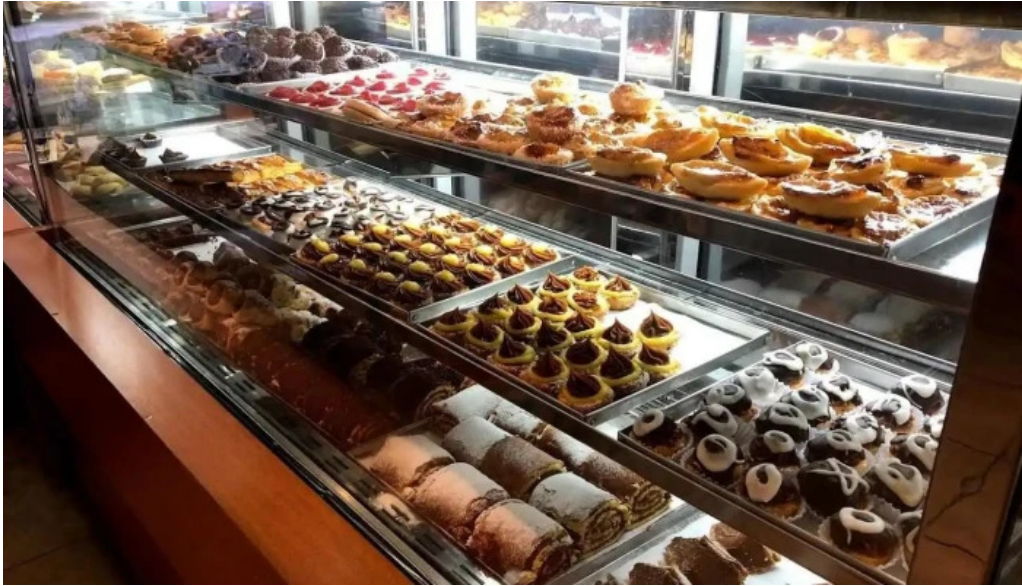
Confiteria city todas