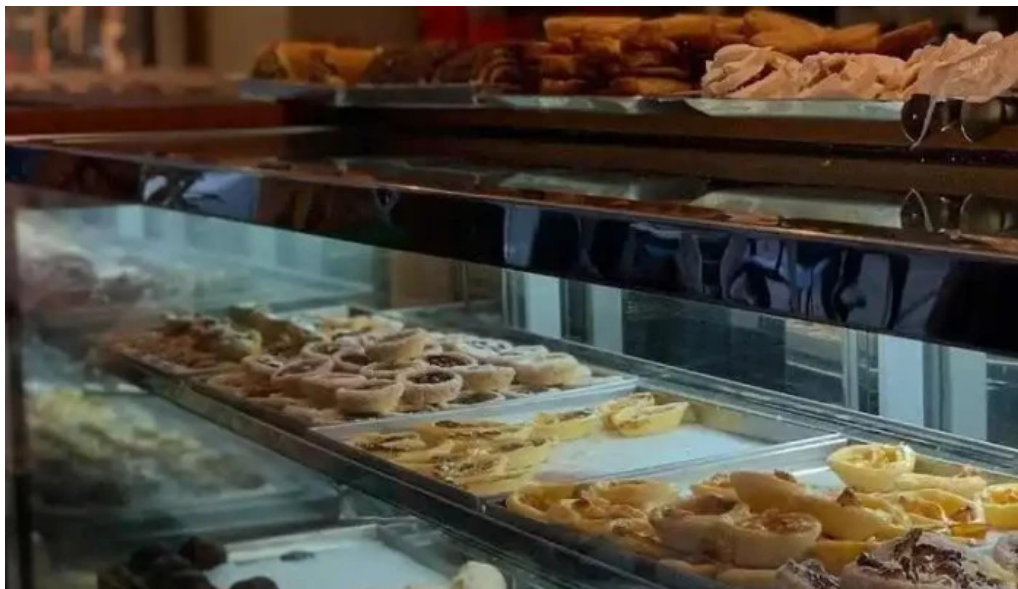
Confiteria city ambiente