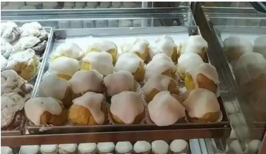
Confiteria city videos