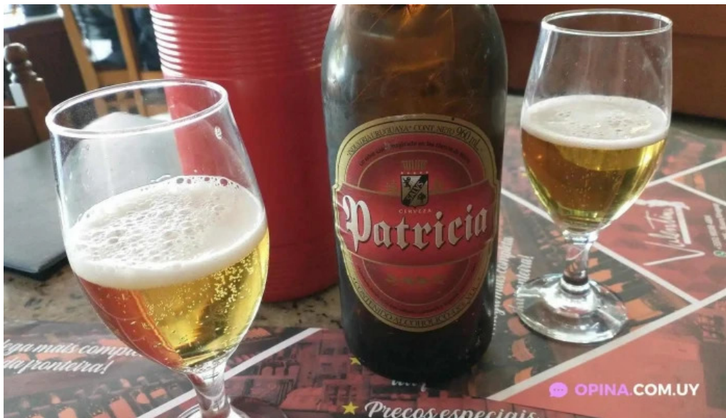
Confiteria city cerveza