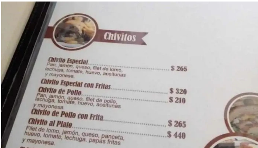
Confiteria city menu