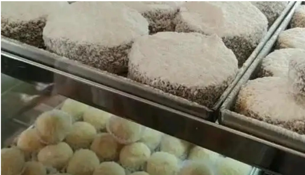
Confiteria city comida y bebida