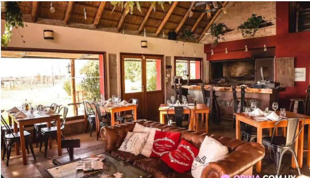
Restoran pueblo tannat ambiente