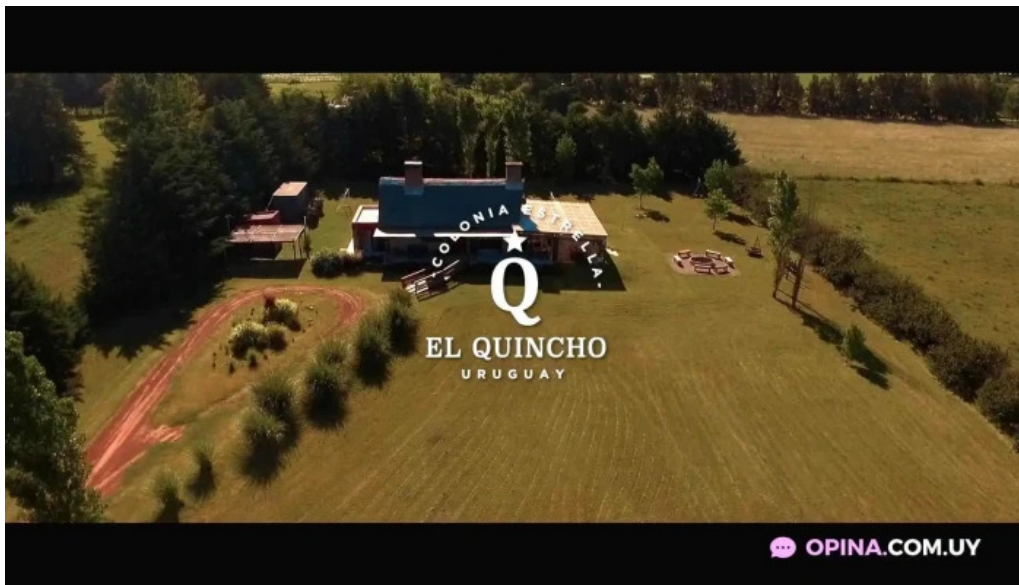
Restoran pueblo tannat del propietario