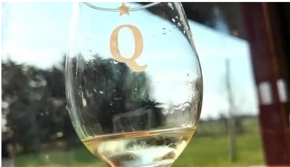
Restoran pueblo tannat vino