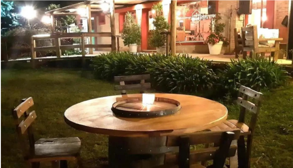
Restoran pueblo tannat todas