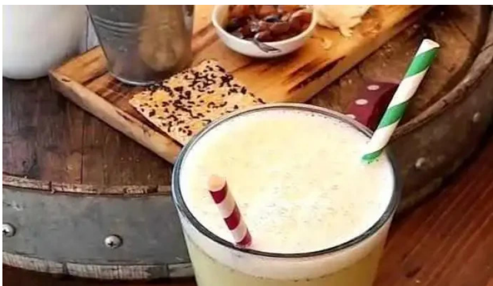
Restoran pueblo tannat videos