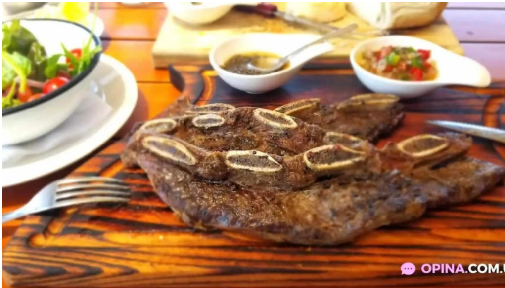
Restoran pueblo tannat filete