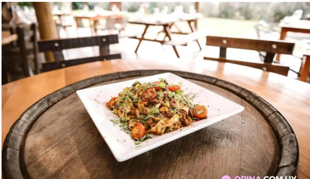
Restoran pueblo tannat comida y bebida