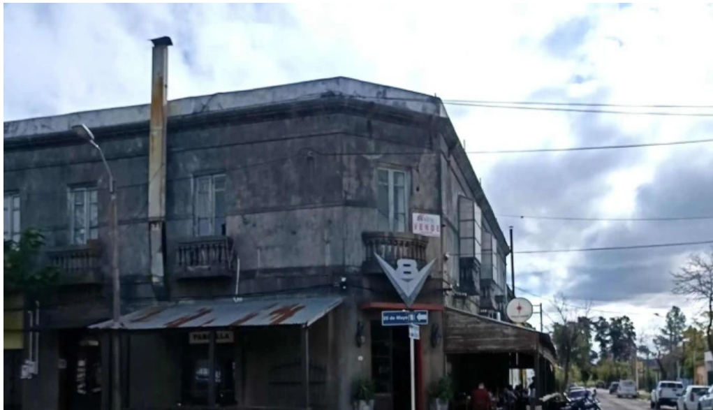
Restaurante v8 comentario 1