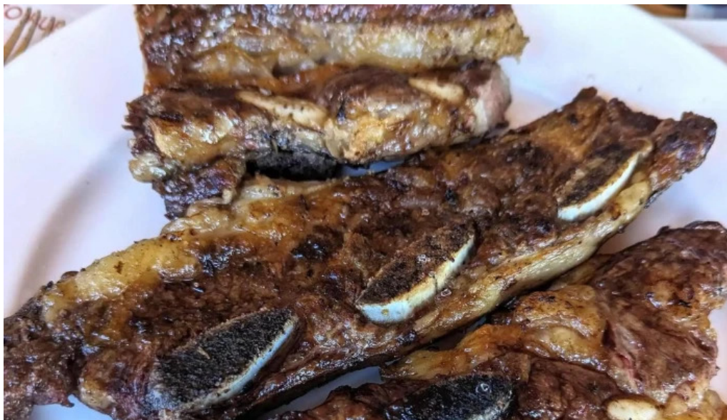
Restaurante v8 comentario 7