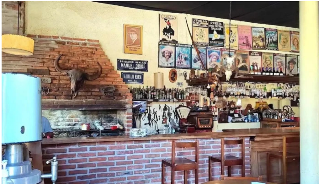
Restaurante v8 ambiente