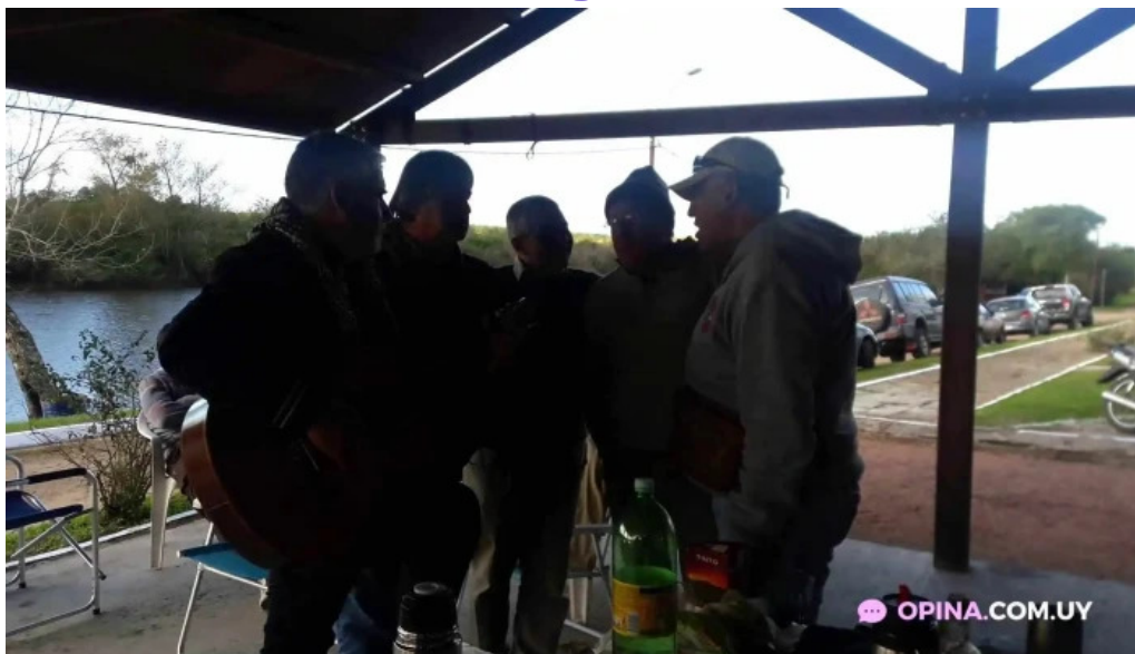
Restaurante v8 videos