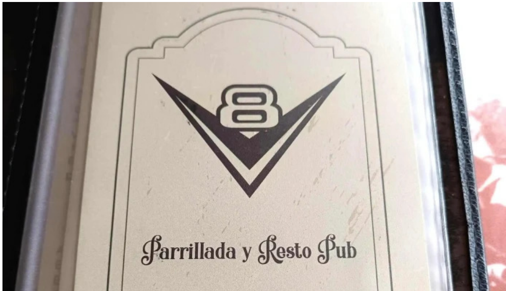
Restaurante v8 comentario 2