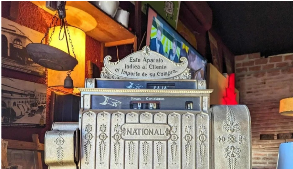
Restaurante v8 comentario 8