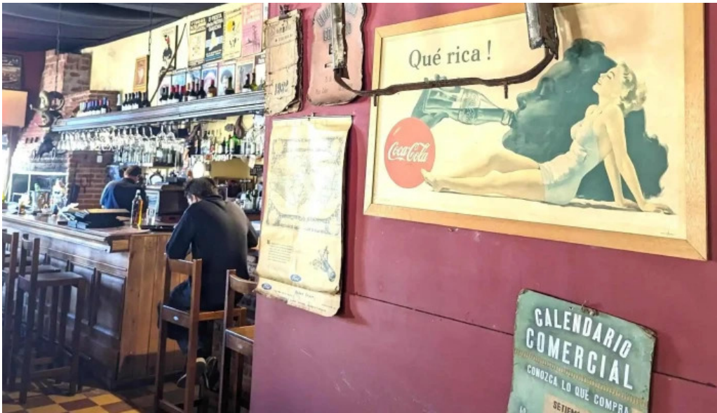
Restaurante v8 comentario 5