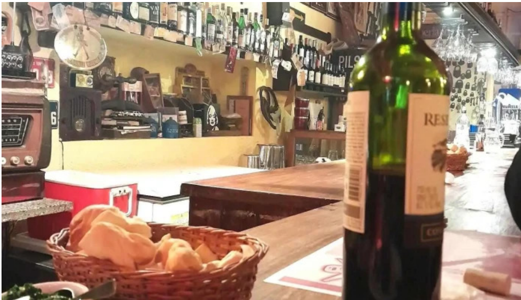
Restaurante v8 comidas y bebidas