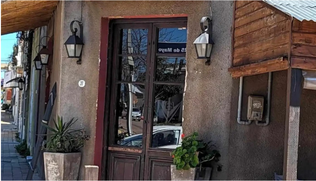
Restaurante v8 todo