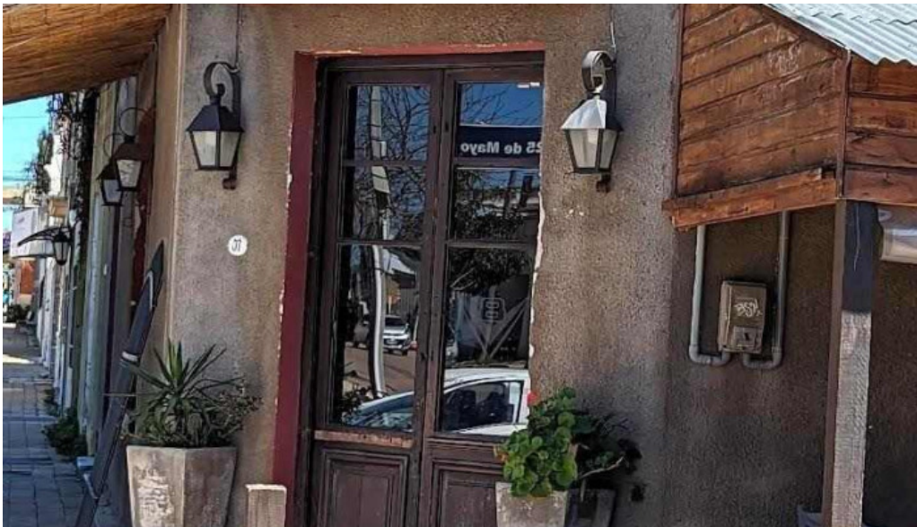
Restaurante v8 tacuarembó