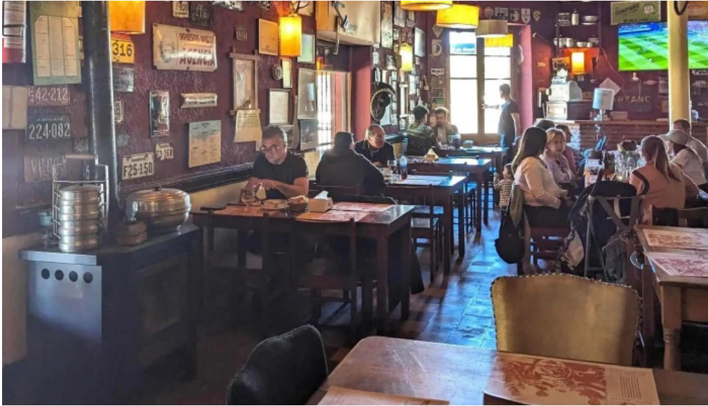
Restaurante v8 comentario 6