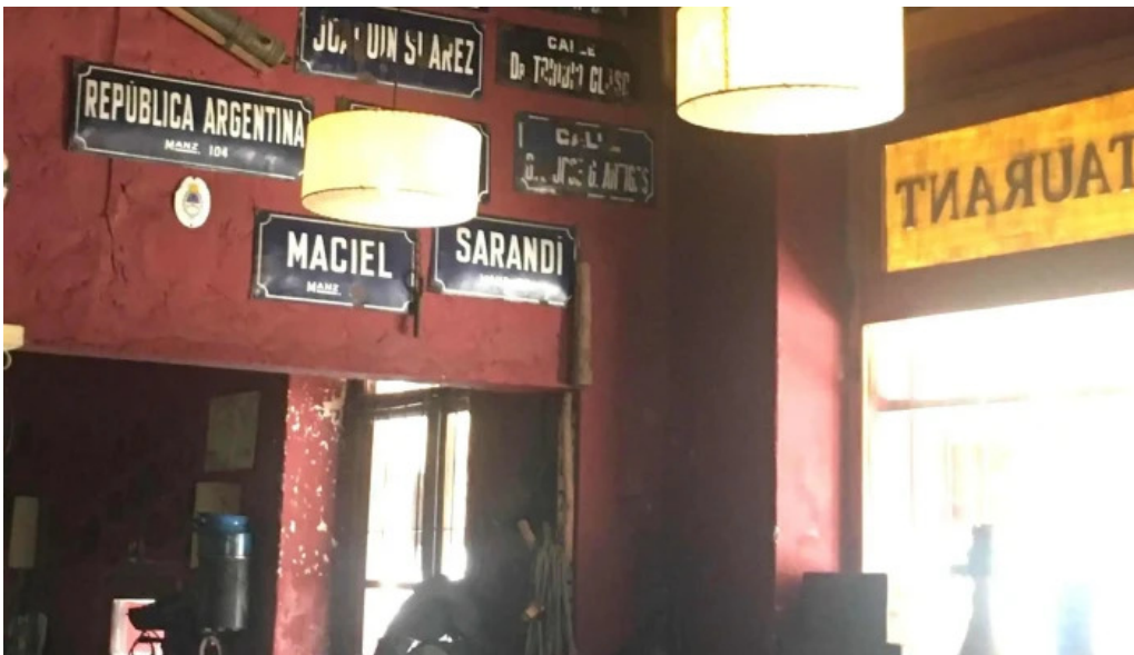
Restaurante v8 comentario 9