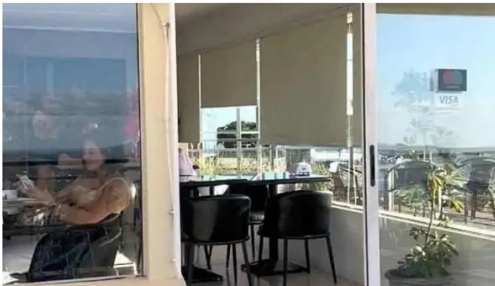
Restaurante puerto alto videos