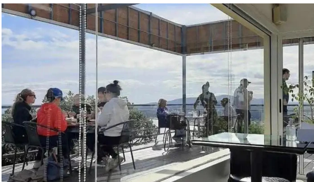
Restaurante puerto alto ambiente