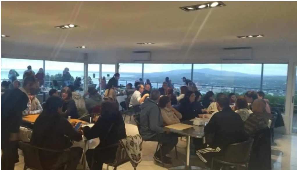
Restaurante puerto alto piriapolis