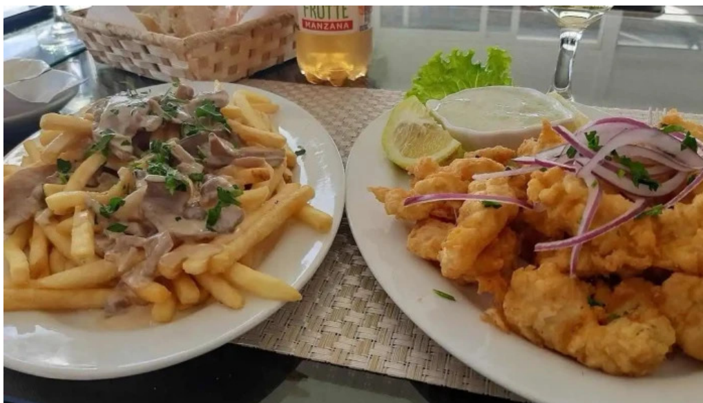
Restaurante puerto alto comida y bebida