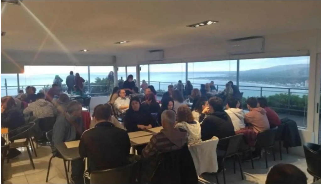
Restaurante puerto alto todas