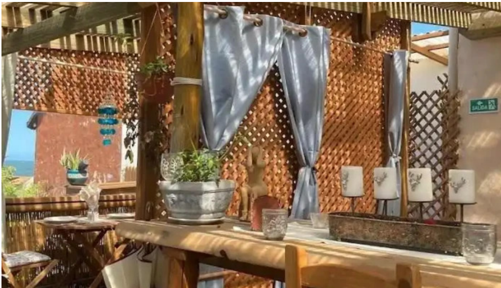
Restaurante pipikuku ambiente