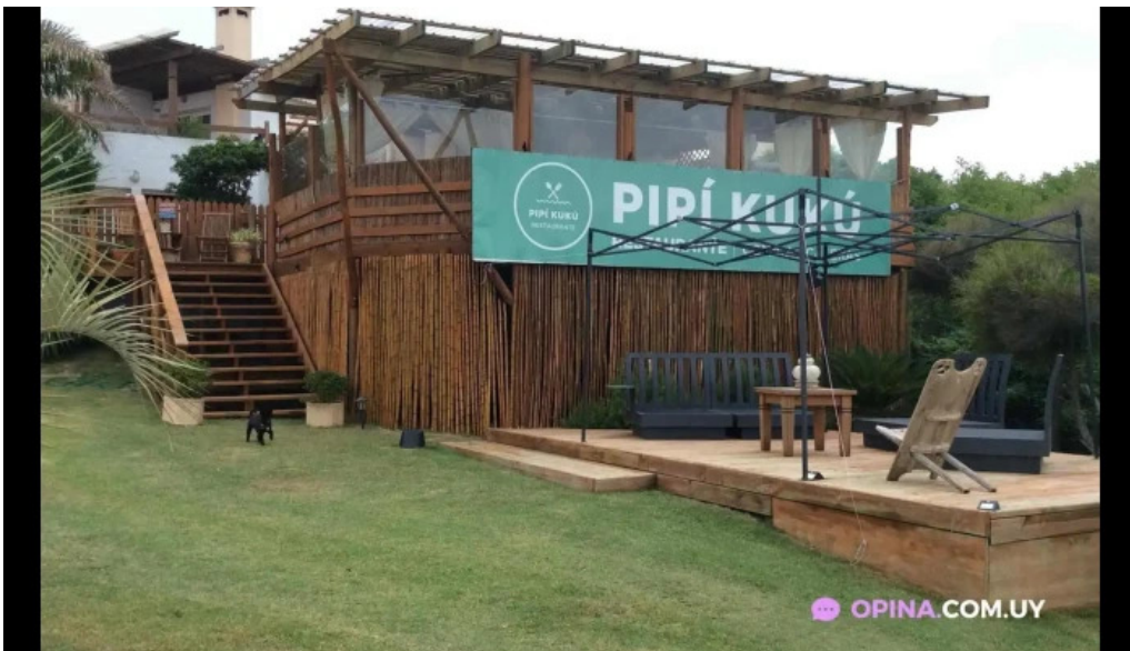
Restaurante pipikuku del propietario