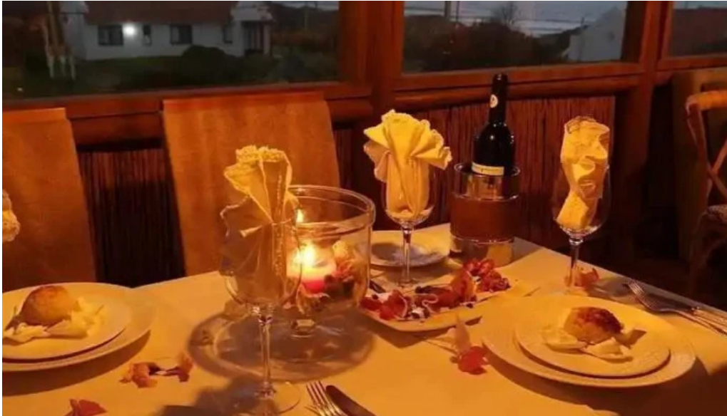
Restaurante pipikuku comida y bebida