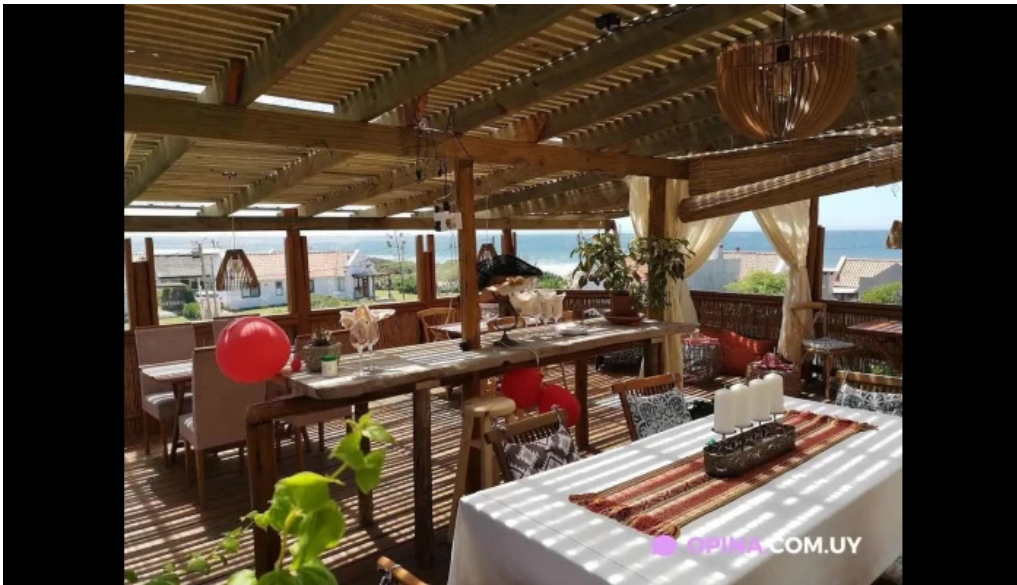
Restaurante pipikuku la aguada y costa azul