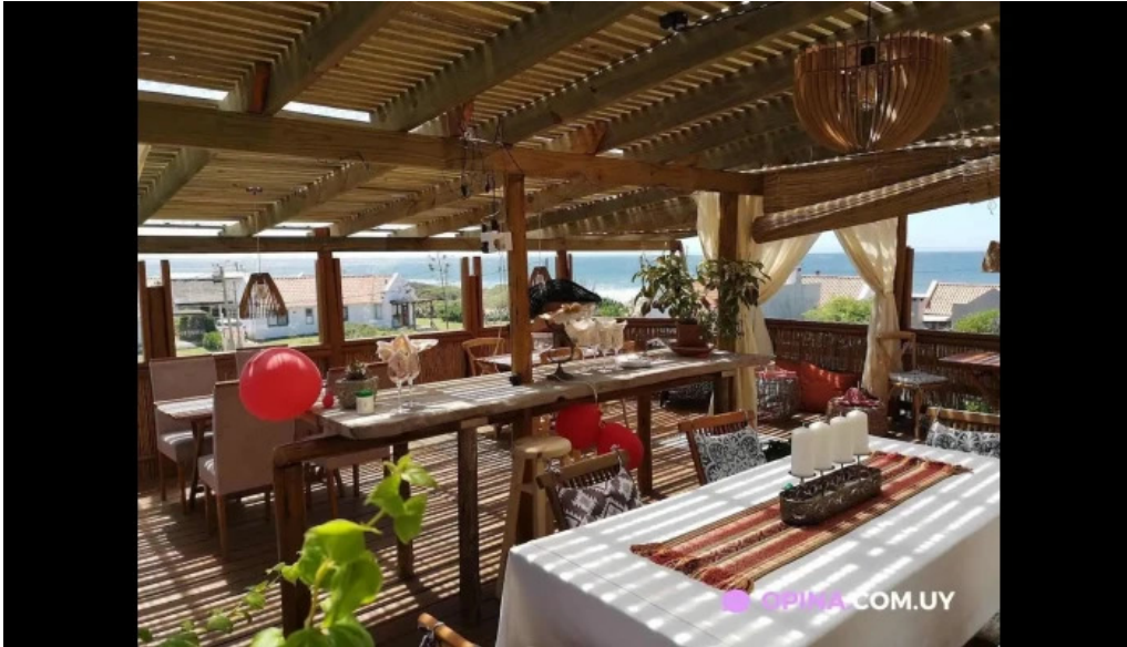
Restaurante pipikuku todas