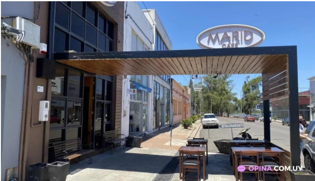
Restaurante mario cafe rio branco