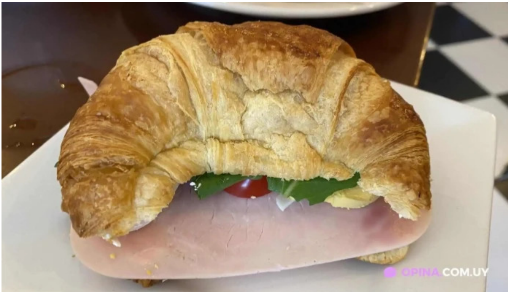
Restaurante mario cafe del propietario