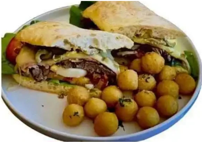
Restaurante mario cafe sandwich