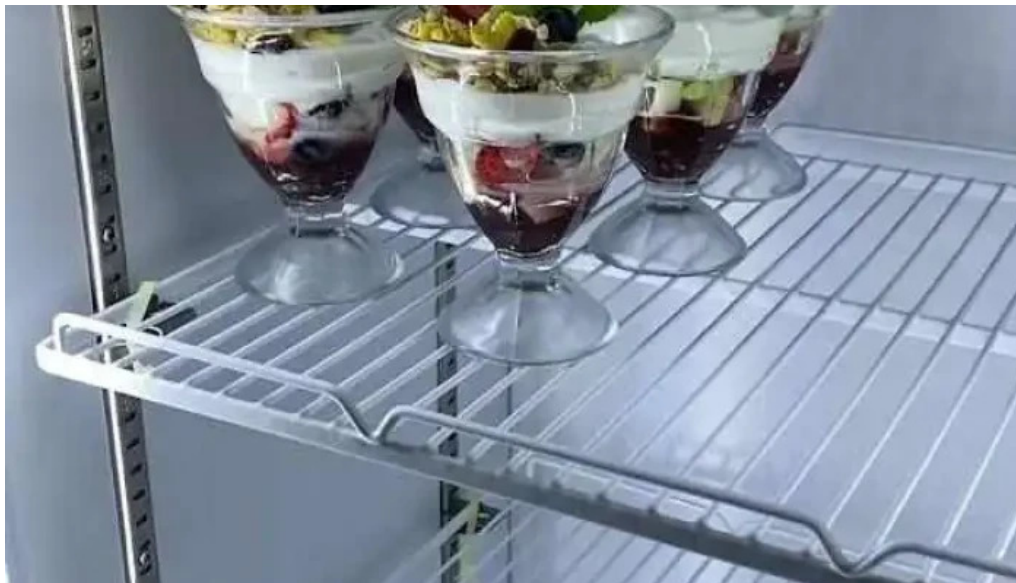
Restaurante mario cafe videos