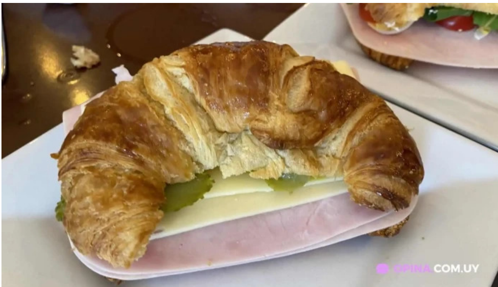
Restaurante mario cafe croissant