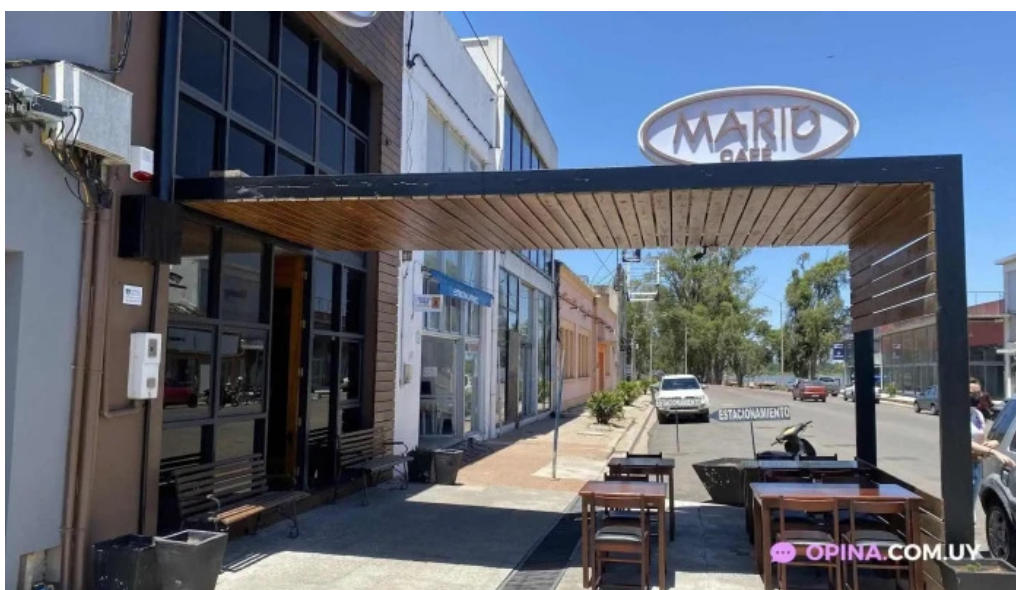
Restaurante mario cafe todas