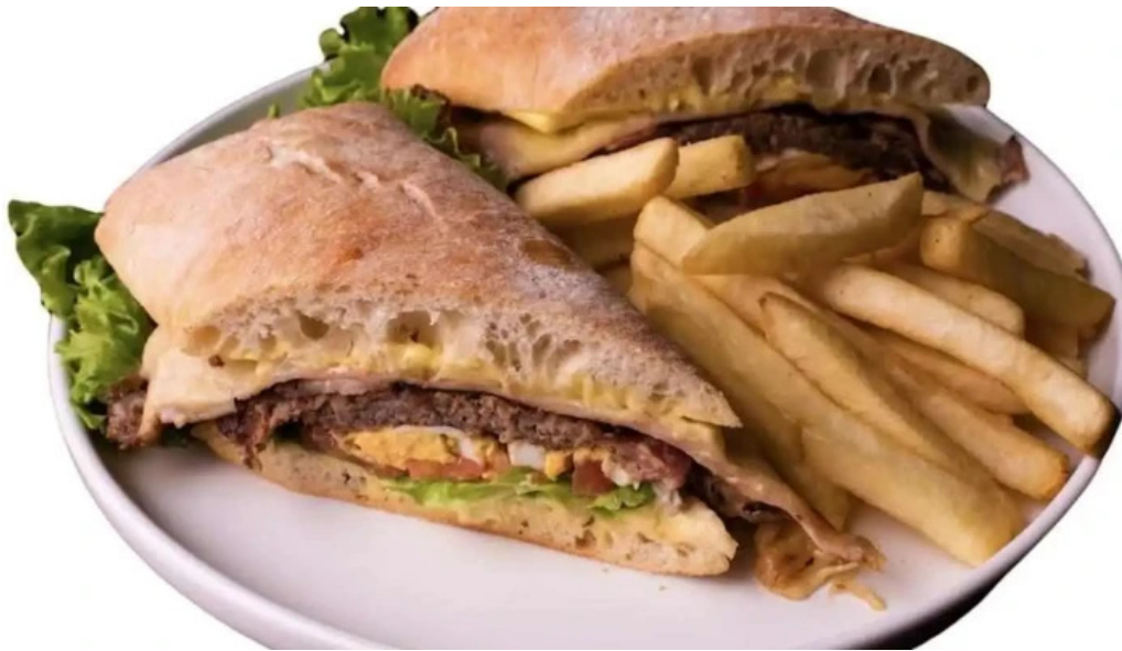
Restaurante mario cafe comida y bebida