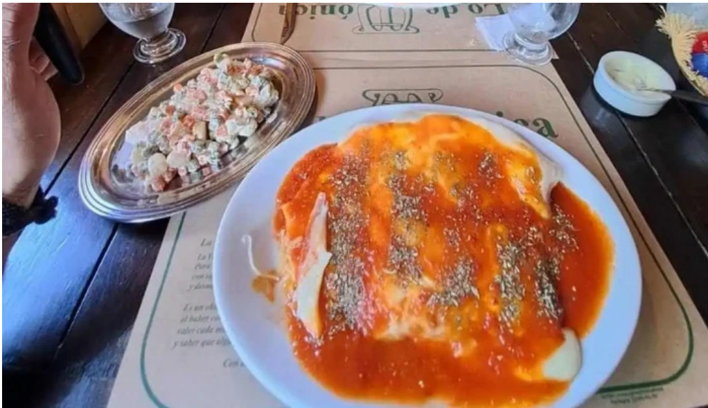
Restaurante lo de monica mas recientes