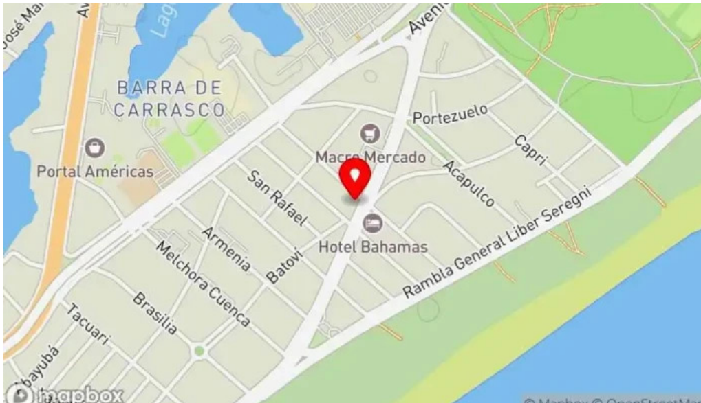
Restaurante lo de monica mapa