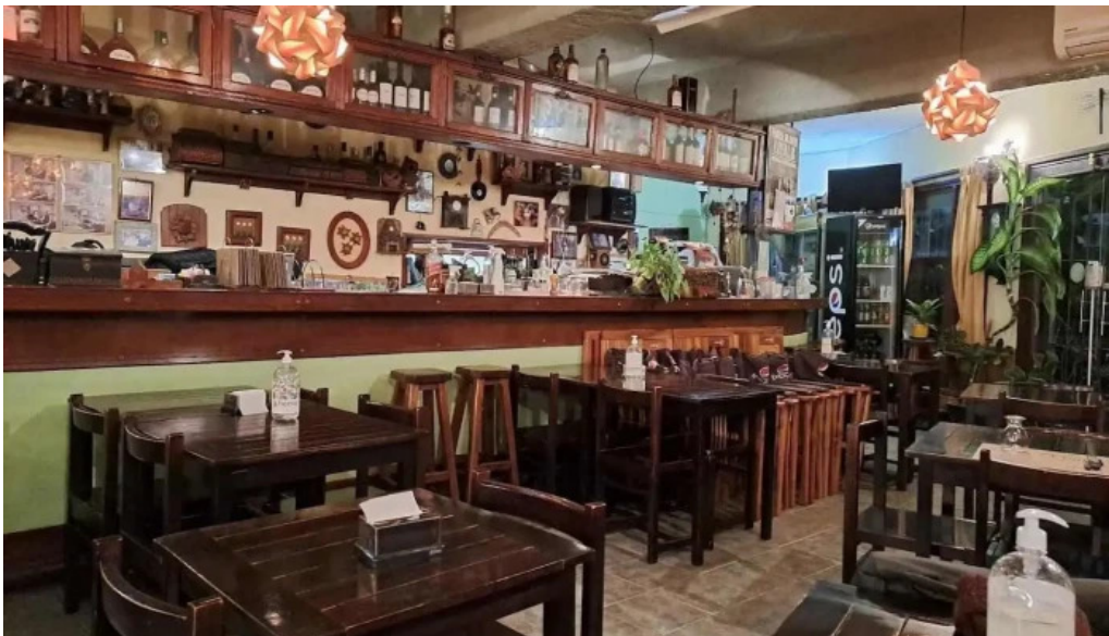
Restaurante lo de monica todas