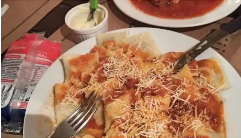
Restaurante lo de monica ravioli