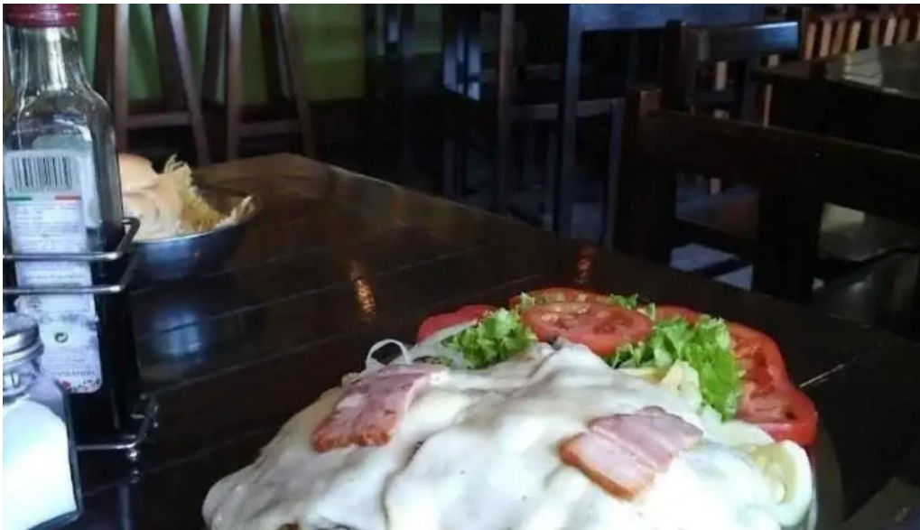
Restaurante lo de monica comida y bebida