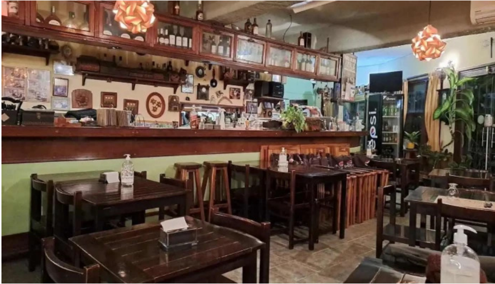
Restaurante lo de monica de la costa