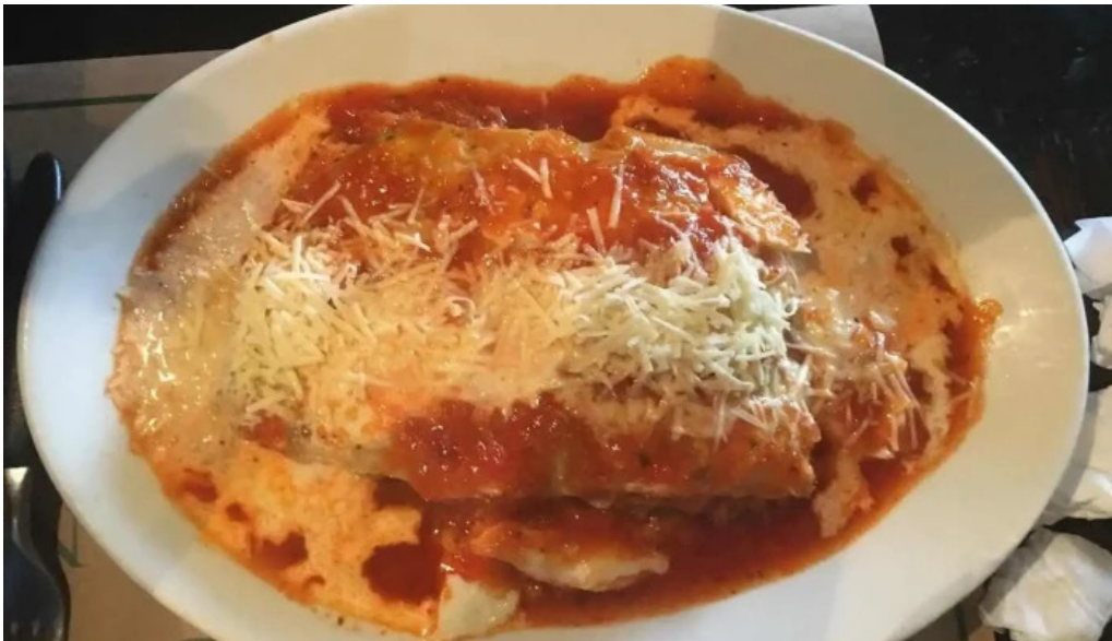
Restaurante lo de monica lasana