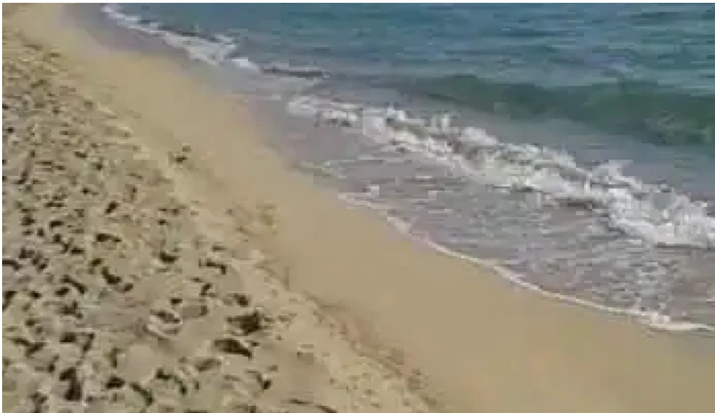
Restaurante lo de monica videos