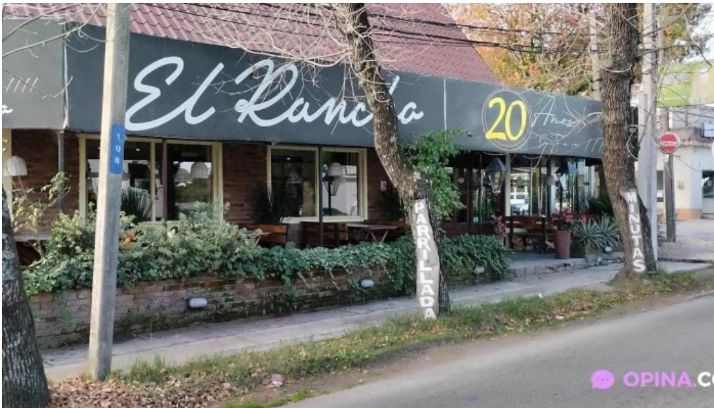
Restaurante el rancho trinidad