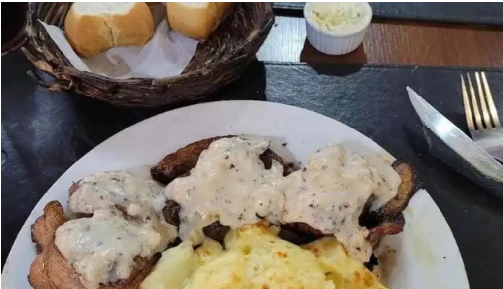
Restaurante el rancho solomillo