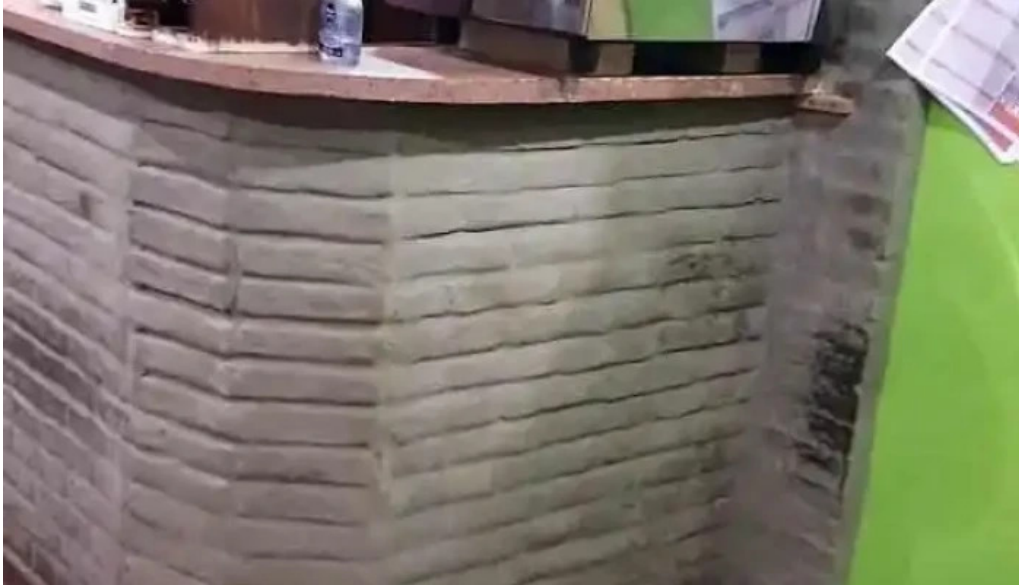
Restaurante el rancho videos