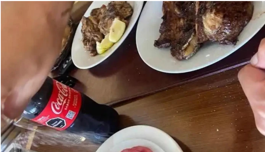
Restaurante el rancho mas recientes