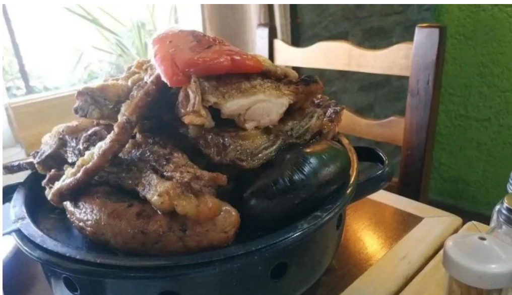
Restaurante el rancho churrasco