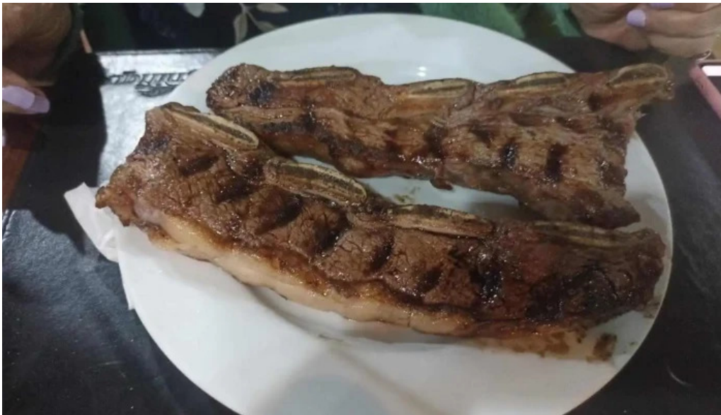
Restaurante el rancho comida y bebida