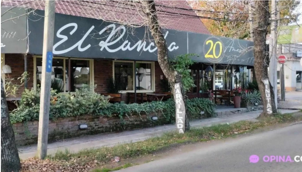
Restaurante el rancho todas