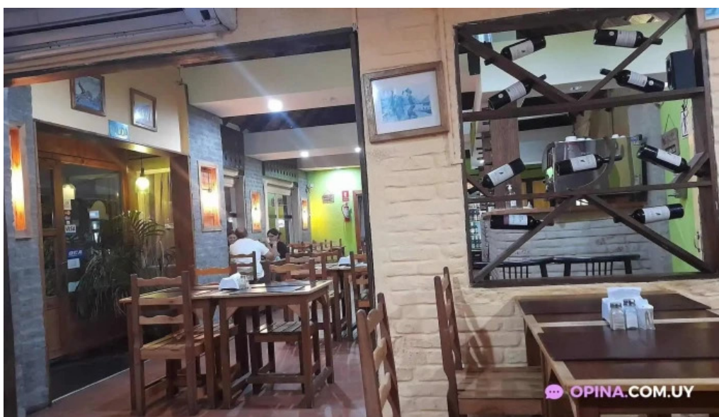
Restaurante el rancho ambiente