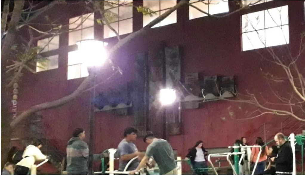
Restaurante el gamo comentario 5