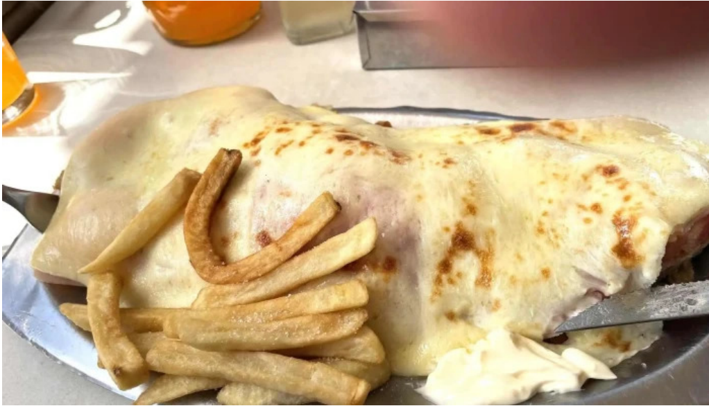
Restaurante el gamo papas fritas