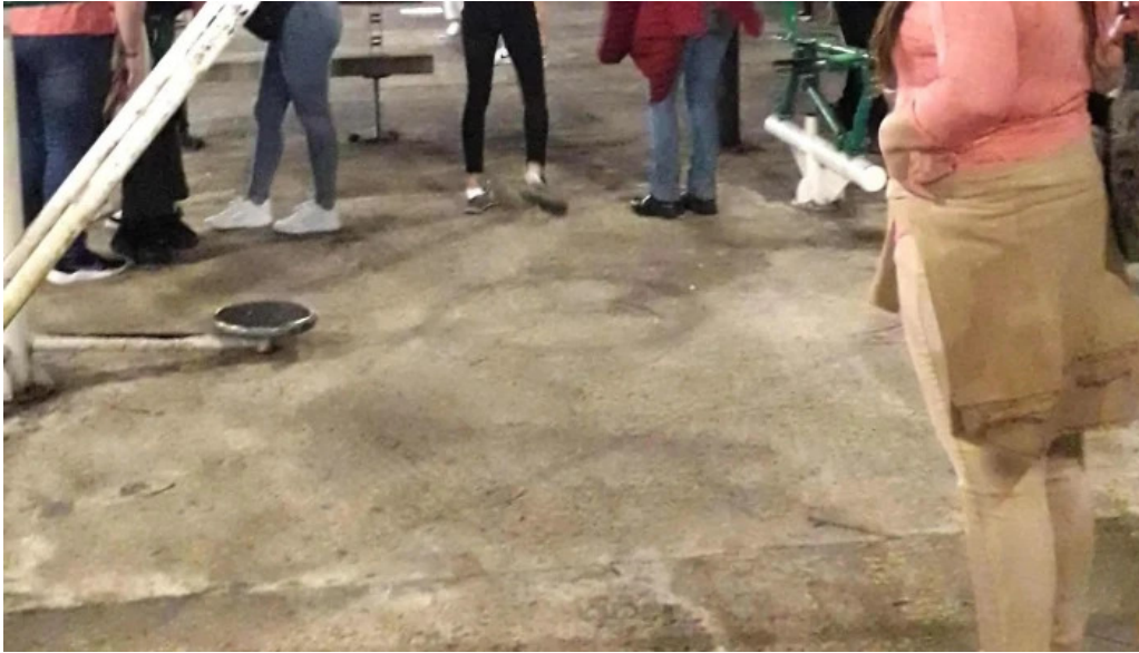
Restaurante el gamo comentario 3