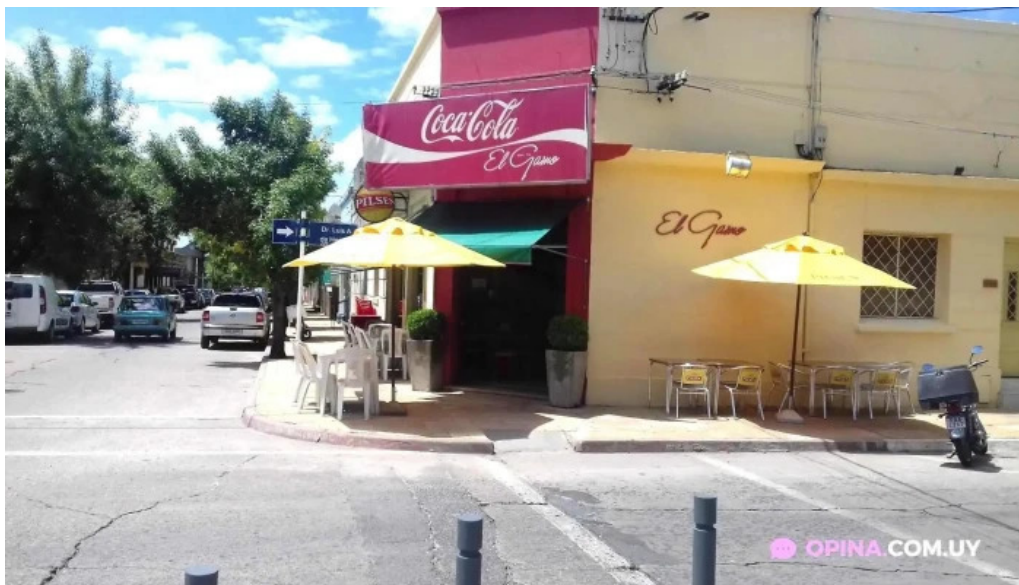
Restaurante el gamo tacuarembó