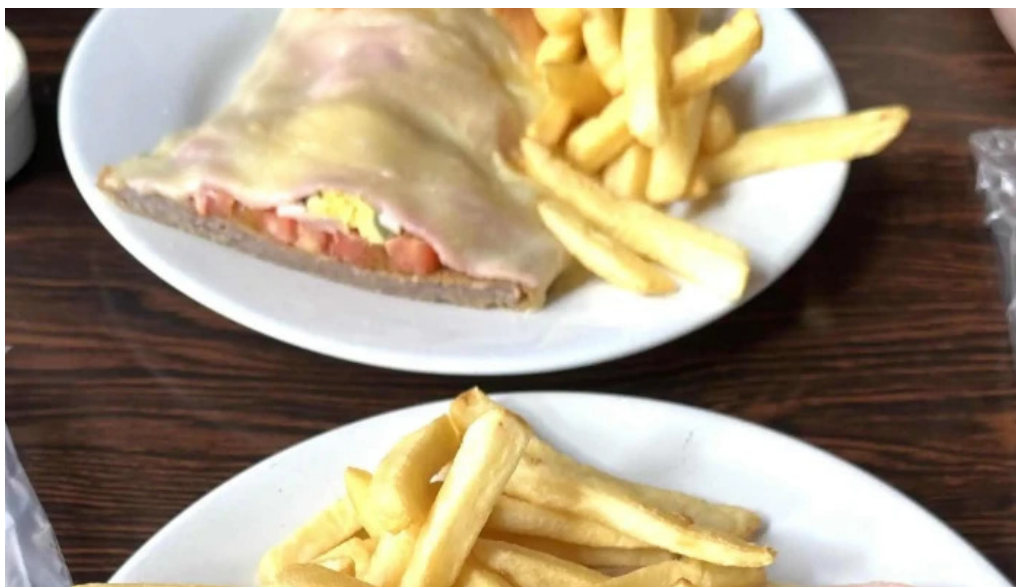
Restaurante el gamo comentario 1