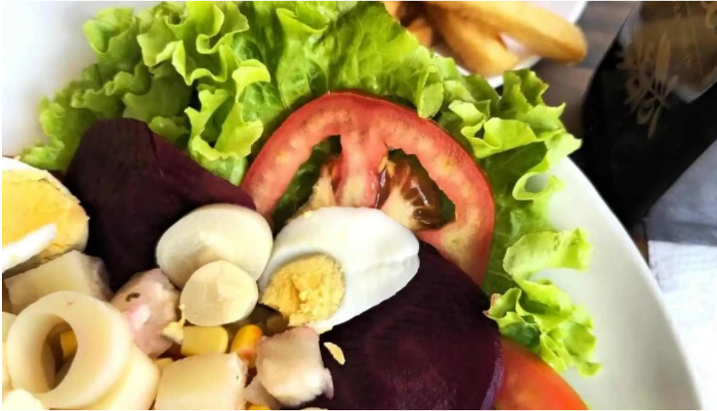
Restaurante el gamo comidas y bebidas