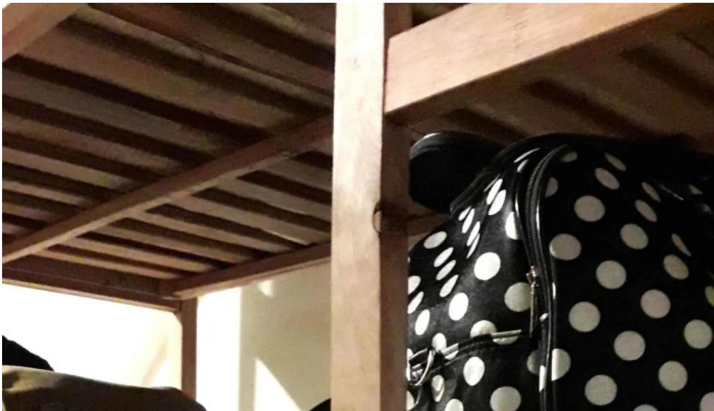
Restaurante el gamo comentario 6