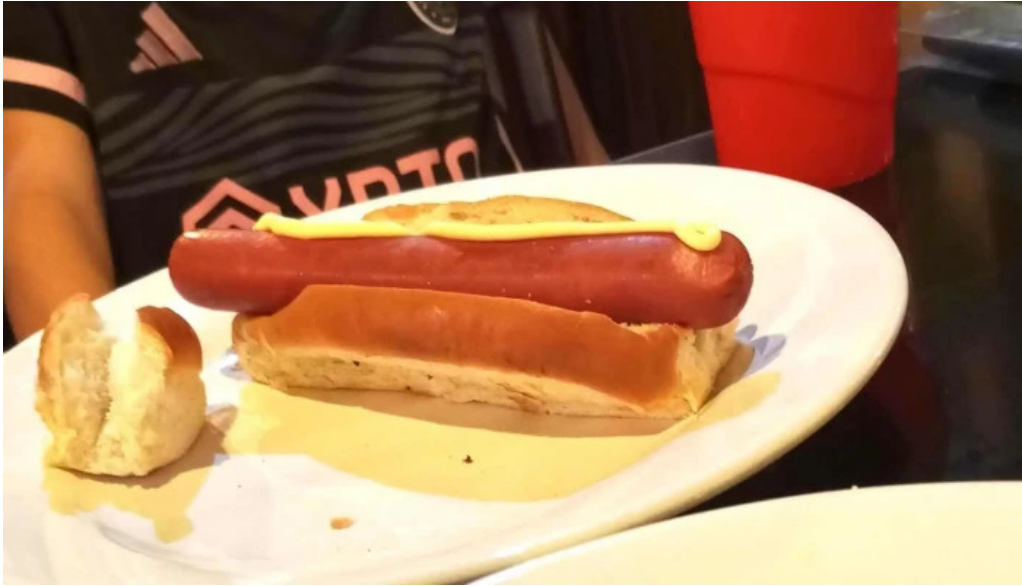
Restaurante el gamo comentario 7