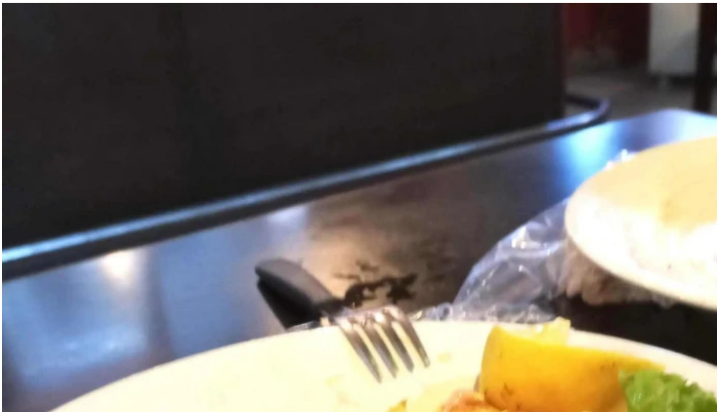
Restaurante el gamo comentario 8