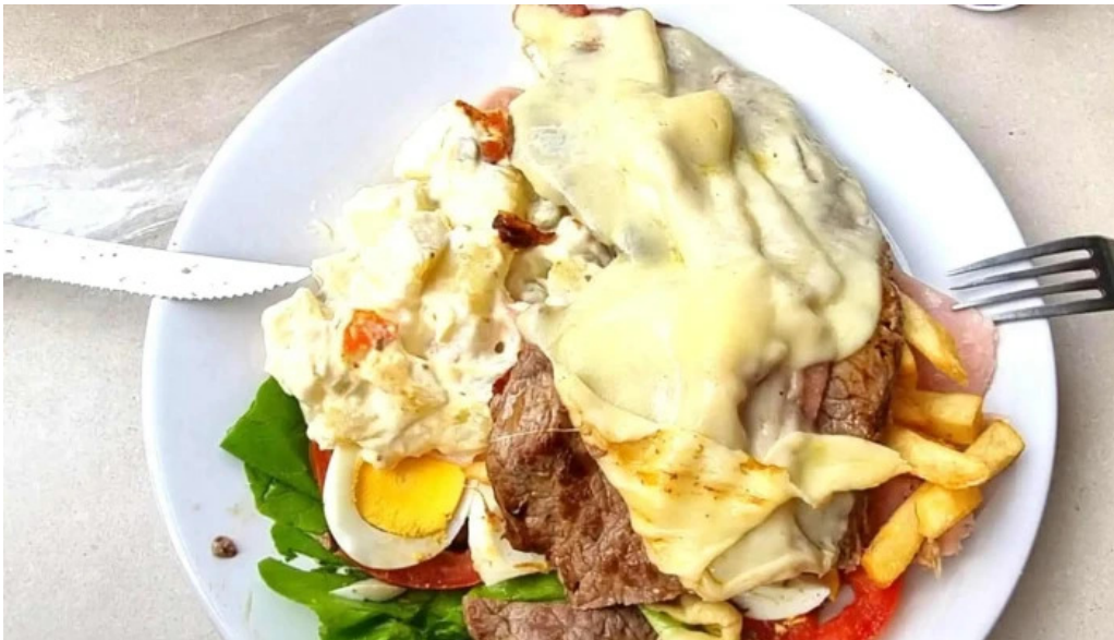
Restaurante el gamo comentario 2