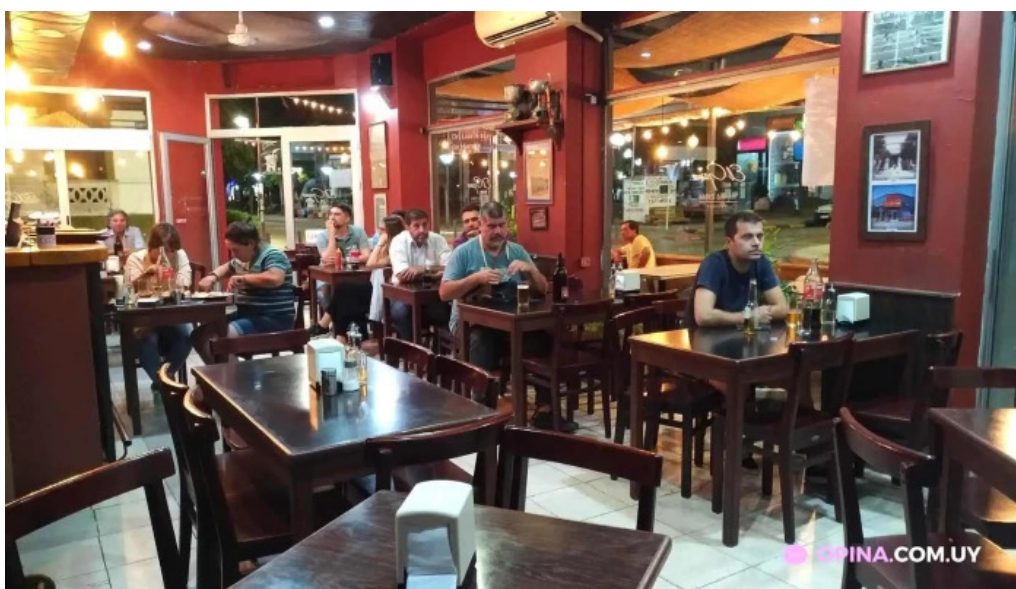
Restaurante el gamo ambiente