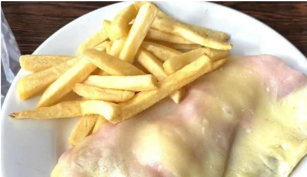
Restaurante el gamo milanese