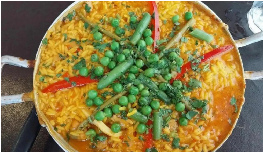
Restaurant yoyo mas recientes